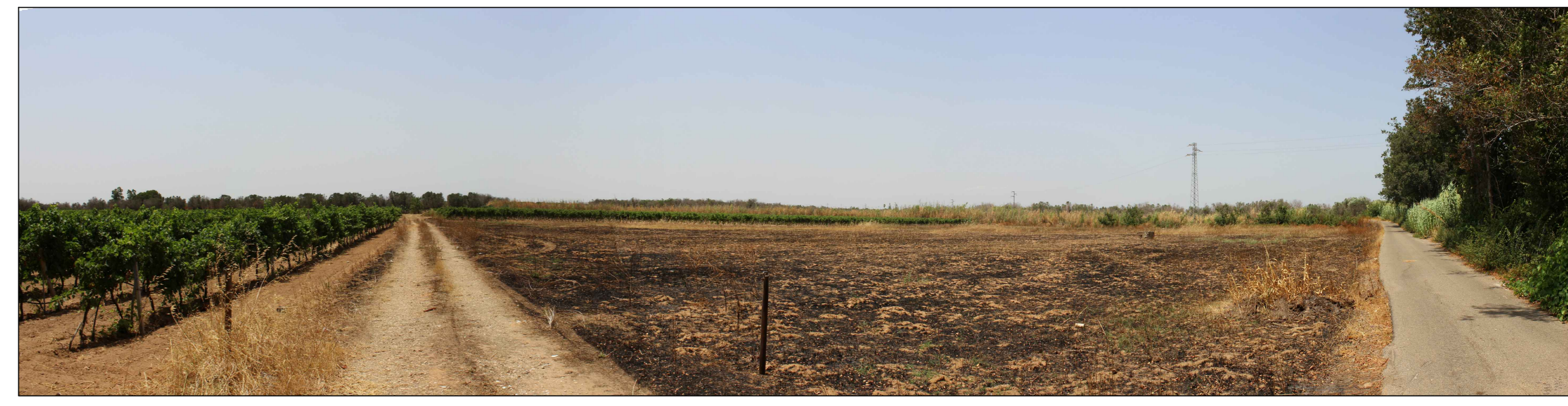
Panoramica - Stato di Progetto