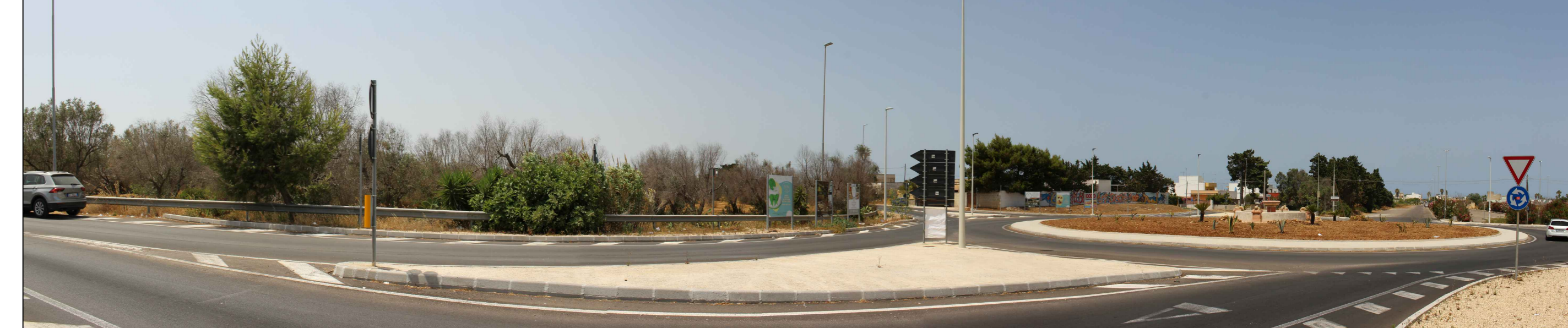
ID 1.25b - Bosco e paludi di Rauccio limite ovest