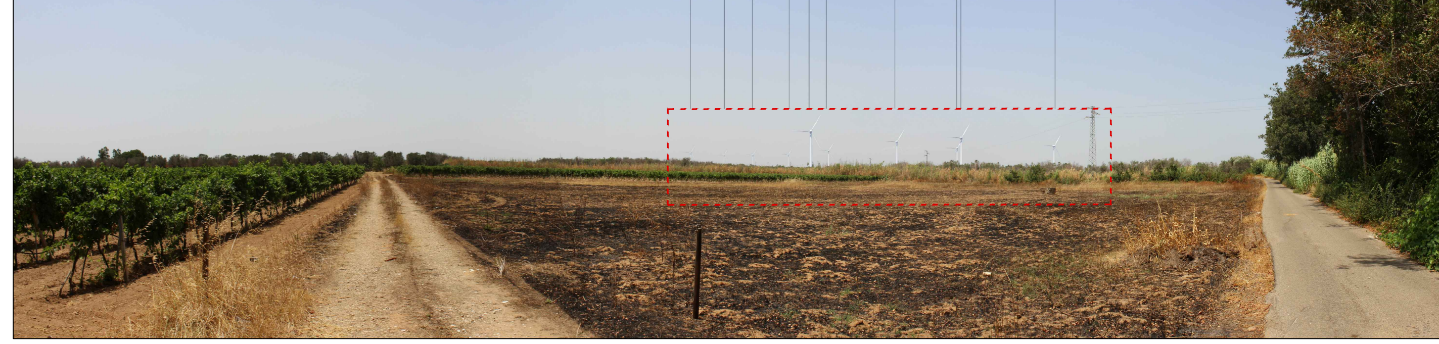
ID 1.24 - Abbazia Santa Maria Cerrate