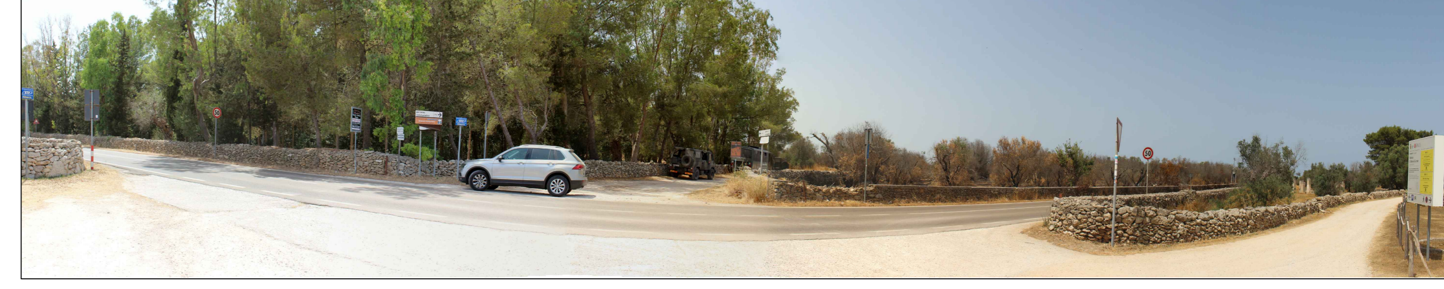
ID 1.25a - Bosco e paludi di Rauccio limite nord ovest