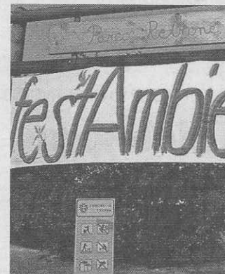
Festambiente al parco Retrone

«Con il nostro slogan vogliamo trasmettere una filosofia positiva in questo momento