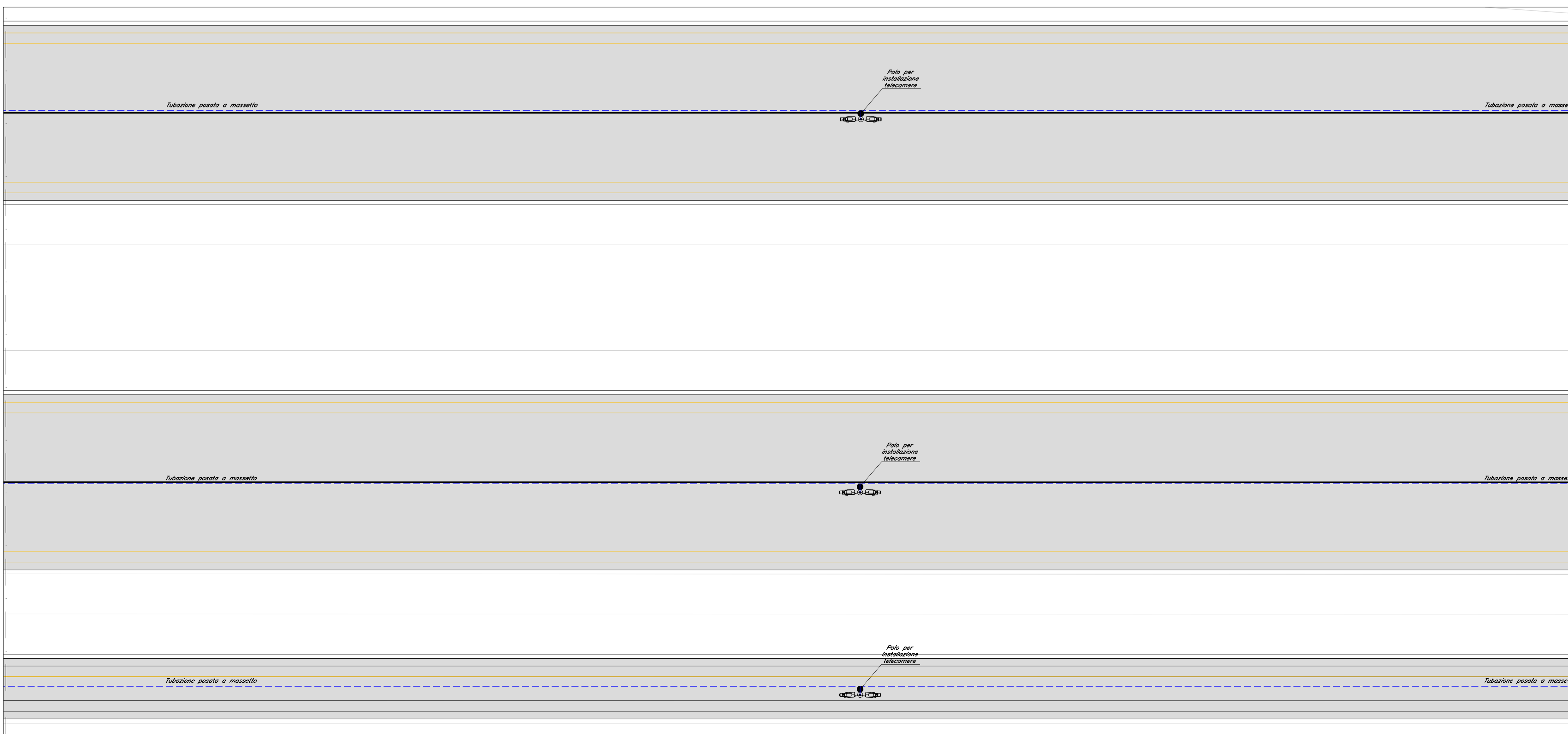
LAYOUT 2 IMPIANTO TVCC - STAZIONE VALLELUNGA