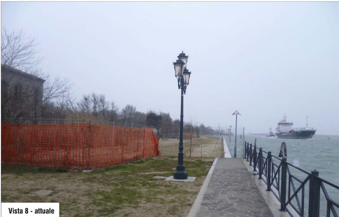
Vista 8 - attuale