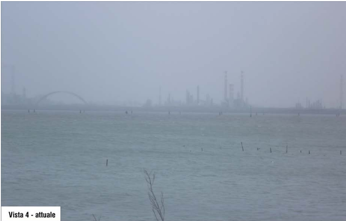
Vista 4 - attuale