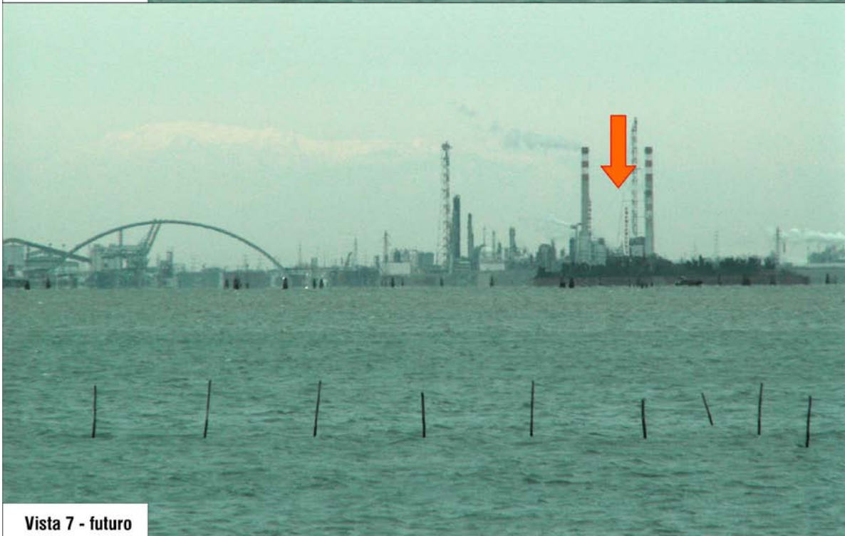
Vista 7 - futuro