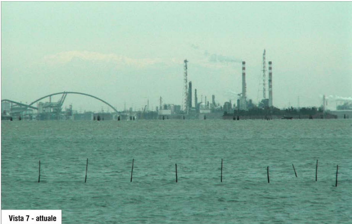
Vista 7 - attuale