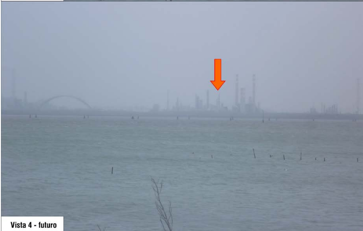
Vista 4 - futuro