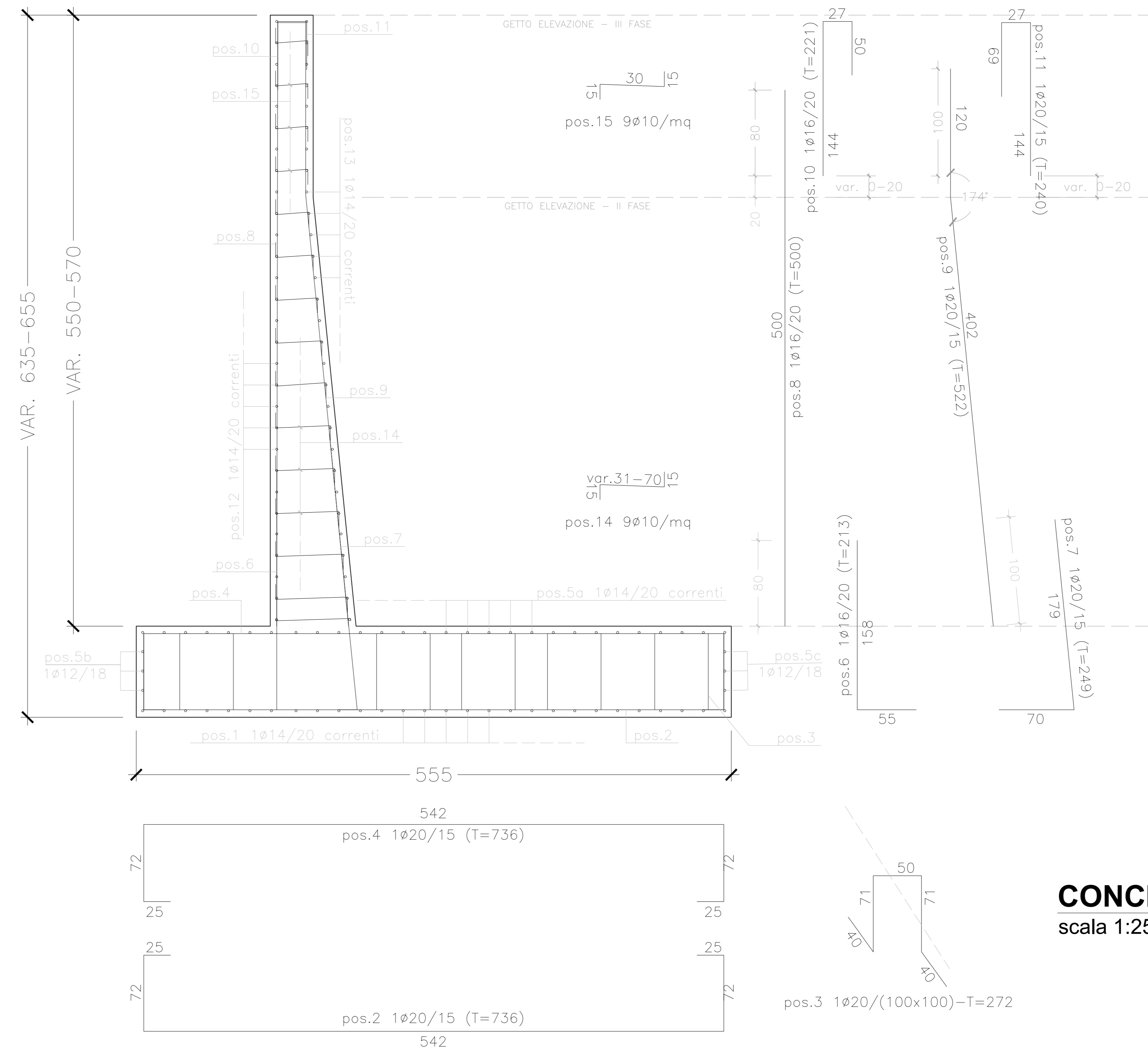
CONCIO E scala 1:25