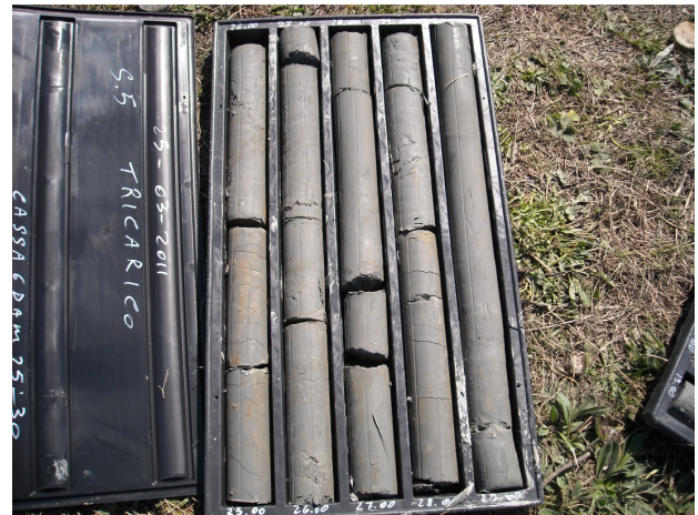
Sondaggio S5 CASSETTA N. 6 da mt. 25.00 a mt. 30.00