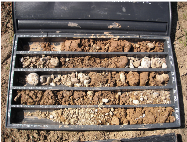
SONDAGGIO S4 CASSETTA N. 3 da mt. 10.00 a mt. 15.00