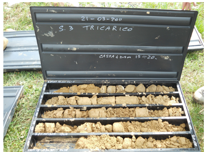
SONDAGGIO n. 3 CASSETTA N. 4 da mt. 15.00 a mt. 20.00