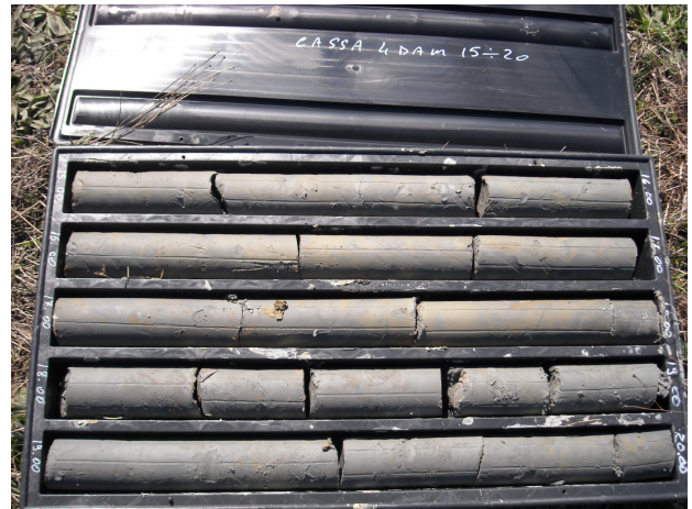
SONDAGGIO S5 CASSETTA N. 4 da mt. 15.00 a mt. 20.00