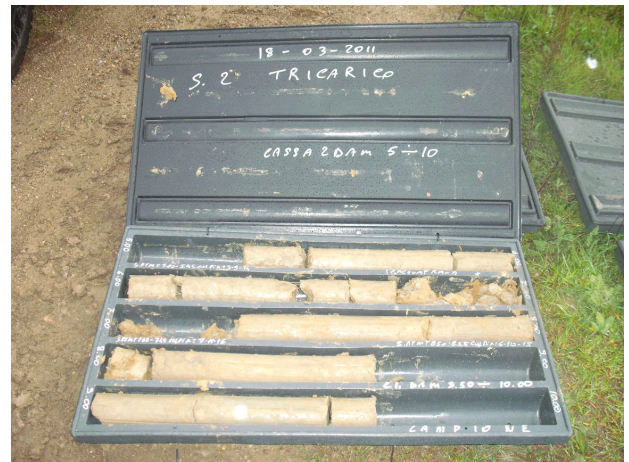
SONDAGGIO S2 CASSETTA N. 2 da mt. 5.00 a mt. 10.00