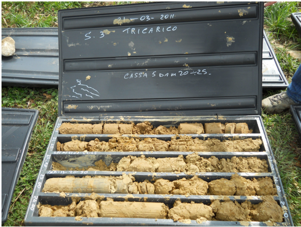
SONDAGGIO S3 CASSETTA N. 5 da mt. 20.00 a mt. 25.00