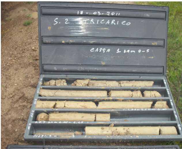
SONDAGGIO S2 CASSETTA N. 1 da mt. 0.00