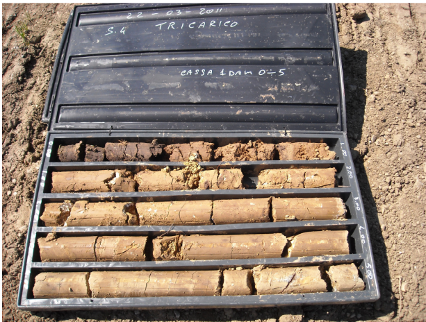
SONDAGGIO S4 CASSETTA N. 1 da mt. 0.00 a mt. 5.00