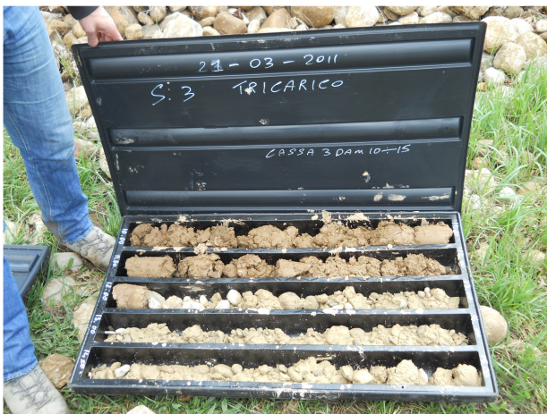
SONDAGGIO S3 CASSETTA N. 3 da mt. 10.00 a mt. 15.00