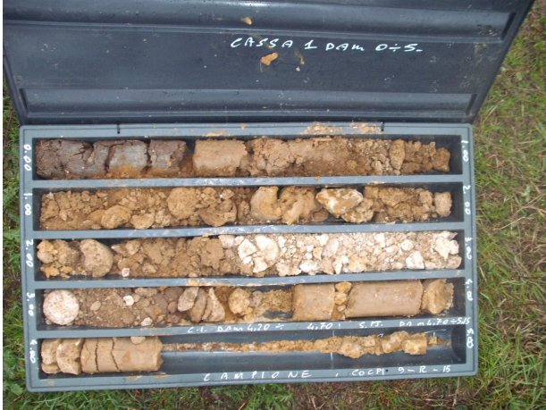
SONDAGGIO S1 CASSETTA N. 1 da mt. 0.00 a mt. 5.00