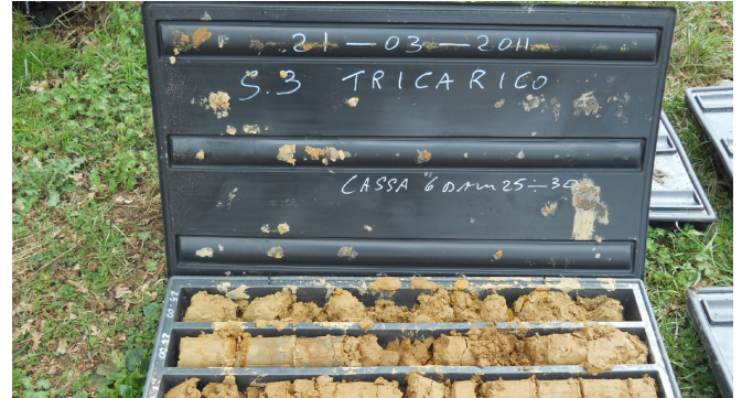
SONDAGGIO S3 CASSETTA N. 6 da mt. 25.00 a mt. 30.00