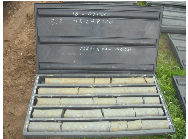
SONDAGGIO S2 CASSETTA N. 4 da mt. 15.00 a mt. 20.00