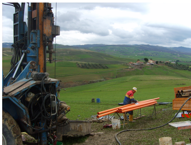
Postazione sondaggio n. 1