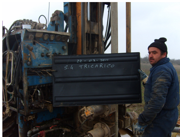
Postazione sondaggio n. 4