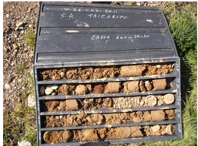
SONDAGGIO S4 CASSETTA N. 6 da mt. 25.00 a mt. 30.00