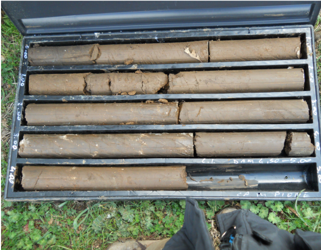
SONDAGGIO S3 CASSETTA N. 1 da mt. 0.00 a mt. 5.00