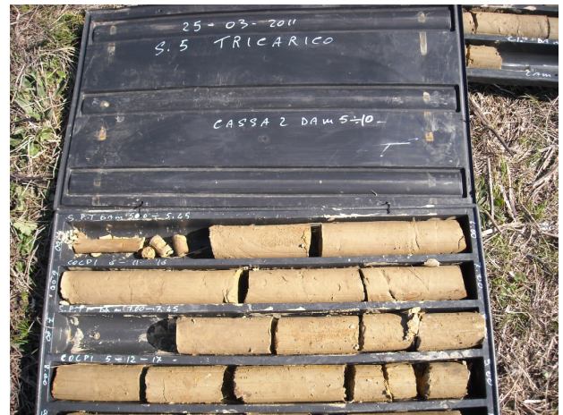
SONDAGGIO S5 CASSETTA N. 2 da mt. 5.00 a mt. 10.00