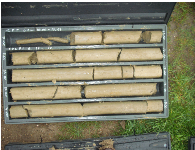
SONDAGGIO S2 CASSETTA N. 3 da mt. 10.00 a mt 15.00