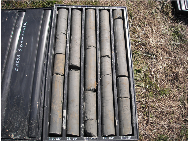
SONDAGGIO S5 CASSETTA N. 5 da mt. 20.00 a mt. 25.00