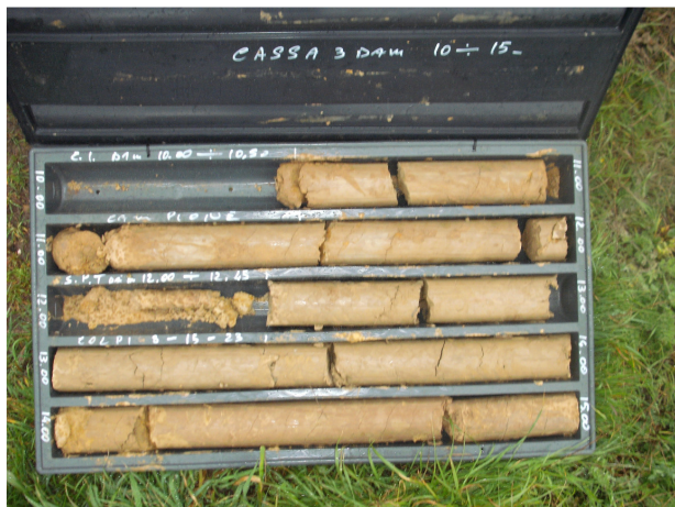
SONDAGGIO S1 CASSETTA N. 3 da mt. 10.00 a mt. 15.00