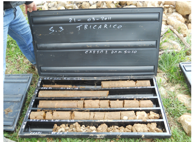
SONDAGGIO S3 CASSETTA N. 2 da mt. 5.00 a mt. 10.00