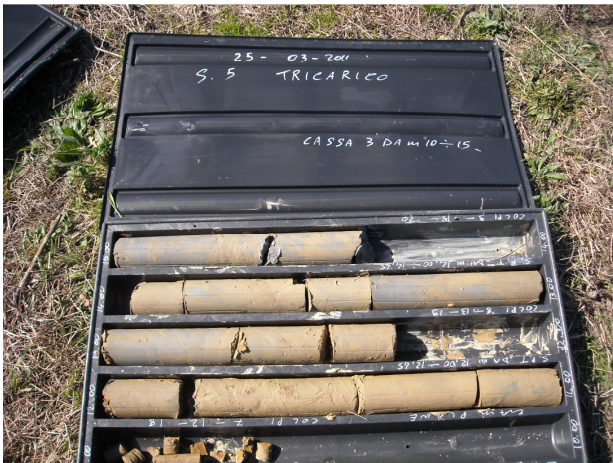
SONDAGGIO S5 CASSETTA N. 3 da mt. 10.00 a mt. 15.00