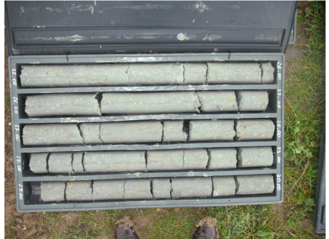
SONDAGGIO S2 CASSETTA N. 6 da mt. 25.00 a mt. 30.00