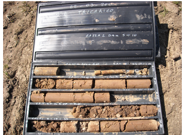
SONDAGGIO S4 CASSETTA N. 2 da mt. 5.00 a mt. 10.00