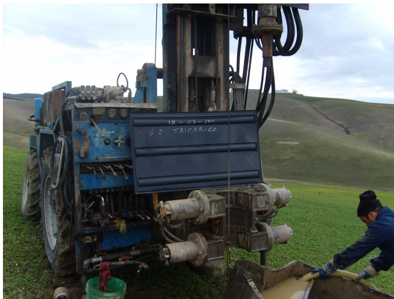
Postazione sondaggio n. 2