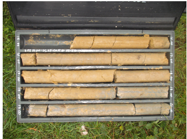
SONDAGGIO S1 CASSETTA N. 4 da mt. 15.00 a mt. 20.00