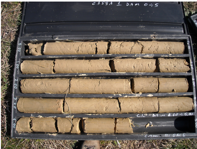
SONDAGGIO S5 CASSETTA N. 1 da mt. 0.00 a mt. 5.00