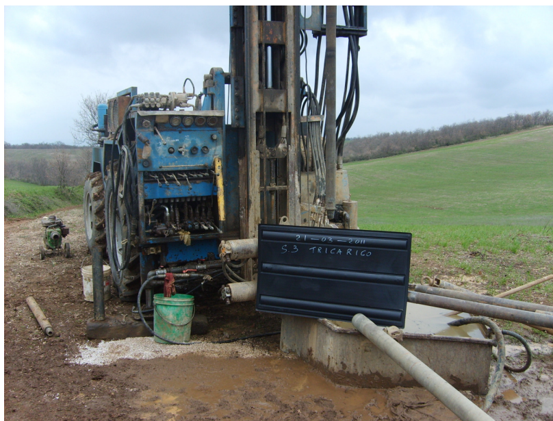
Postazione sondaggio n. 3