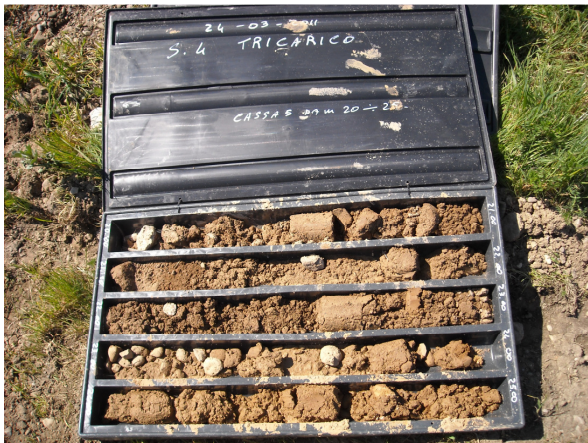
SONDAGGIO S4 CASSETTA N. 5 da mt. 20.00 a mt. 25.00