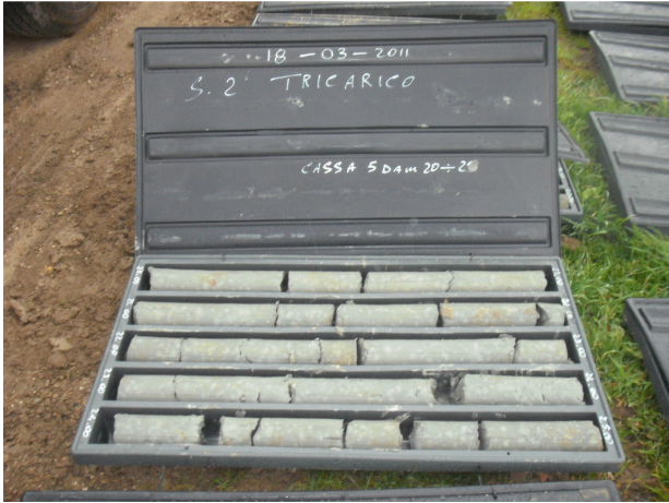
SONDAGGIO S2 CASSETTA N. 5 da mt. 20.00 a mt. 25.00