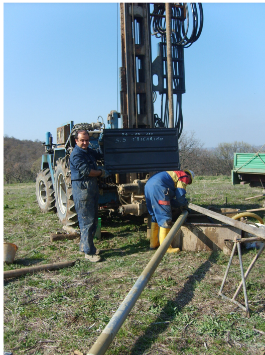
Postazione sondaggio n. 5