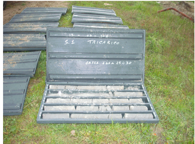
SONDAGGIO S1 CASSETTA N. 6 da mt. 25.00 a mt. 30.00