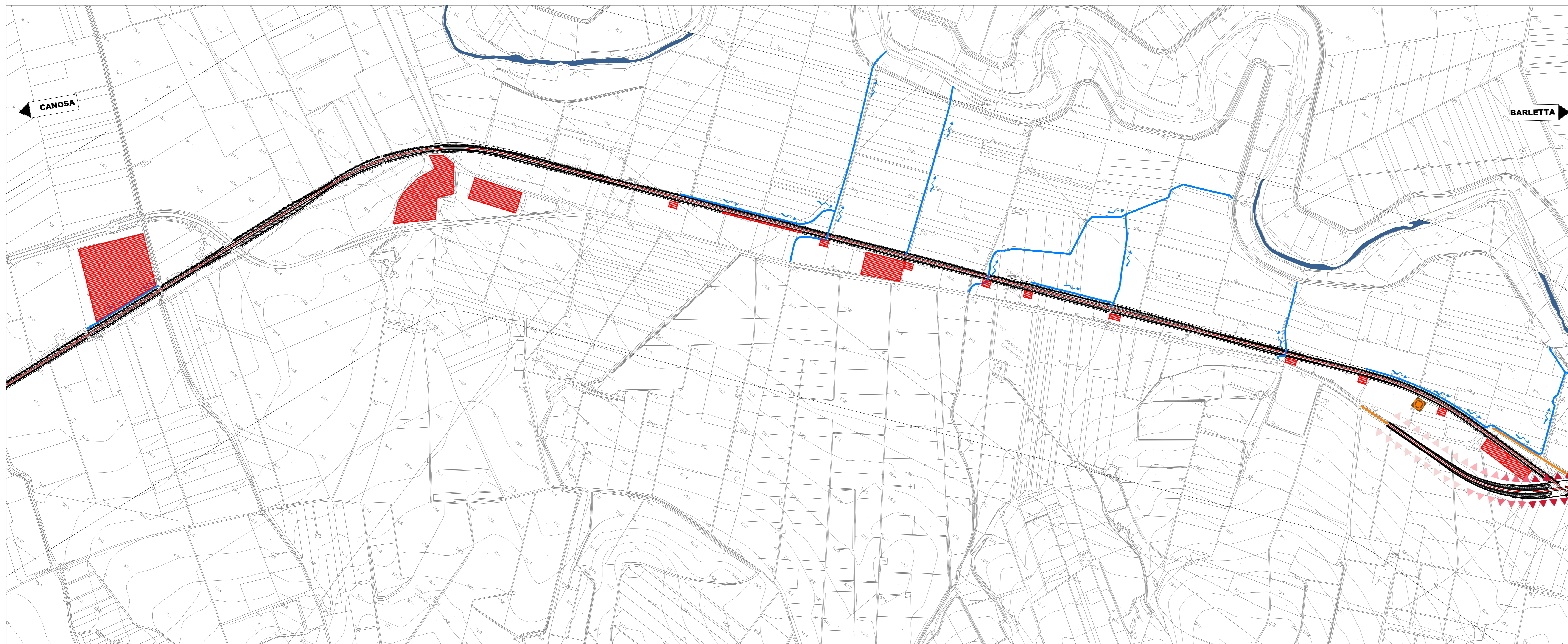
TAVOLA 4 - CARTA DELLA VISUALITA'