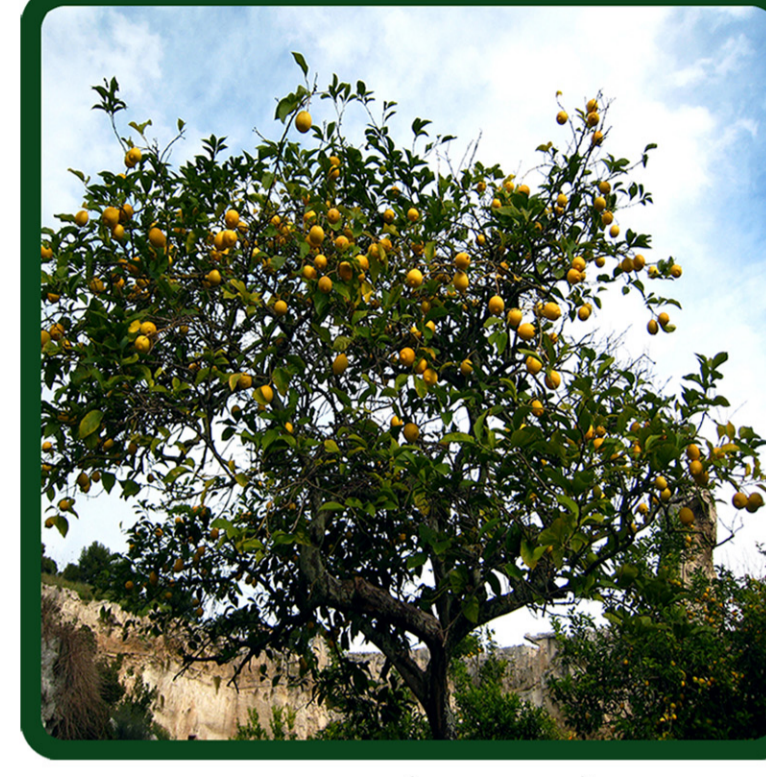
CITRUS X LEMON (LIMONE)