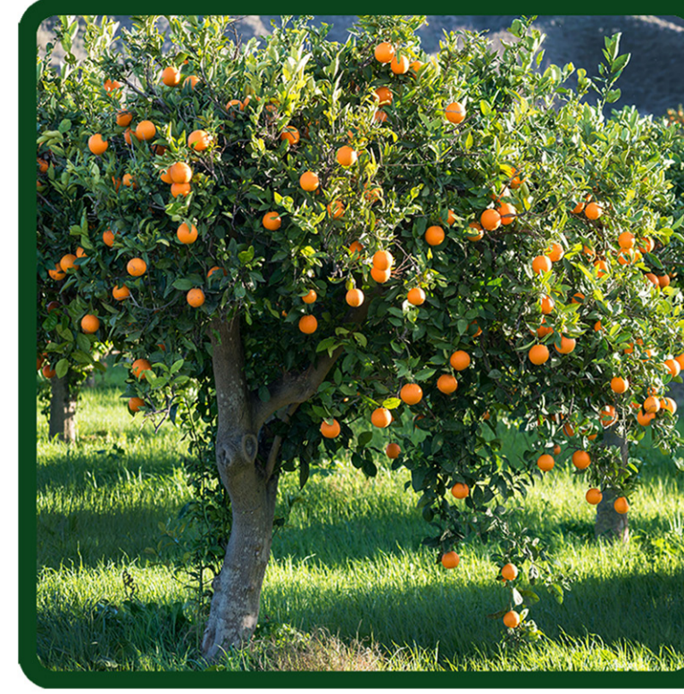
CITRUS X SINENSIS (ARANCIO)