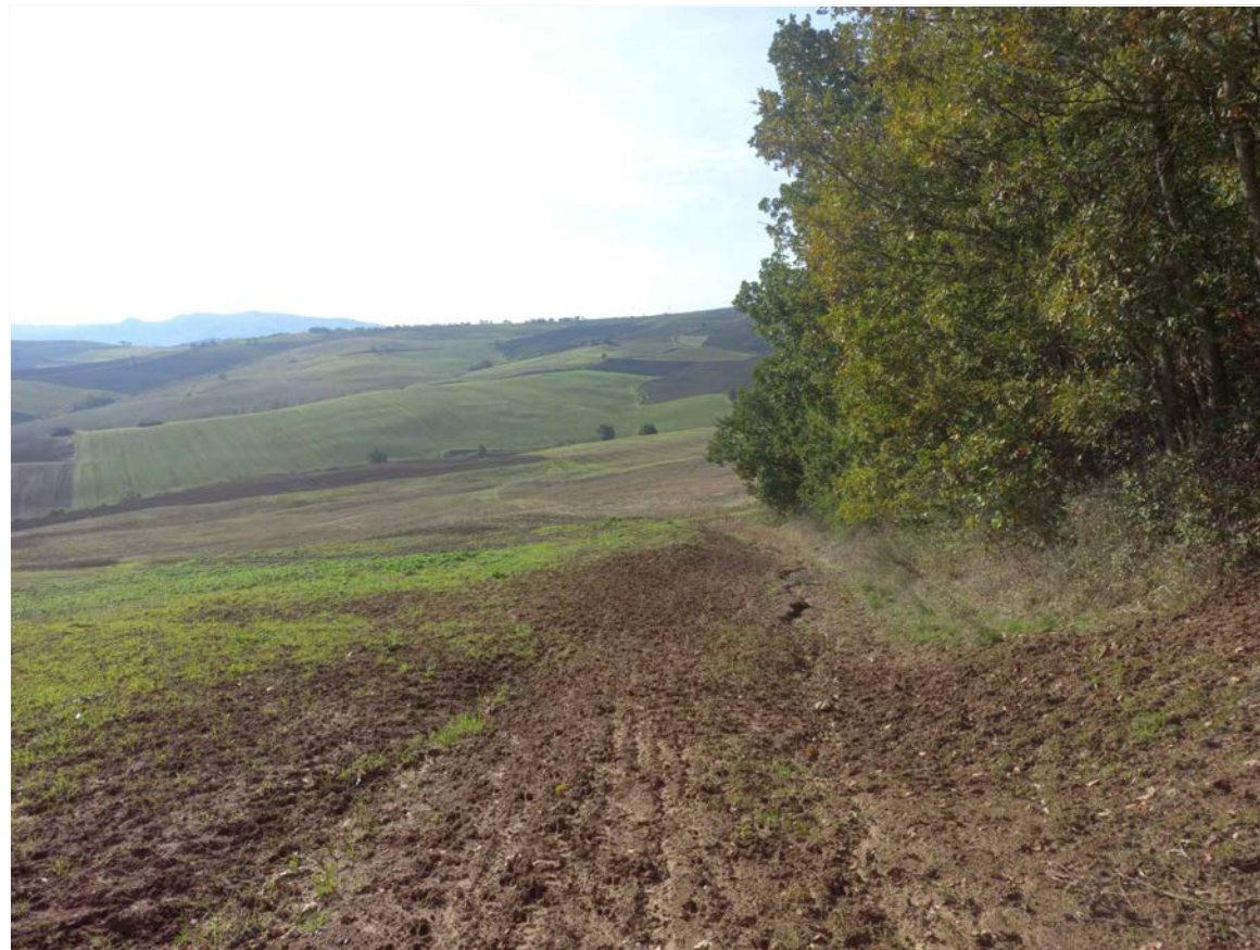
SCATTO FOTOGRAFICO 11