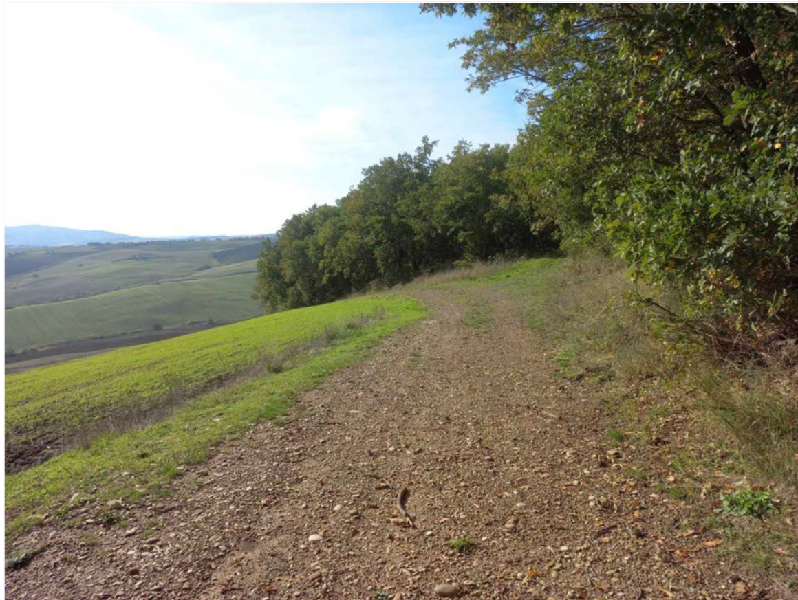
SCATTO FOTOGRAFICO 7