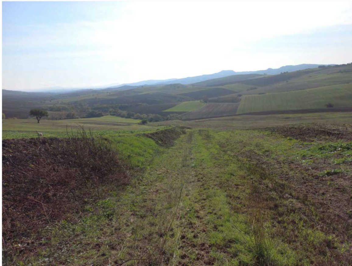
SCATTO FOTOGRAFICO 13