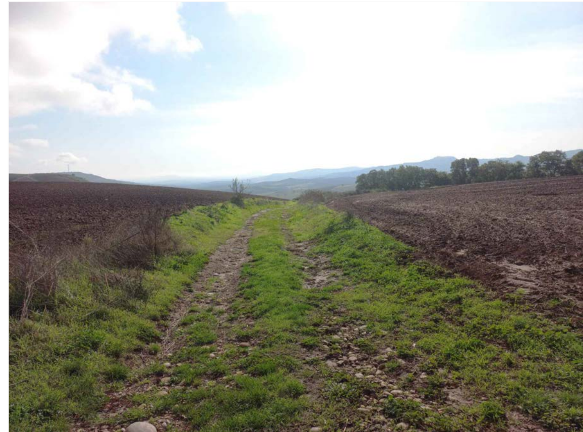
SCATTO FOTOGRAFICO 2