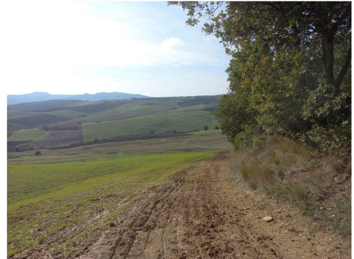
SCATTO FOTOGRAFICO 10