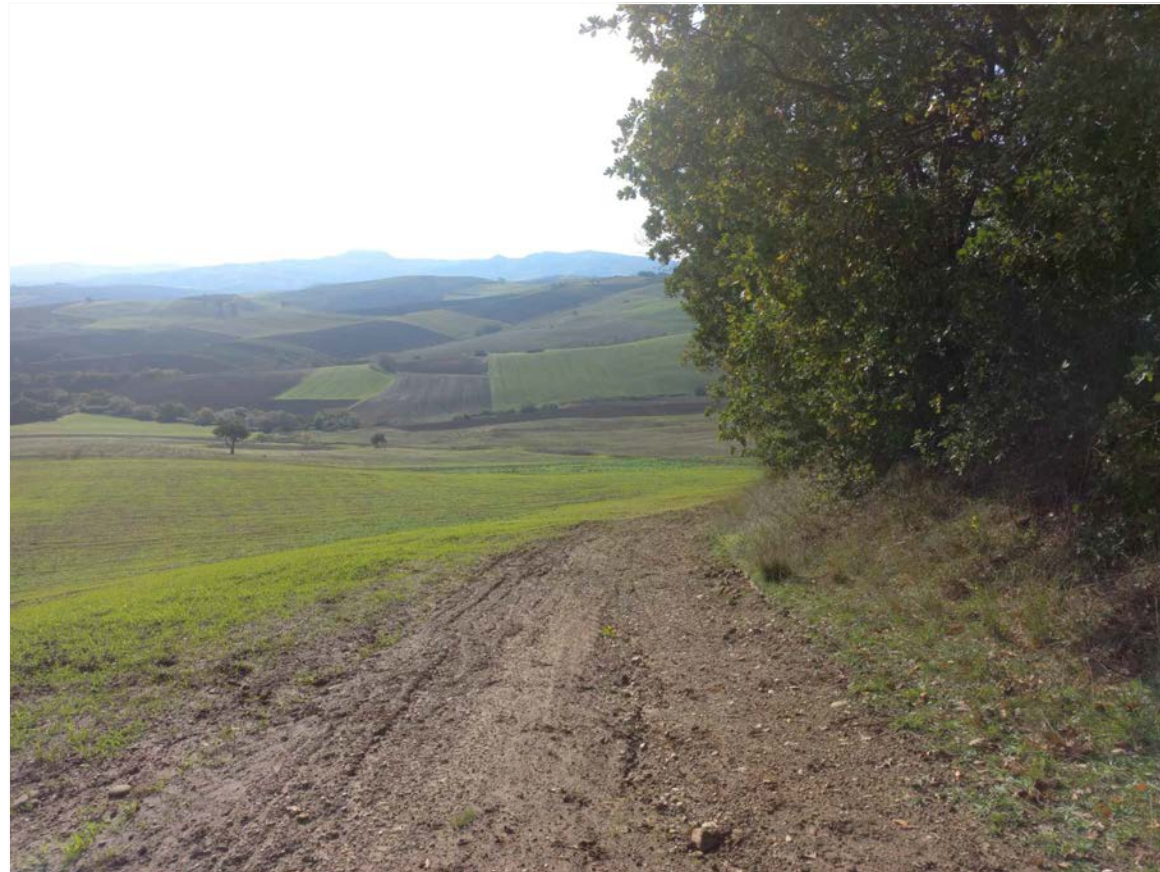
SCATTO FOTOGRAFICO 9