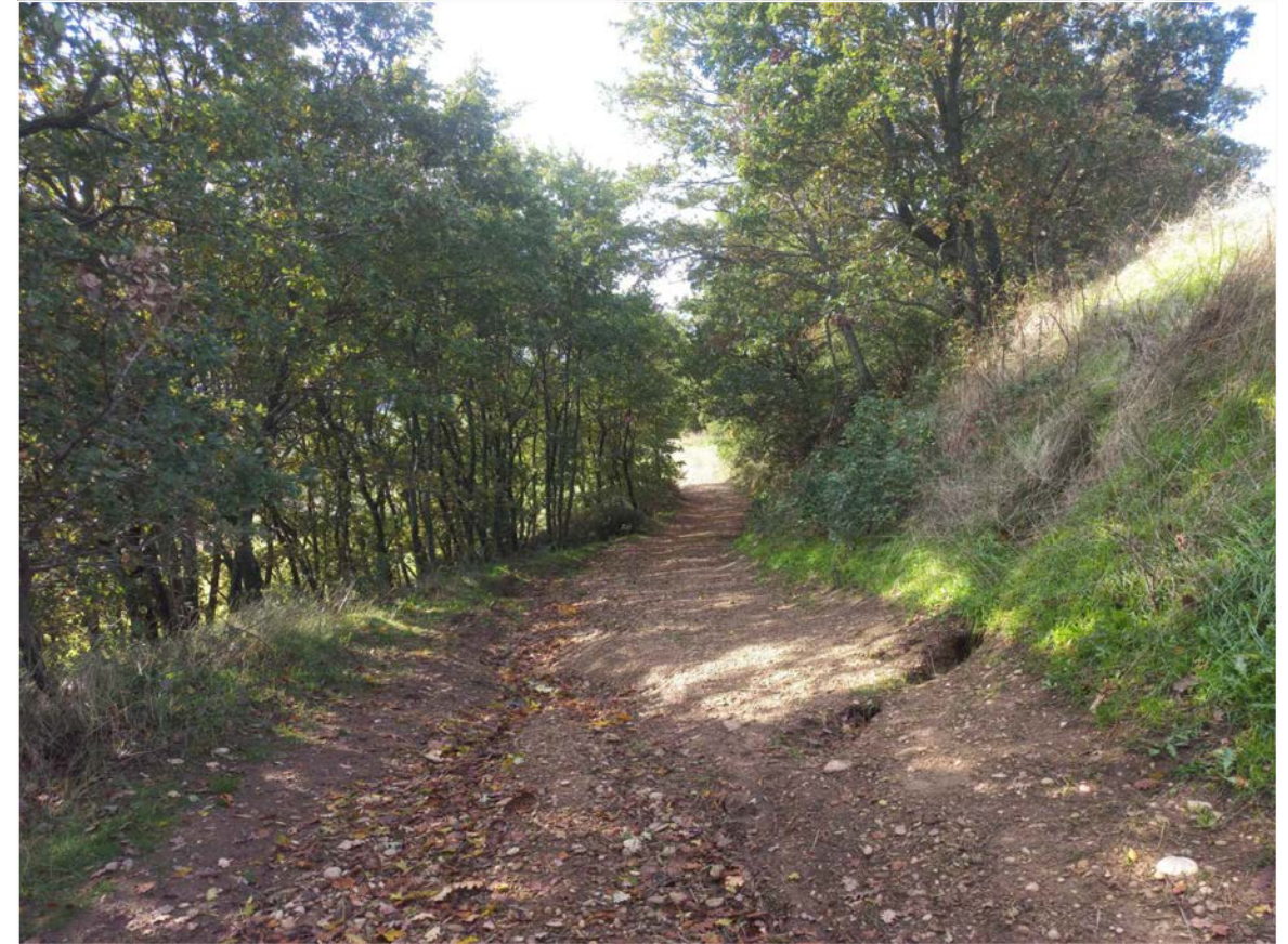
SCATTO FOTOGRAFICO 6