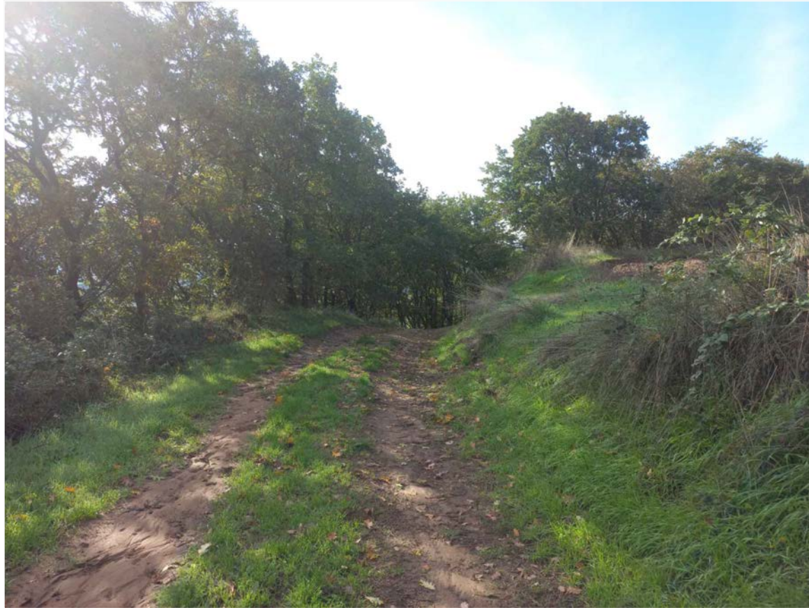
SCATTO FOTOGRAFICO 5