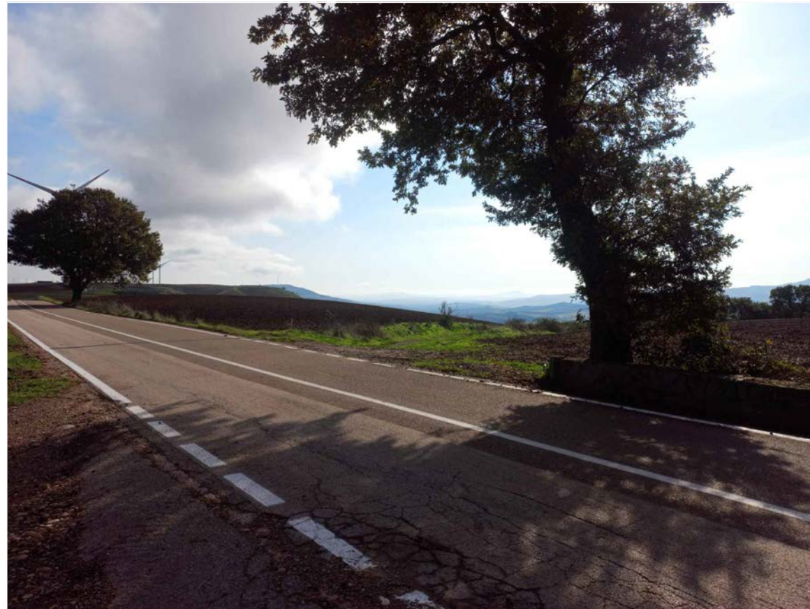
SCATTO FOTOGRAFICO 1