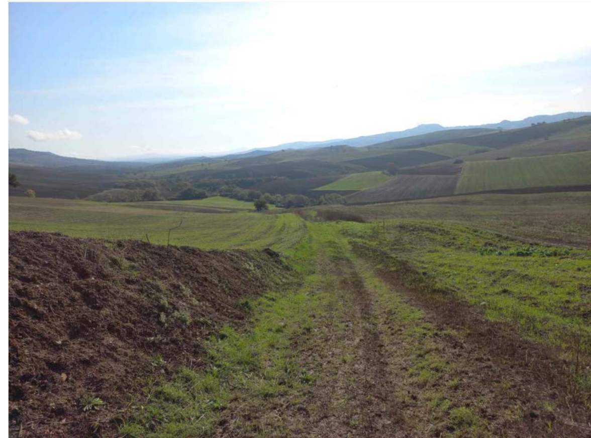
SCATTO FOTOGRAFICO 14