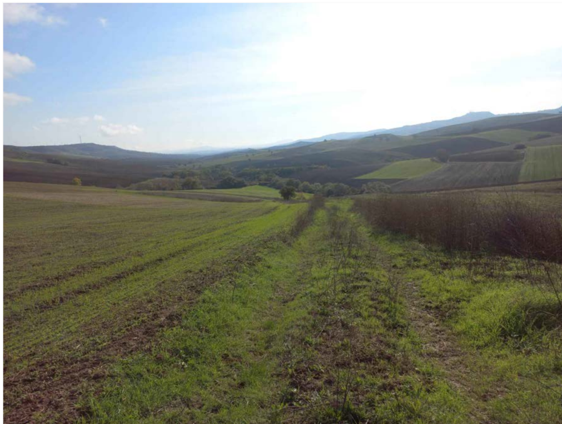
SCATTO FOTOGRAFICO 15