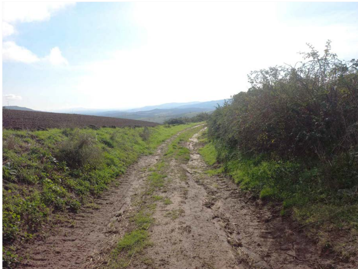
SCATTO FOTOGRAFICO 3