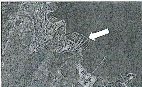
Immagine satellitare della Marina del Fezzano