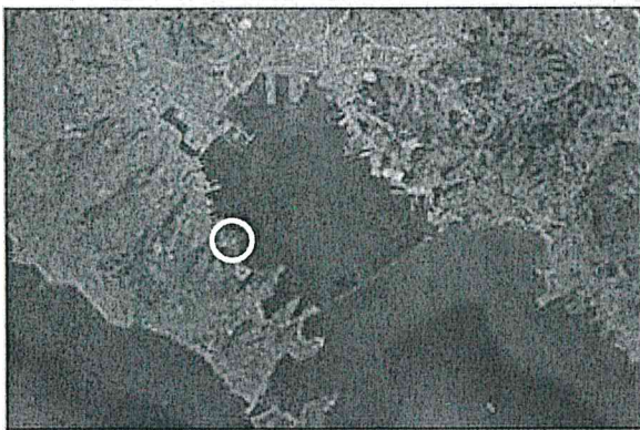
Immagine satellitare del golfo di La Spezia con individuazione della Marina del Fezzano