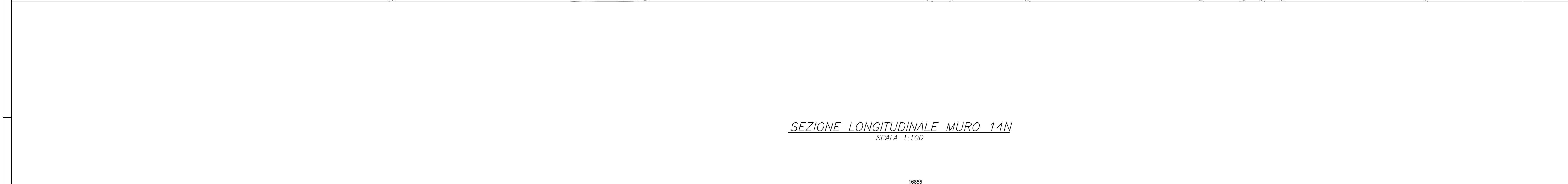
SEZIONE LONGITUDINALE MURO 14N SCALA 1:100