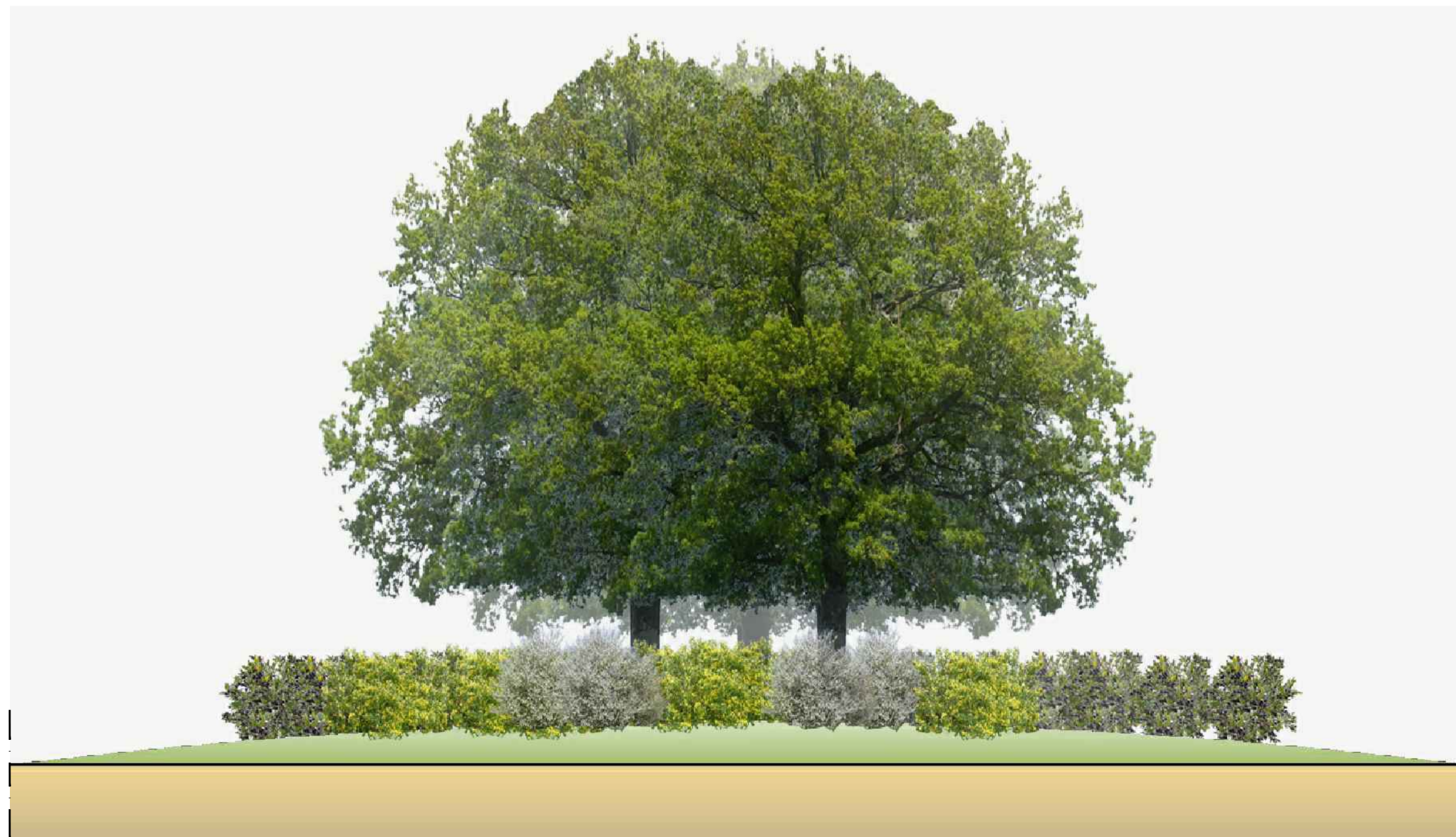
SEZIONE scala 1:100