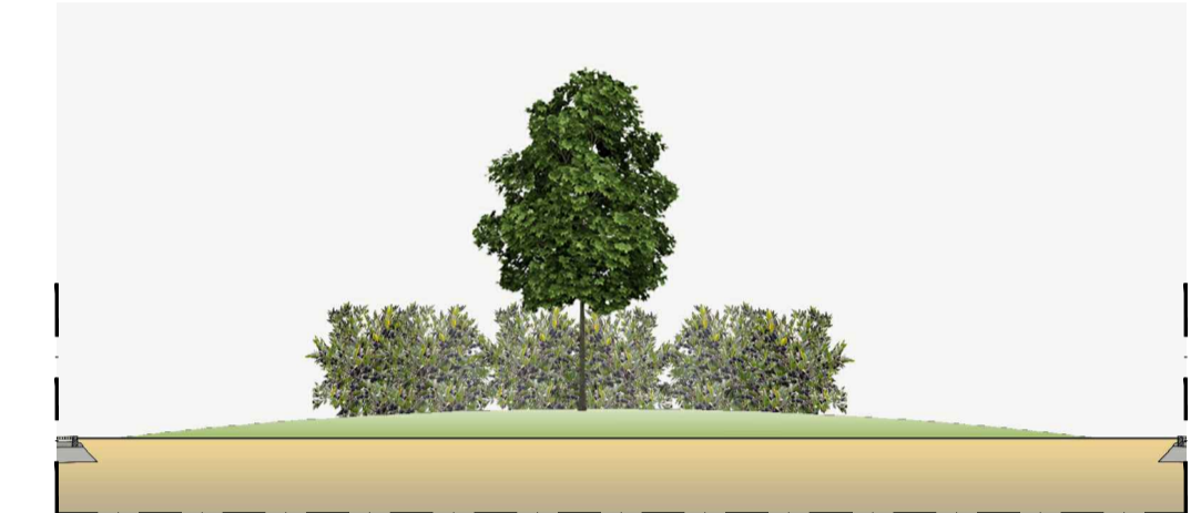
SEZIONE scala 1:100