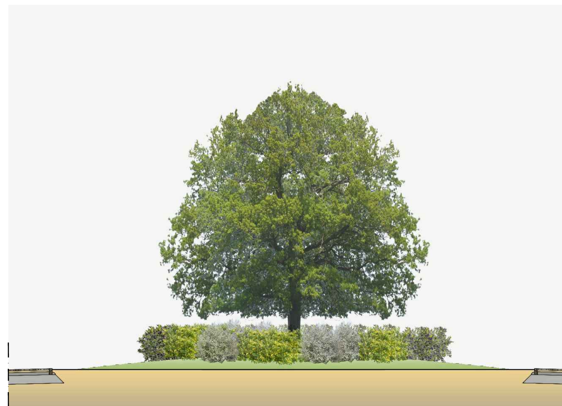
SEZIONE scala 1:100