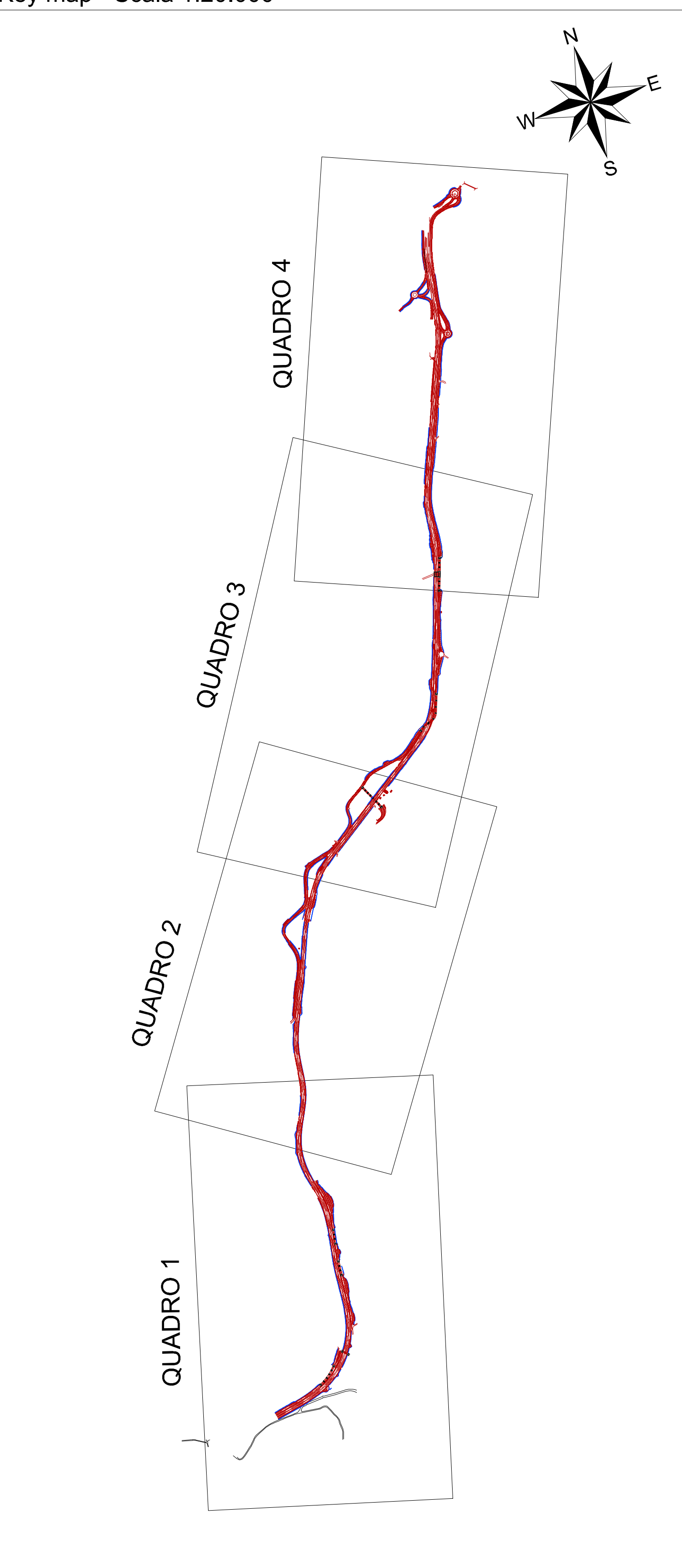
Key map - Scala 1:20.000