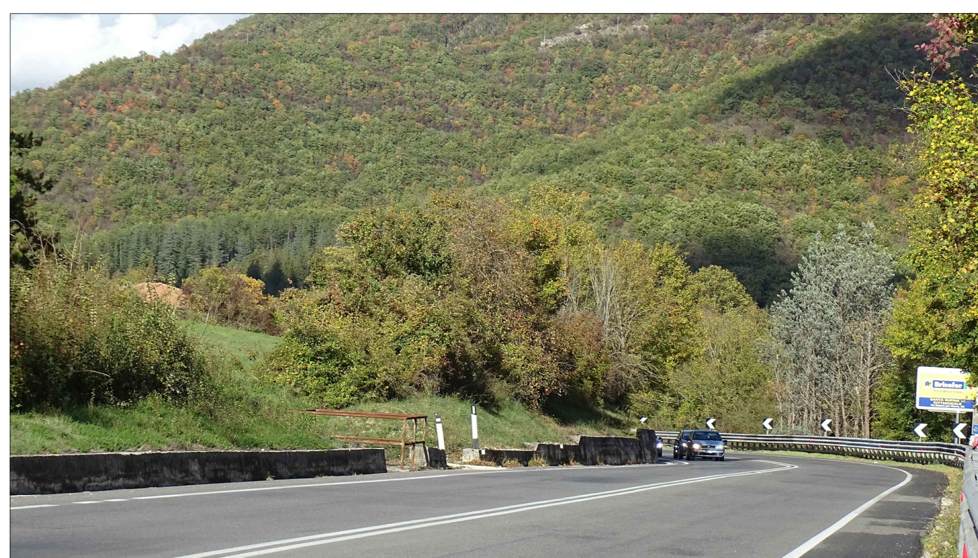
Vista F2b direzione nord: ANTE OPERAM