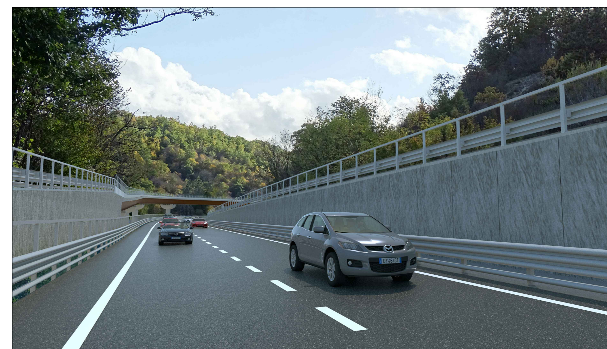
Vista F2a direzione sud: POST OPERAM - VIADOTTO V104