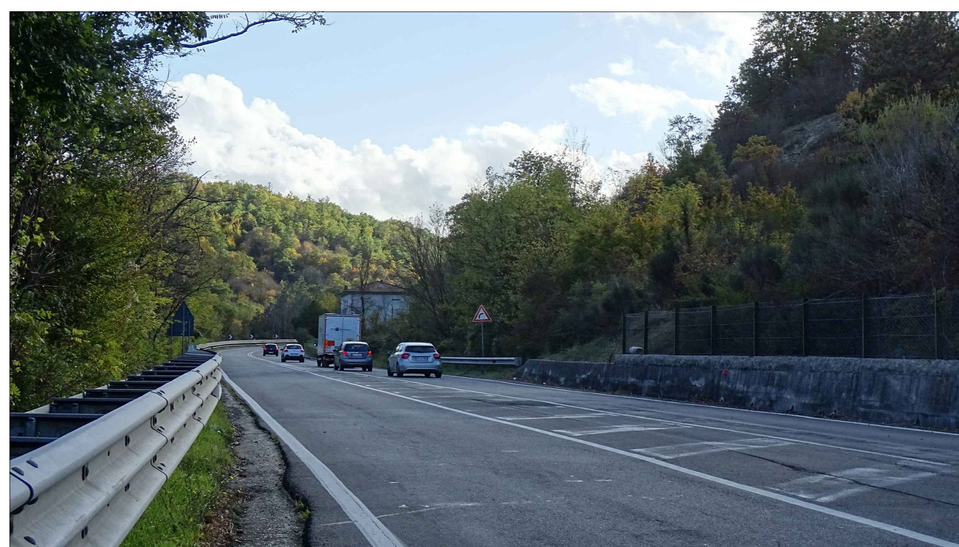
Vista F2a direzione sud: ANTE OPERAM