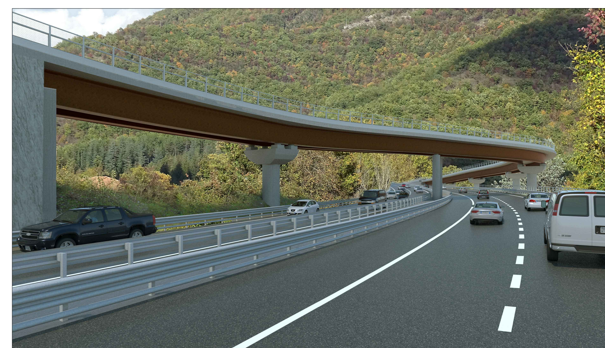
Vista F2b direzione nord: POST OPERAM - VIADOTTO V104