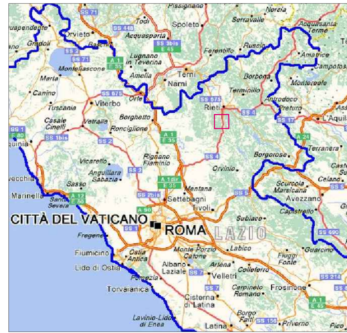
Localizzazione dell'area interventi su carta della Regione Lazio