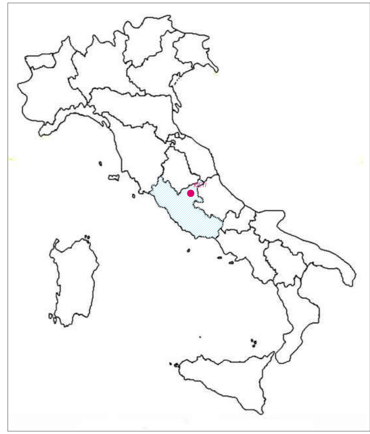
Localizzazione geografica degli interventi