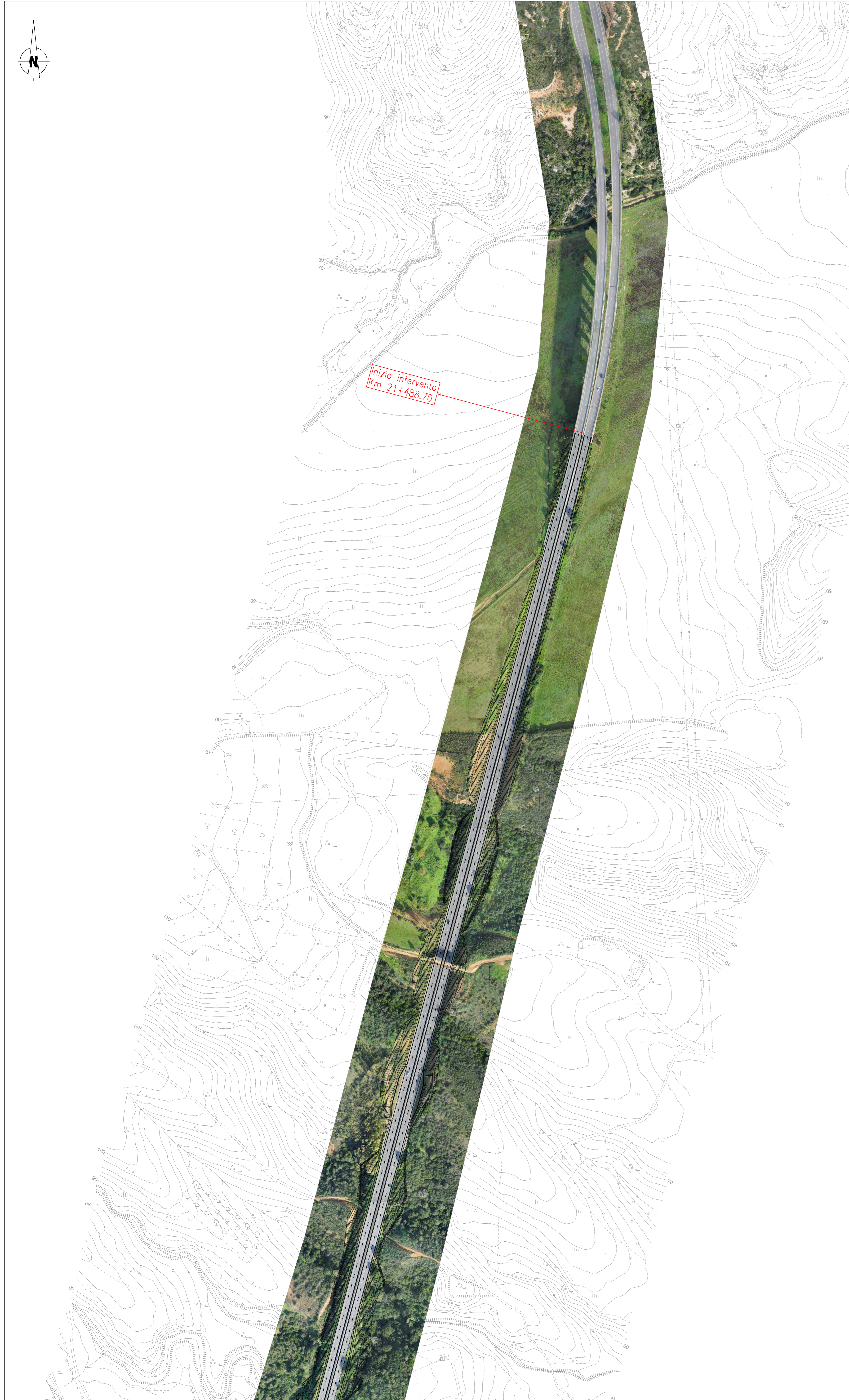
INQUADRAMENTO 1 (1:2000)