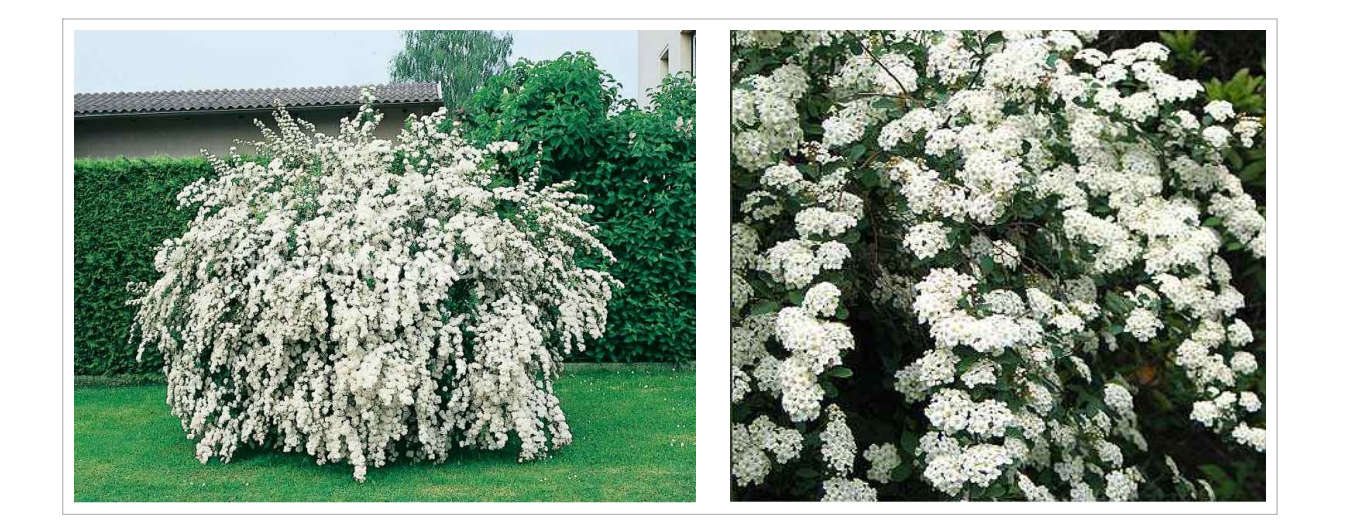
Spiraea x Vanhouttei