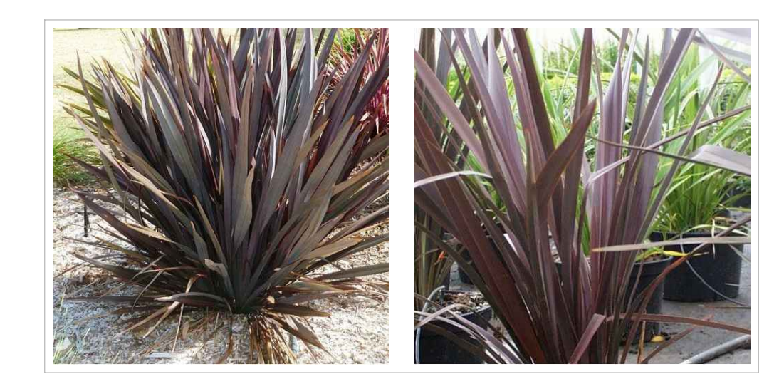
Phormium tenax "Purpureum"