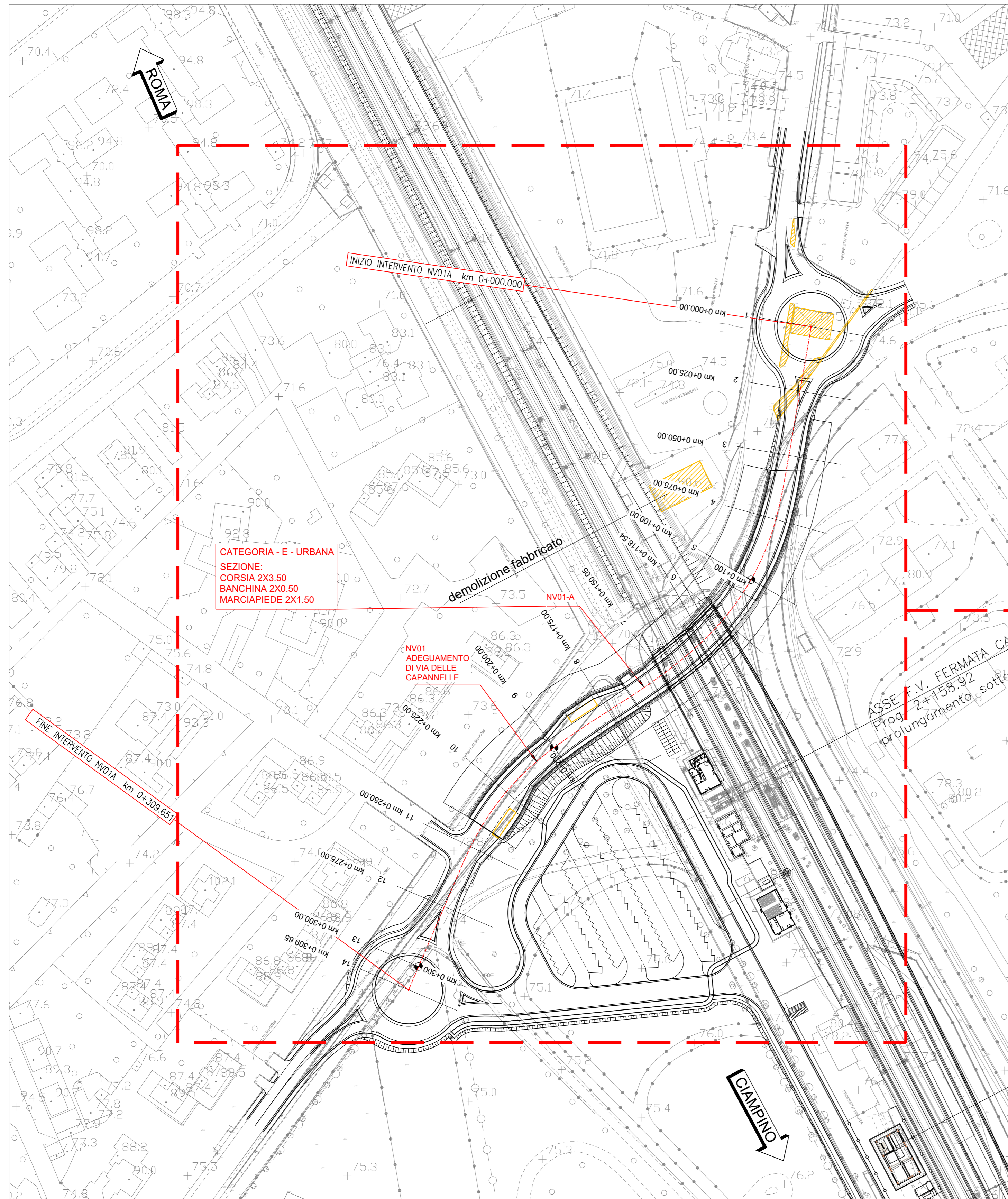
DATI DI TRACCIAMENTO