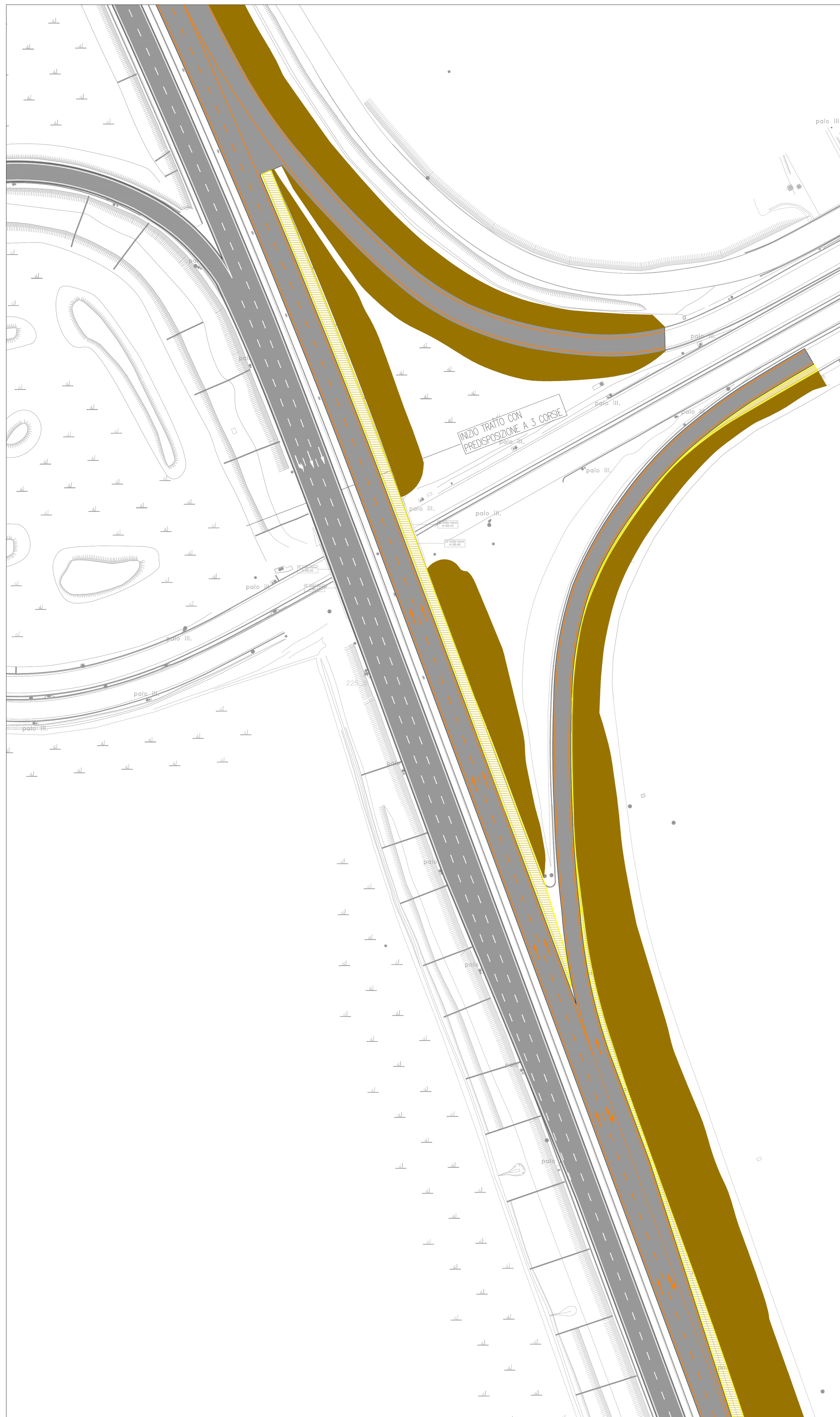
TRACCIAMENTO DEVIAZIONI - FASE 1a - QUADRO 1 SCALA 1:500