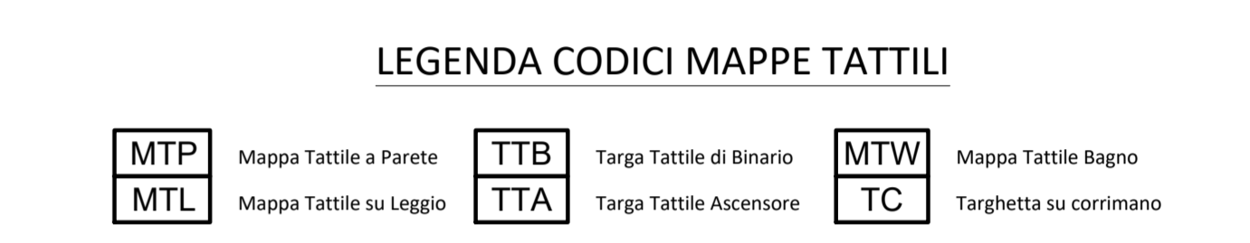
LEGENDA DEI PERCORSI TATTILI CON LINGUAGGIO LVE