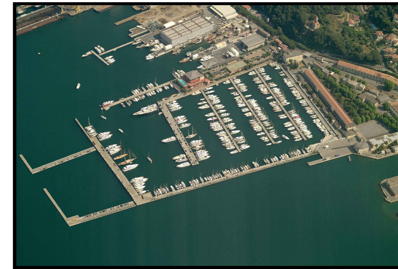
FOTOINSERIMENTO – PROGETTO APPROVATO