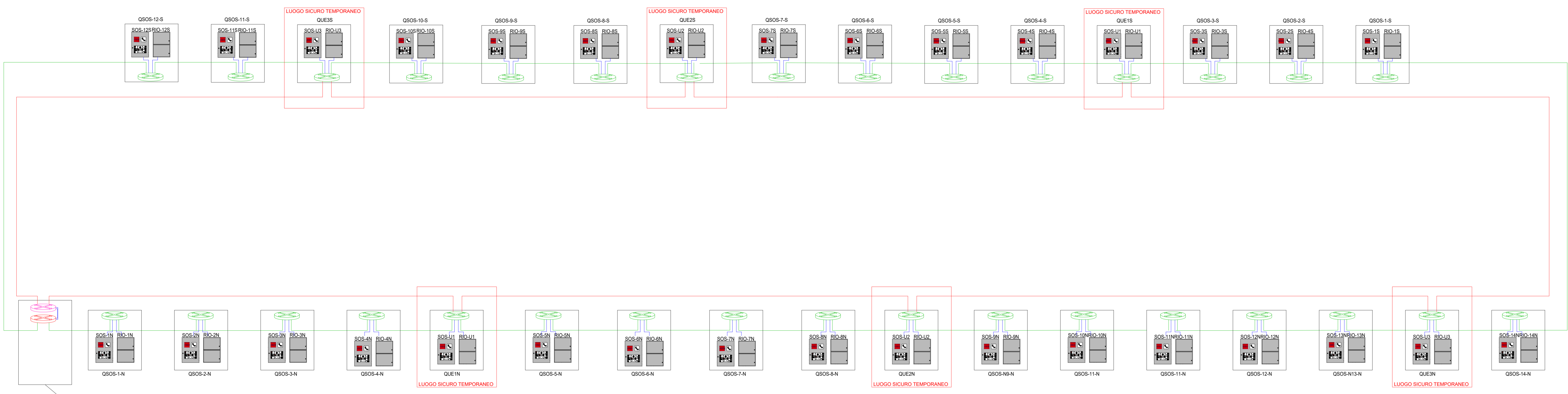
PARTICOLARE DEI COLLEGAMENTI SU ARMADIO RACK DI CABINA CE1