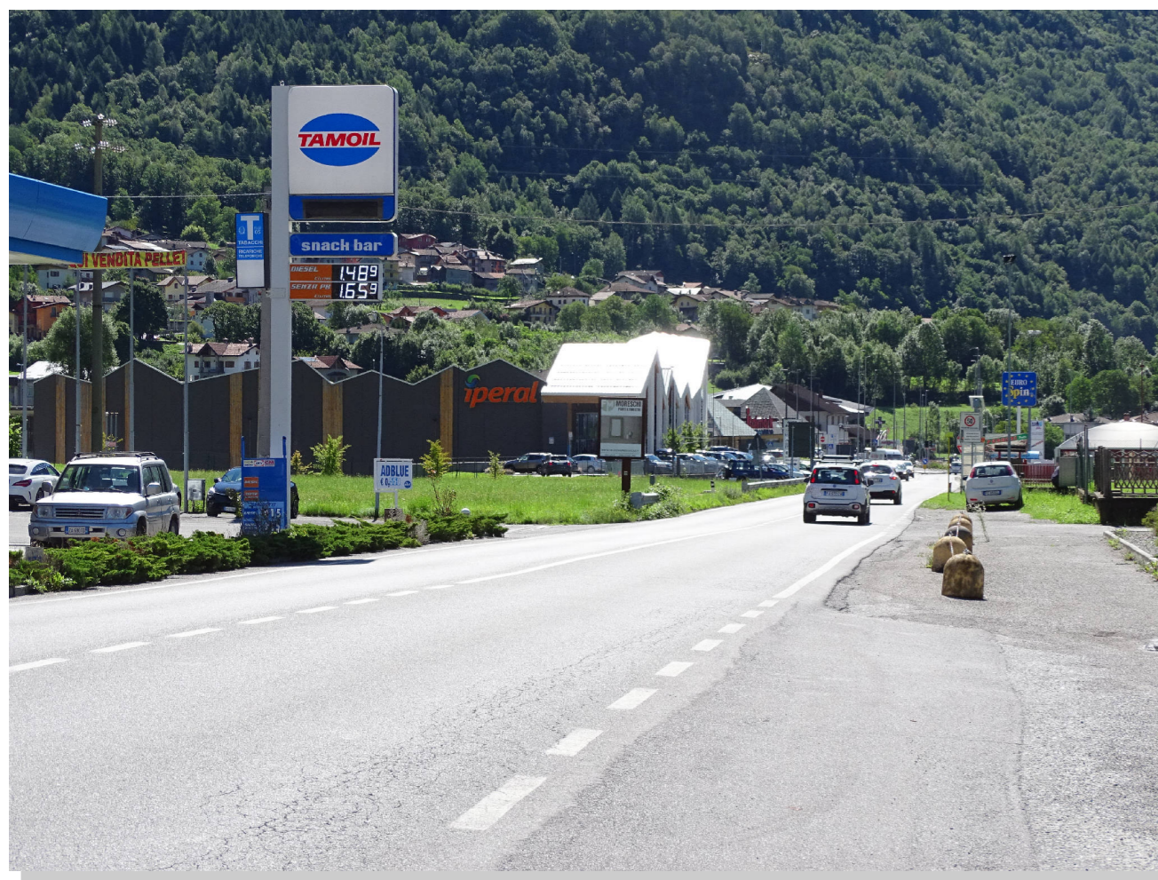
Stato di fatto