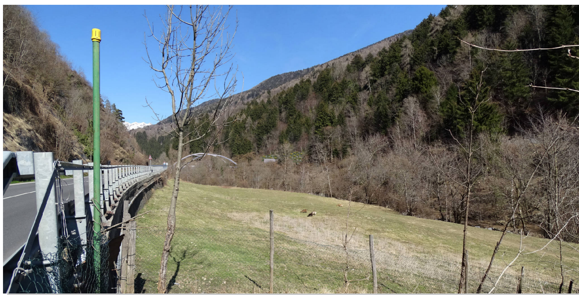
Stato di progetto con mitigazioni