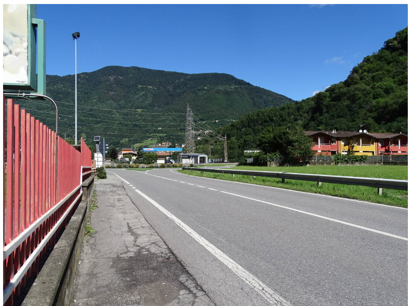
Stato di progetto con mitigazioni