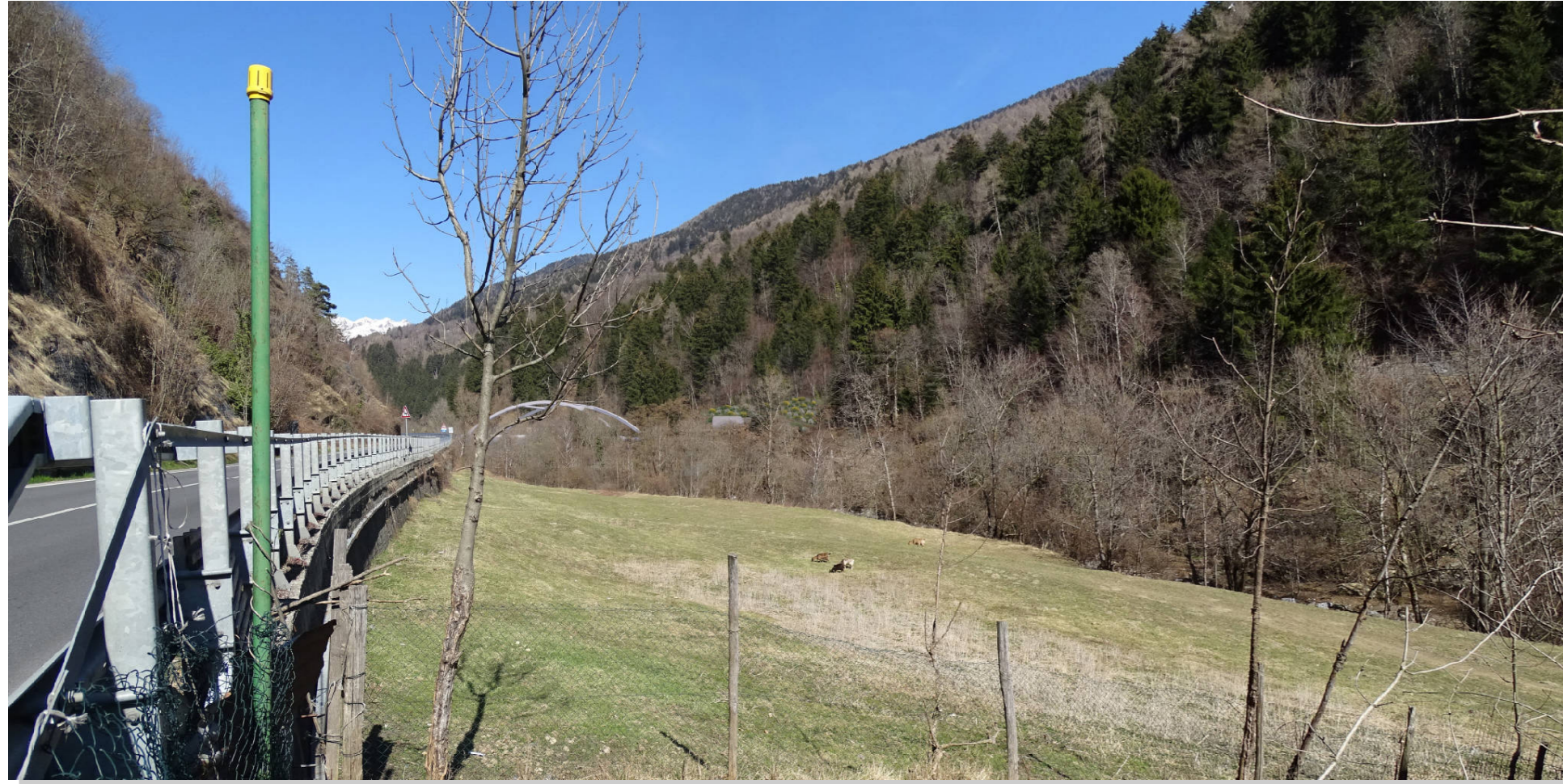
Stato di progetto con mitigazioni