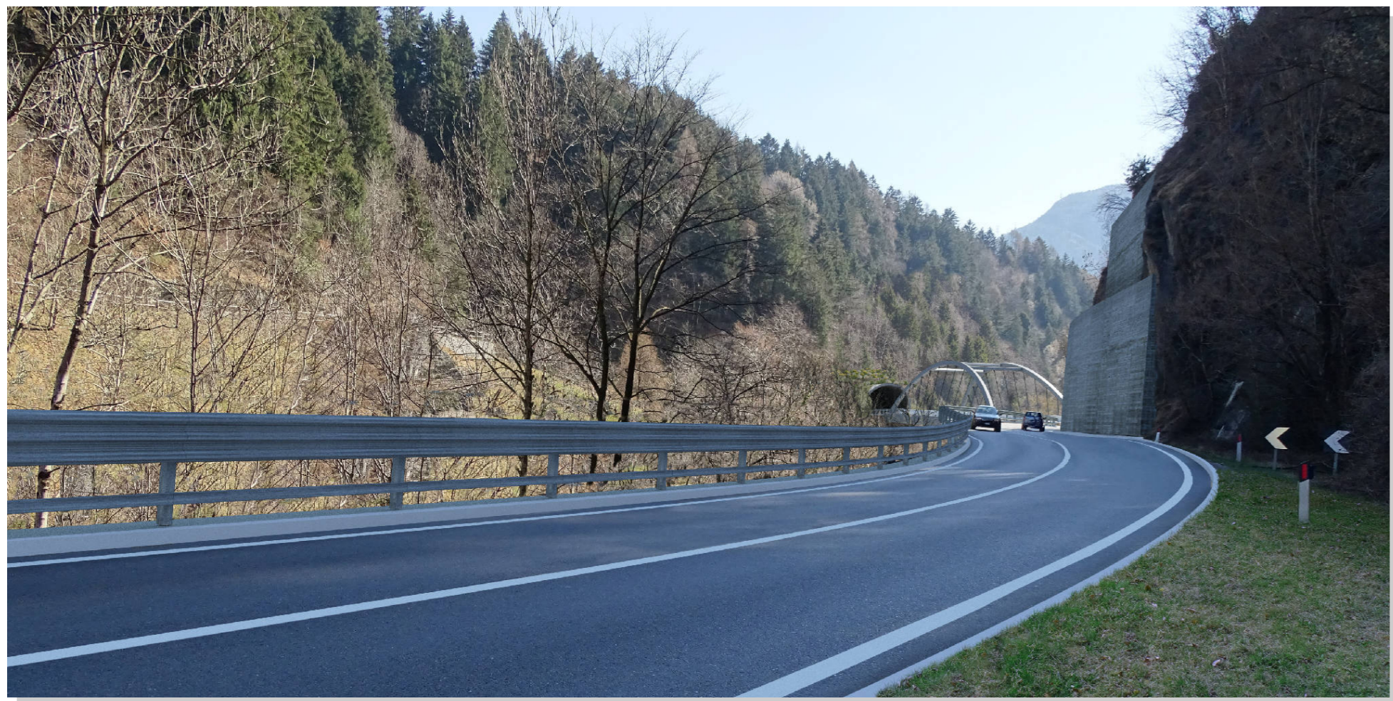
Stato di progetto con mitigazioni