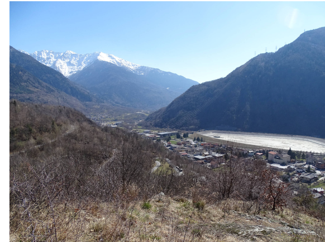
11 - Vista da Mù verso Edolo e il bacino artificiale della centrale idroelettrica