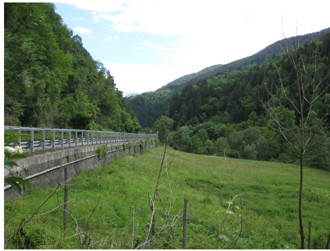
1 - S.S.42 fuori dall'abitato di Edolo verso il passo del Tonale