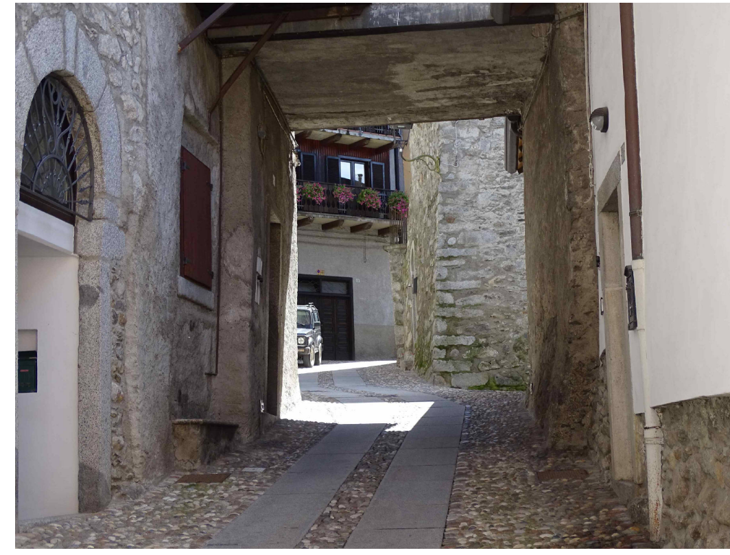
3 - Scorcio di una via interna del centro storico di Edolo