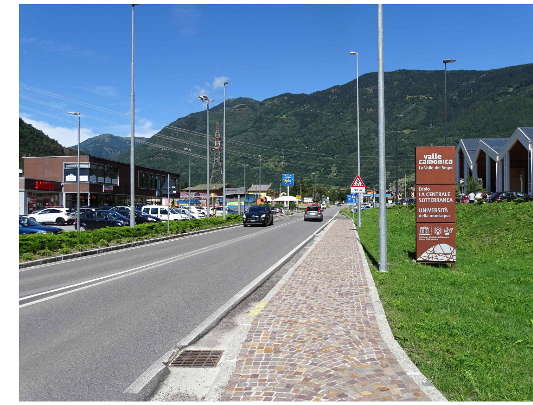
4 - Area commerciale lungo la SS42 nel comune di Sonico