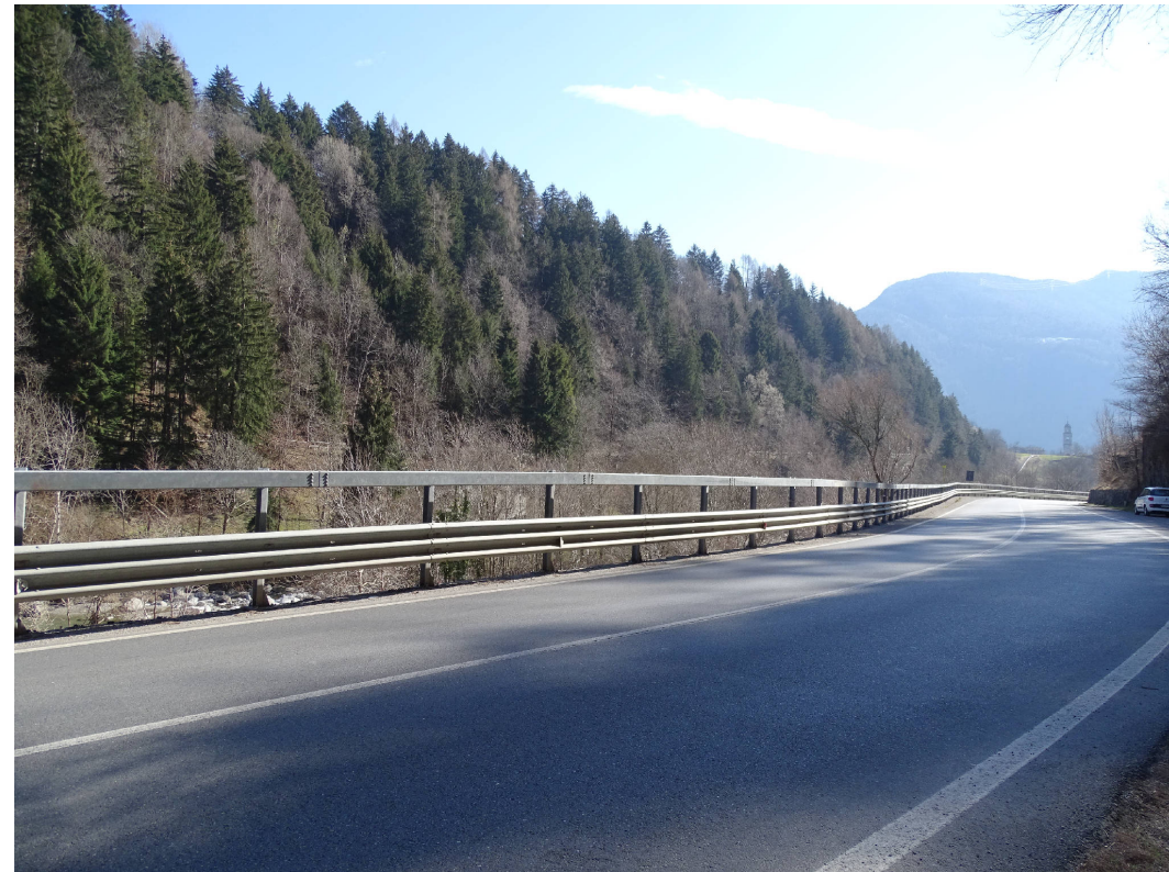
9 - S.S.42 e boschi sul versante in sponda sinistra del fiume Oglio