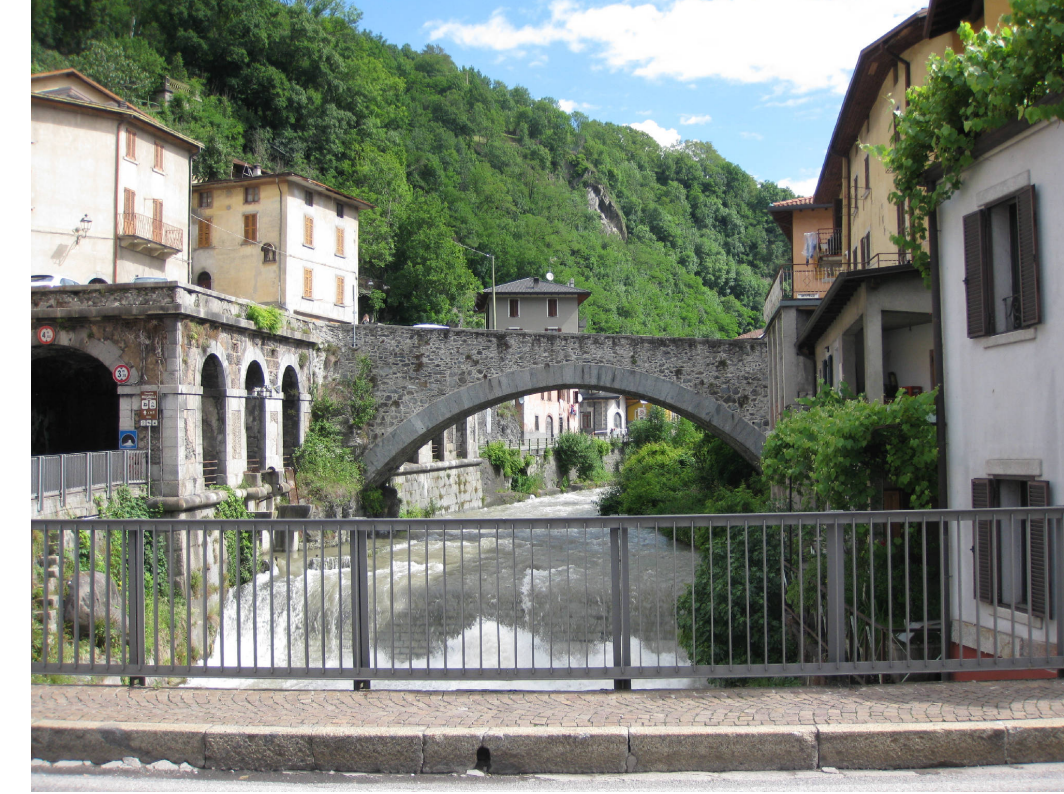
7 - Ponte Alto ad Edolo