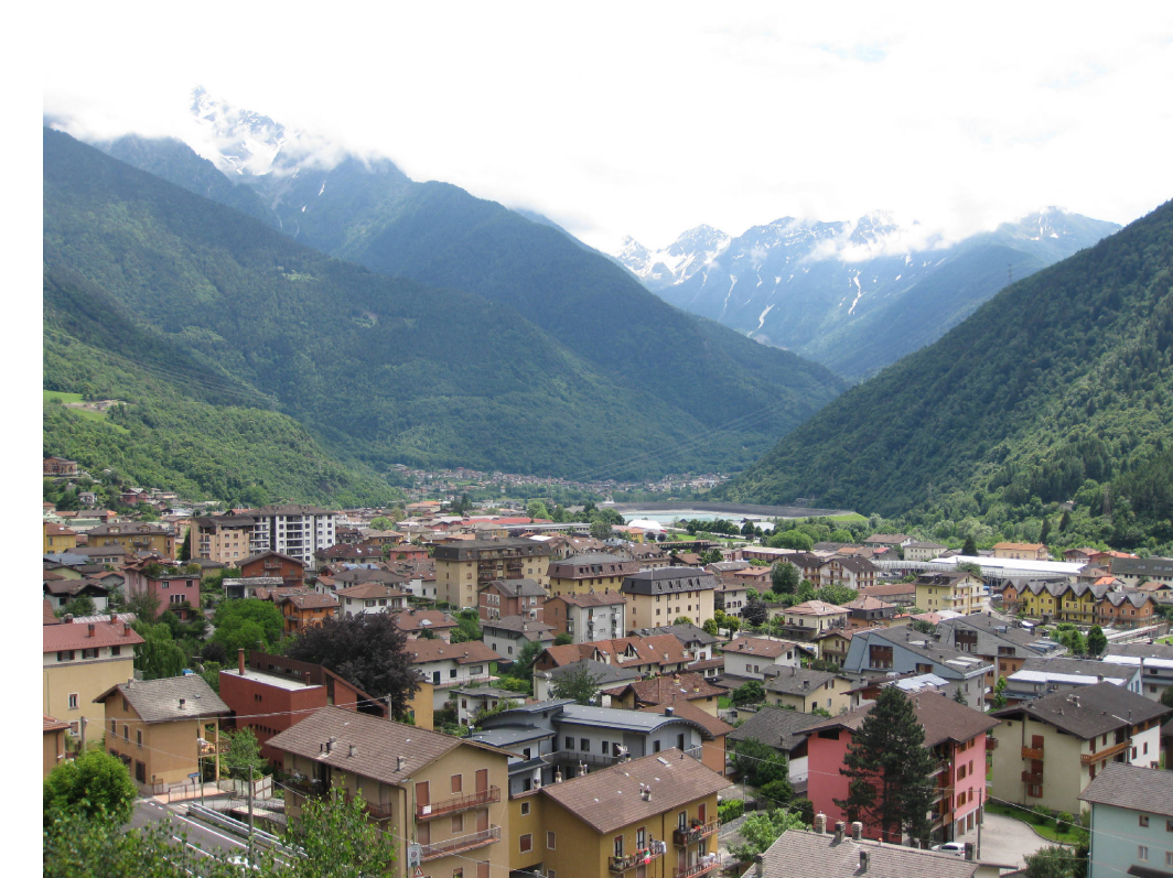
20 - Abitato di Edolo dal versante Nord