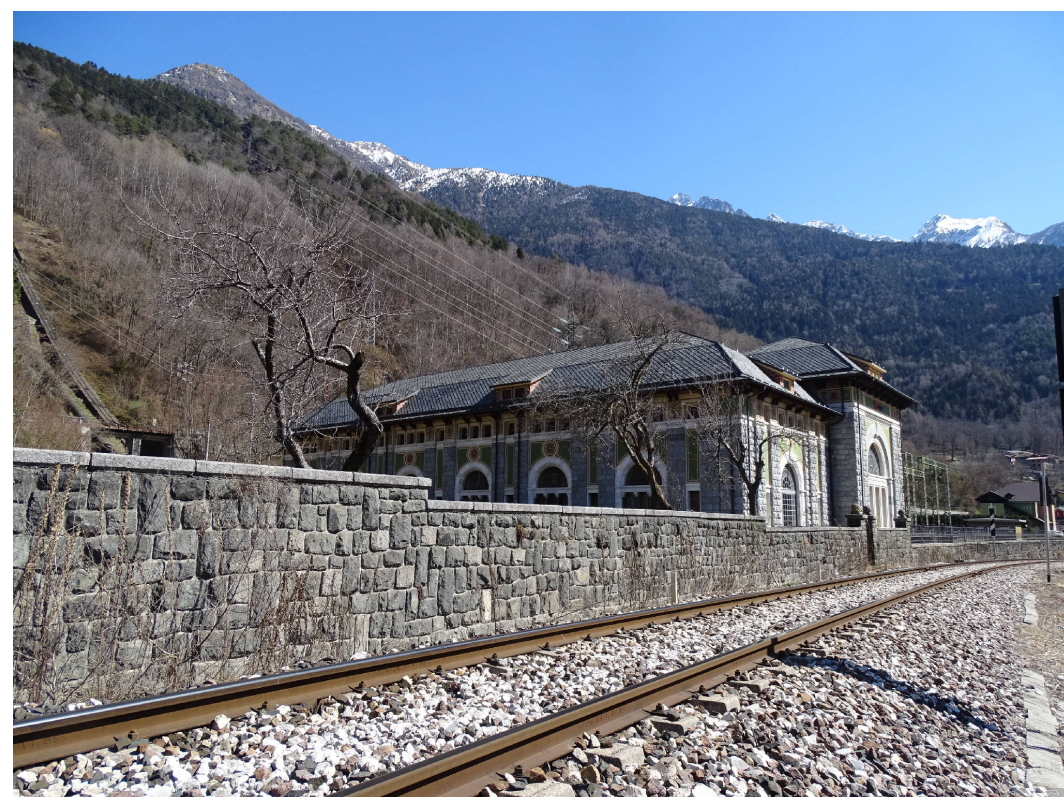
17 - Centrale idroelettrica Edison e ferrovia storica a Sonico