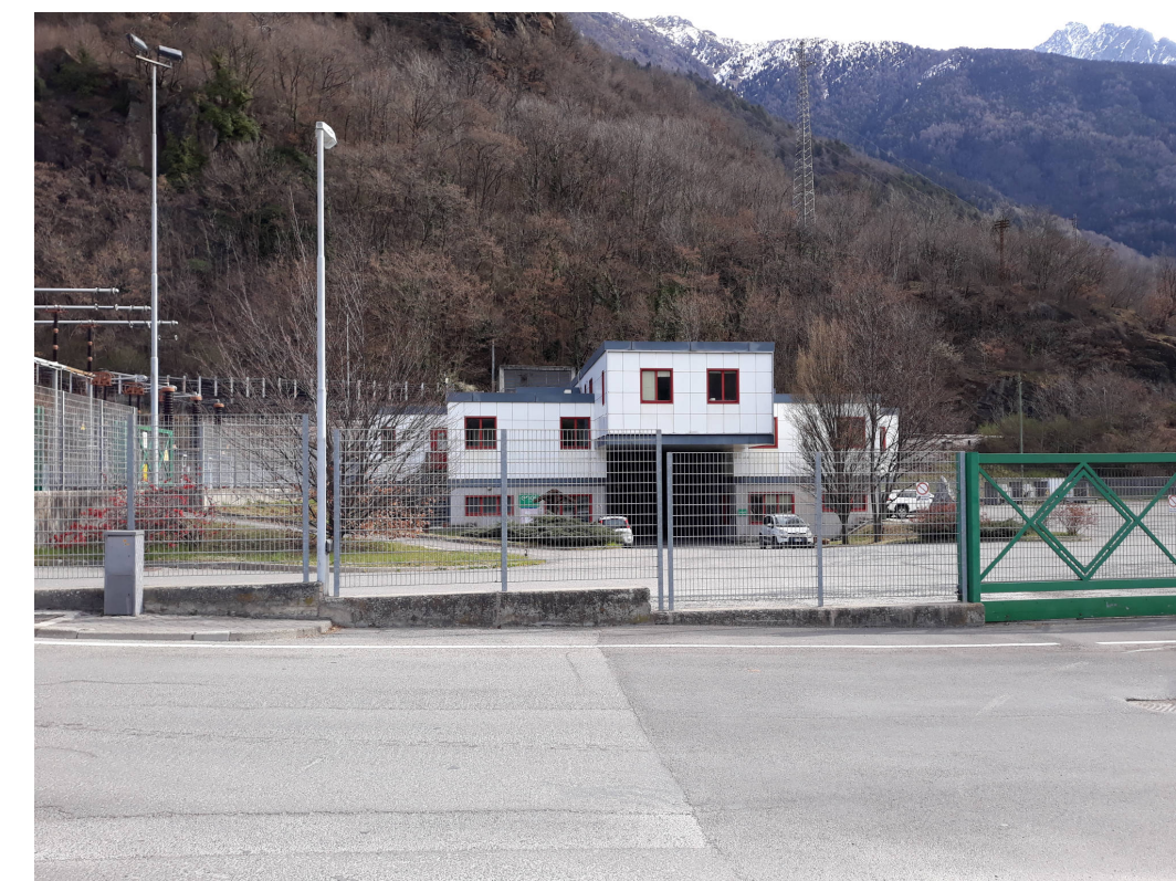
19 - Centrale idroelettrica Enel Green Power a Edolo