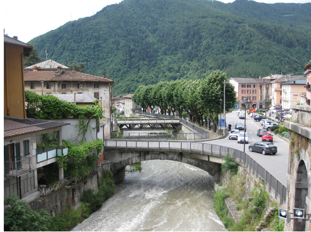
5 - Ponte della SS42 sul fiume Oglio nel centro abitato di Edolo