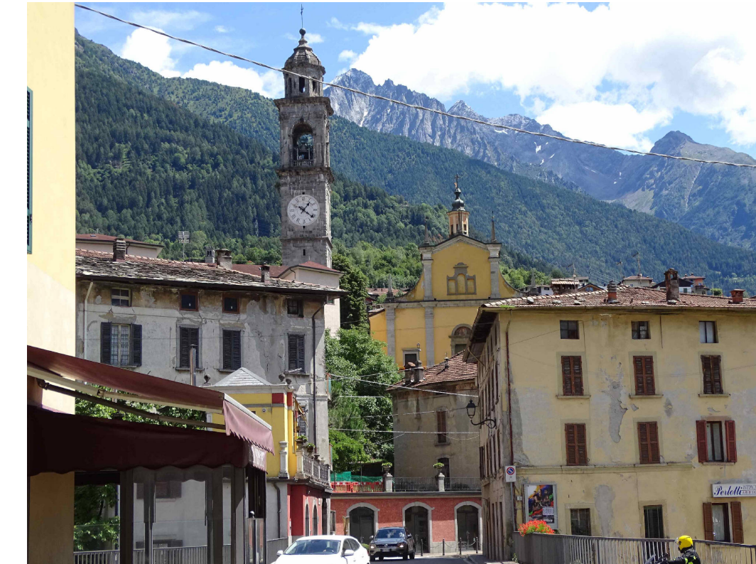
12 - Centro abitato di Edolo