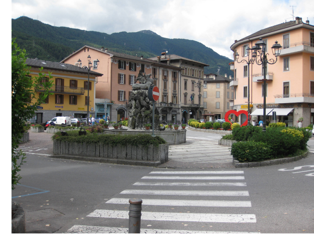
8 - Piazza Martiri della Libertà a Edolo (incrocio SS39 e SS42)