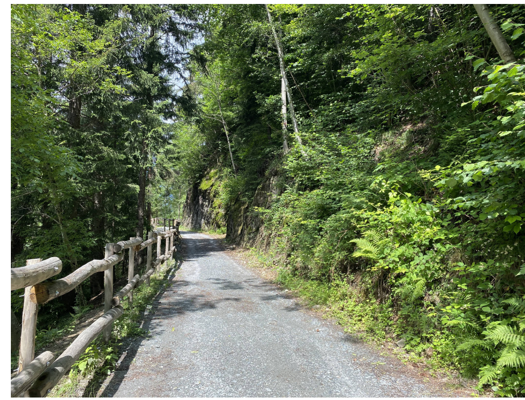
2 - Sentiero presso la sponda sinistra del fiume Oglio