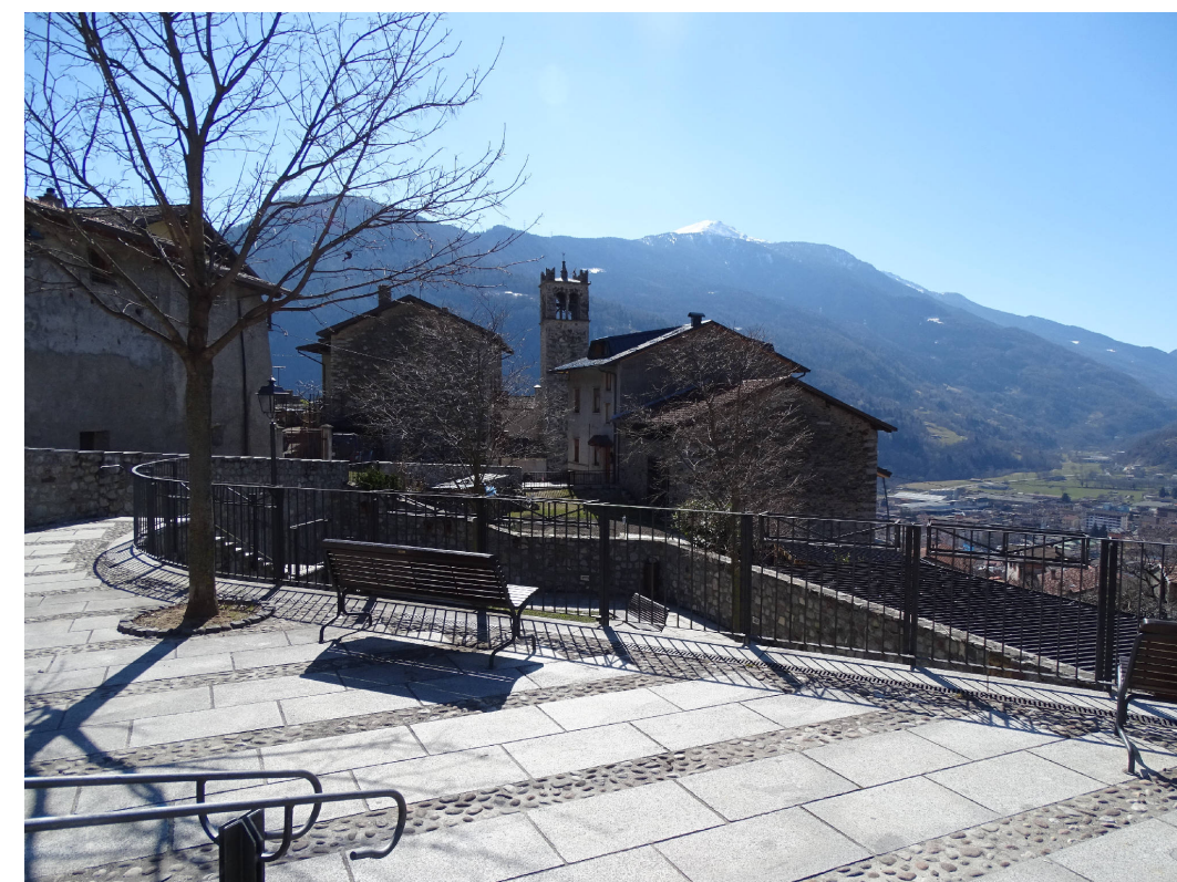
18 - Piazza centrale di Mù