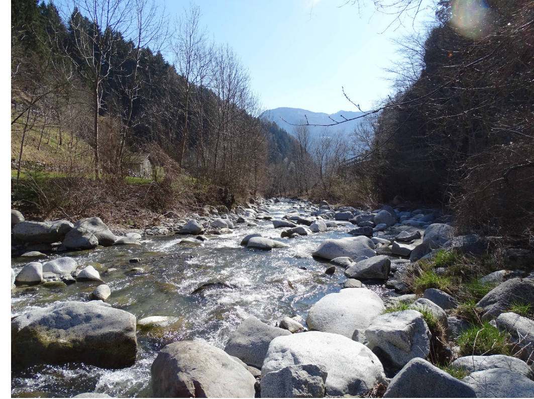
6 - Alveo del fiume Oglio a Nord dell'abitato di Edolo