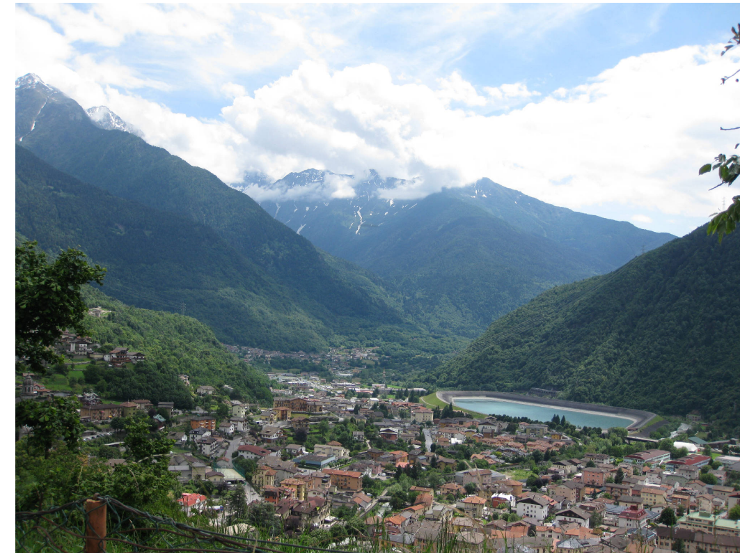
10 - Vista dell'abitato di Edolo con bacino artificiale