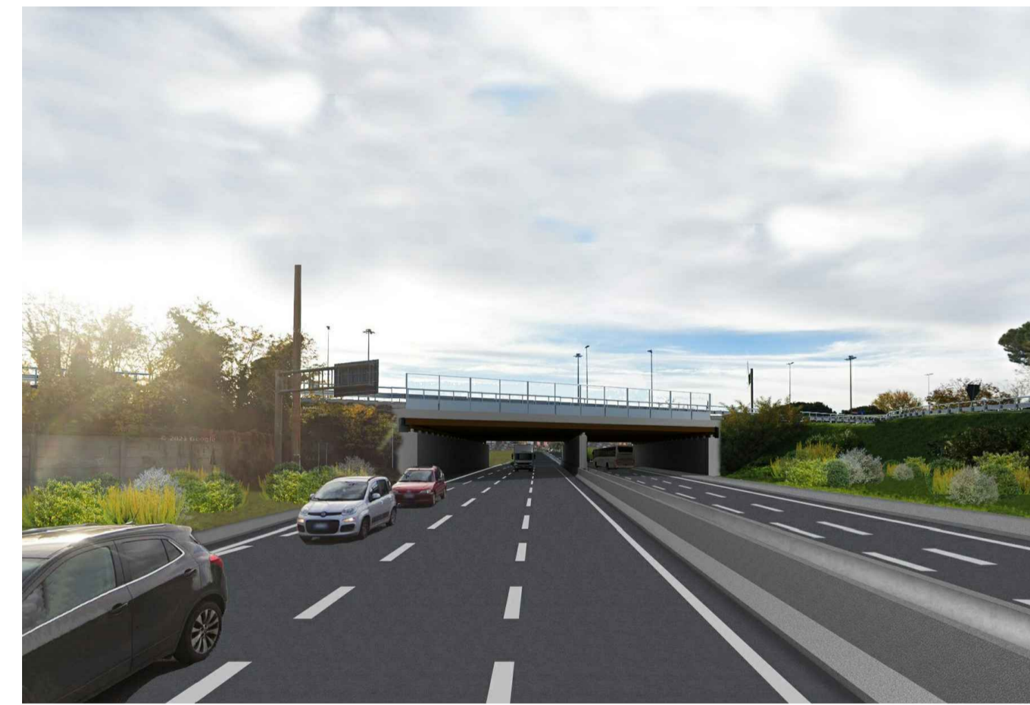
STATO POST OPERAM CON MITIGAZIONE