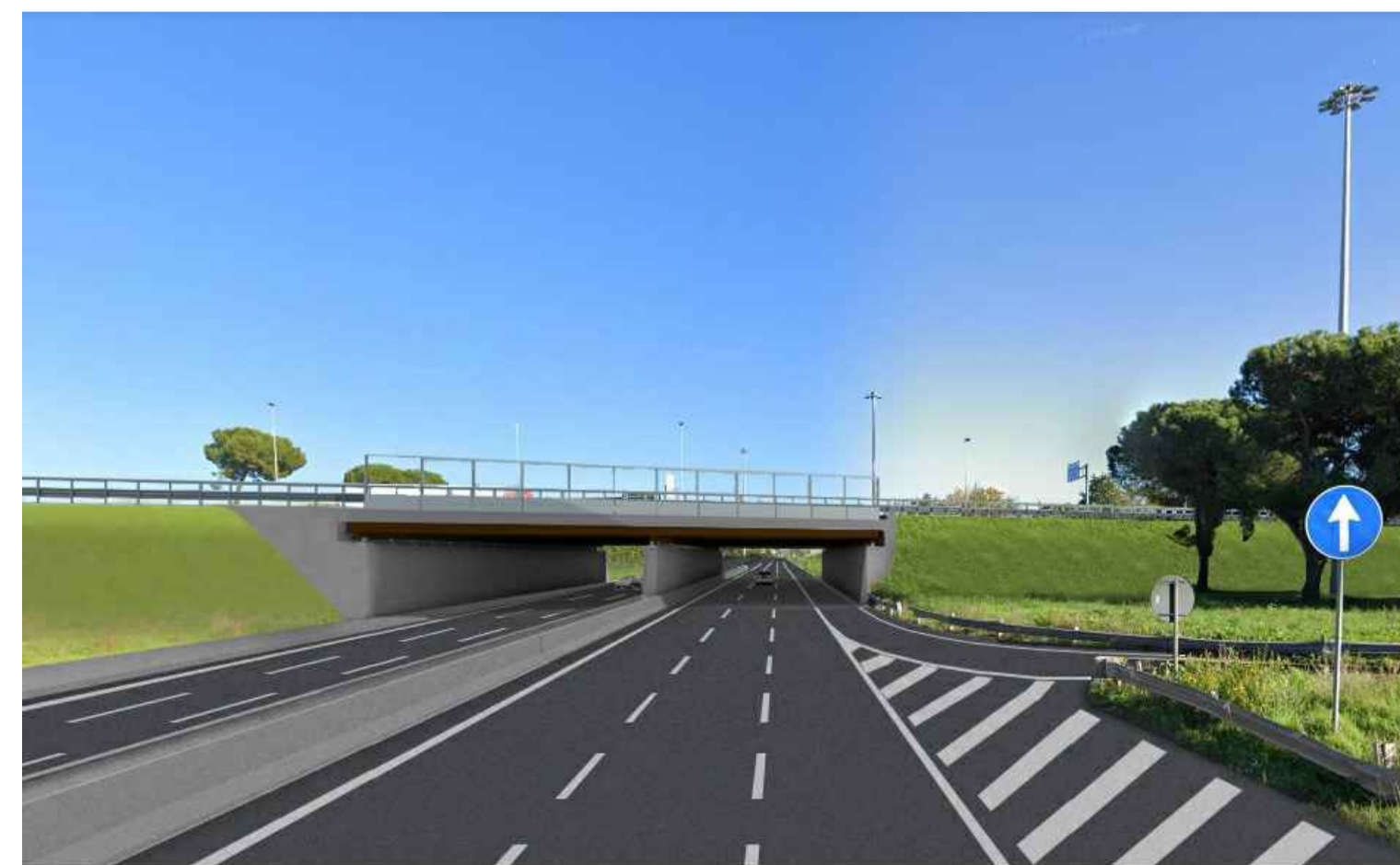
STATO POST OPERAM