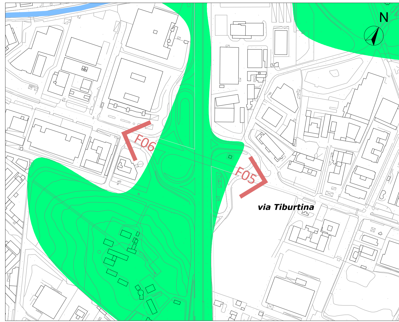
PLANIMETRIA CON CONI OTTICI