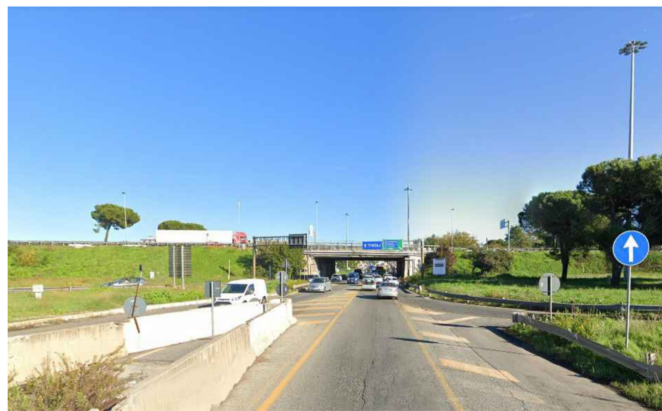
STATO ANTE OPERAM