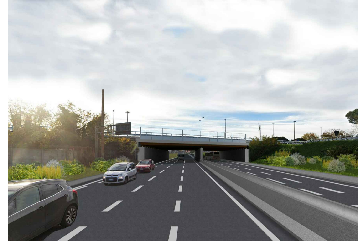
STATO POST OPERAM CON MITIGAZIONE