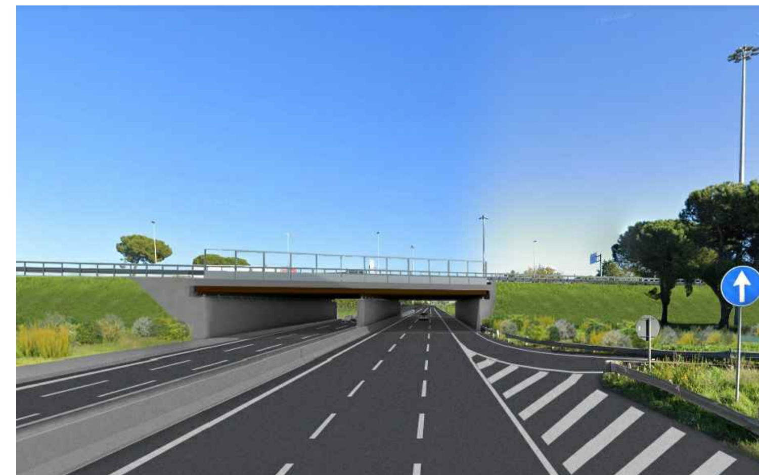
STATO POST OPERAM CON MITIGAZIONE