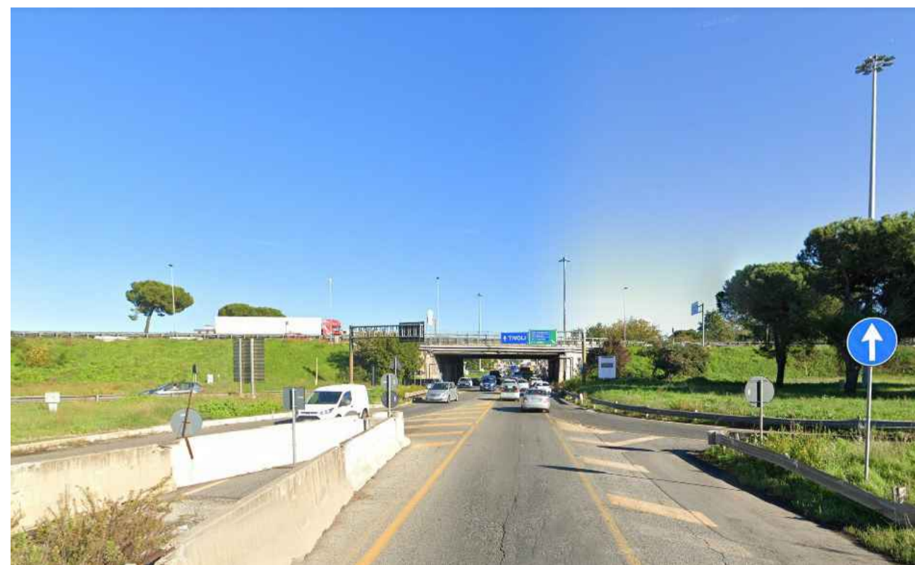
STATO ANTE OPERAM PUNTO DI VISTA F06