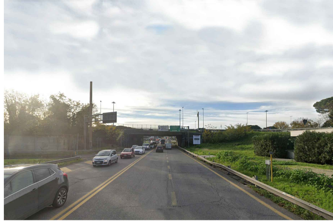
STATO ANTE OPERAM PUNTO DI VISTA F05