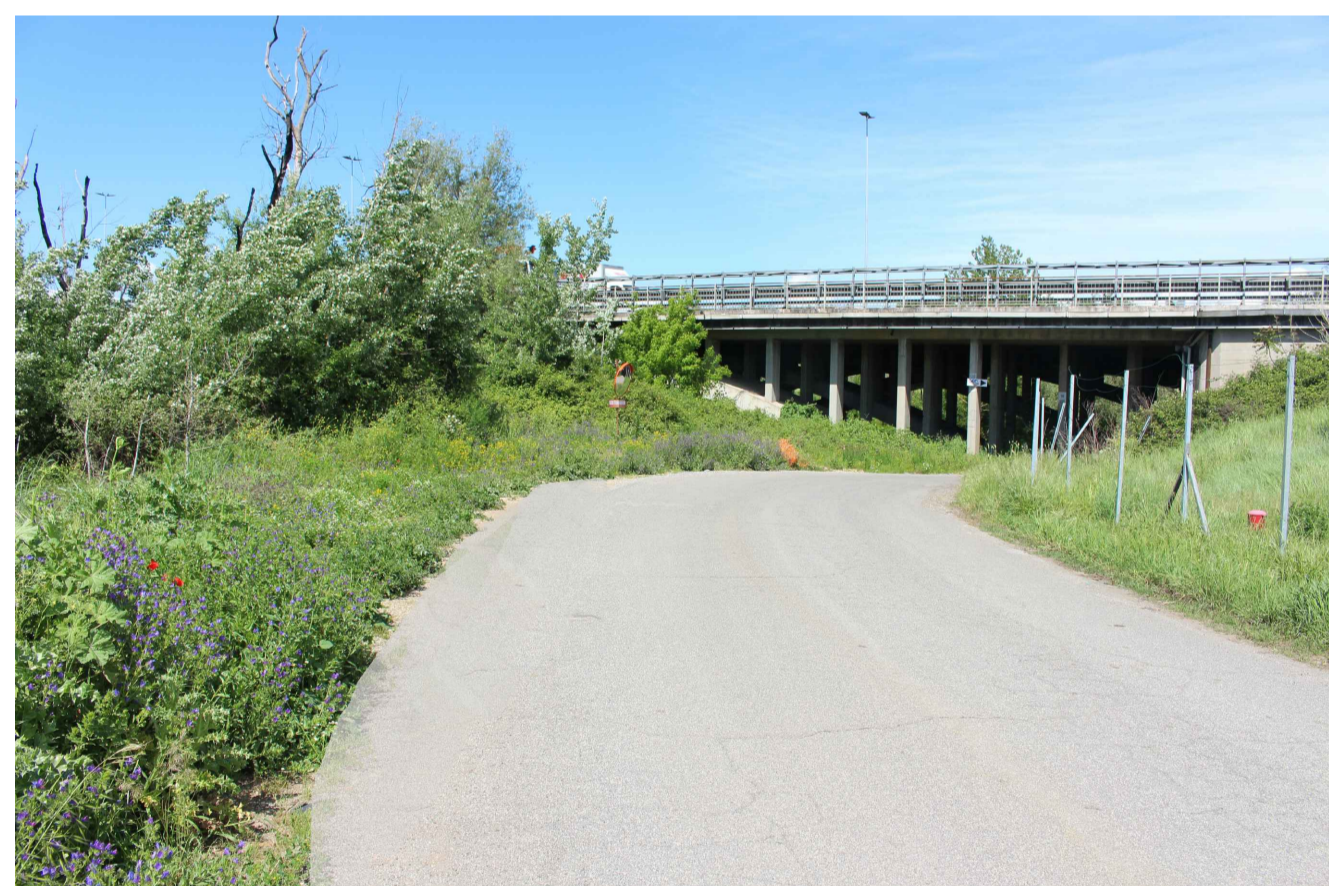
STATO ANTE OPERAM