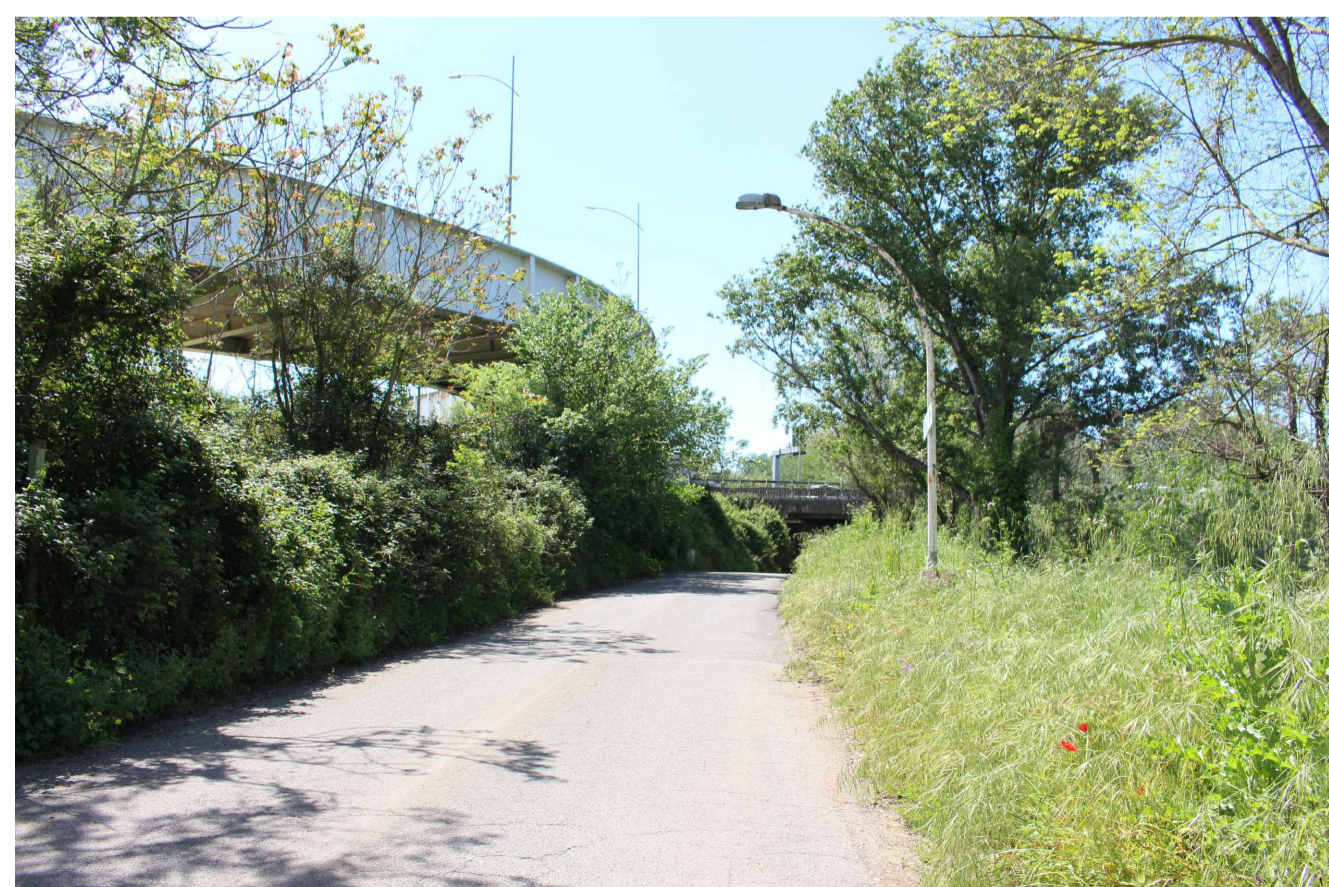
STATO ANTE OPERAM