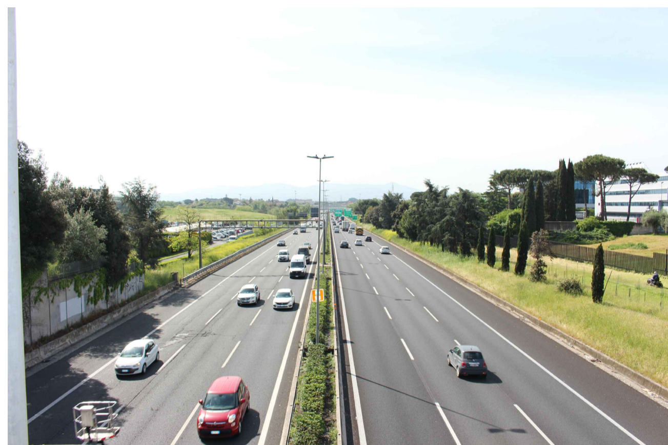
STATO ANTE OPERAM