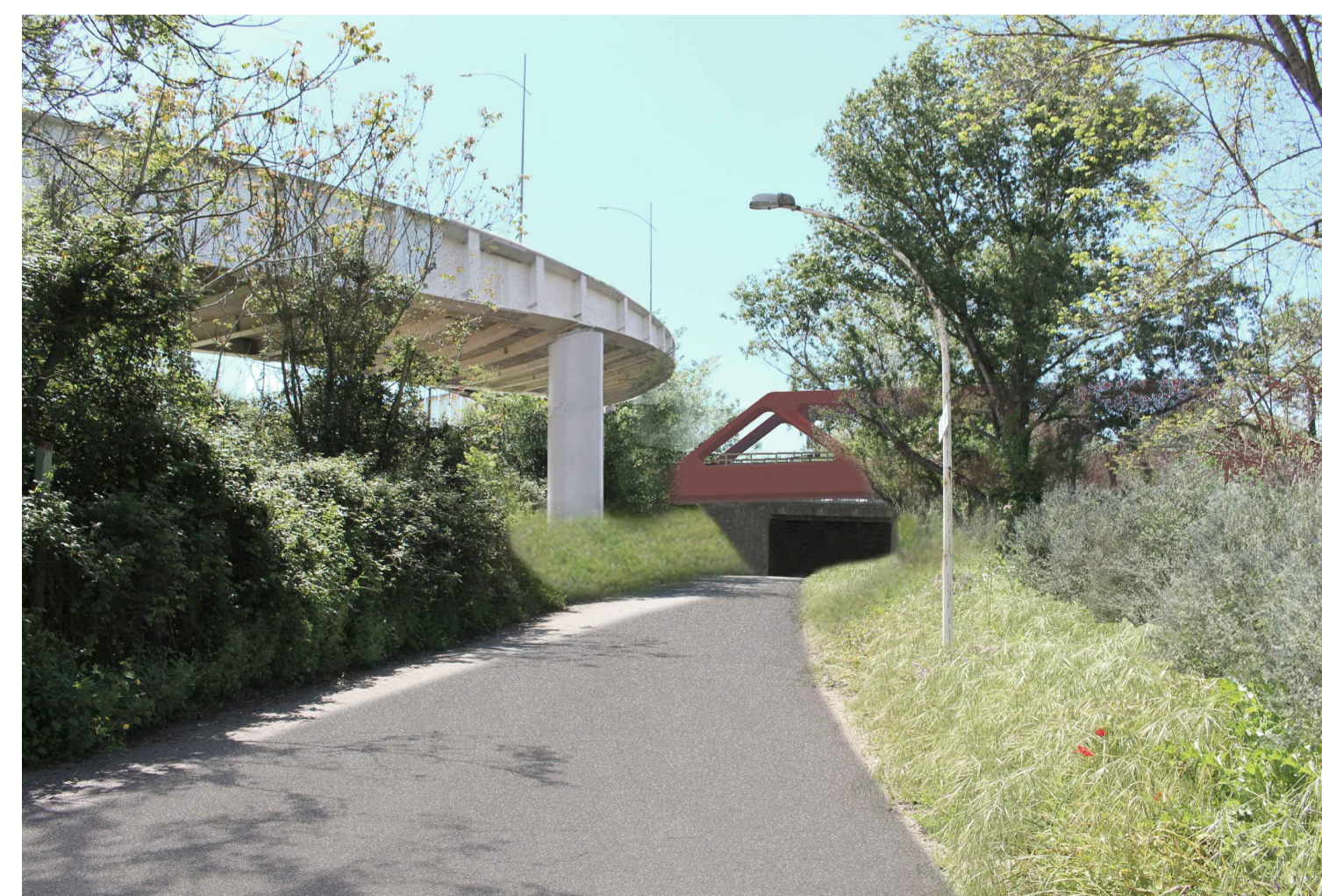
STATO POST OPERAM CON MITIGAZIONE