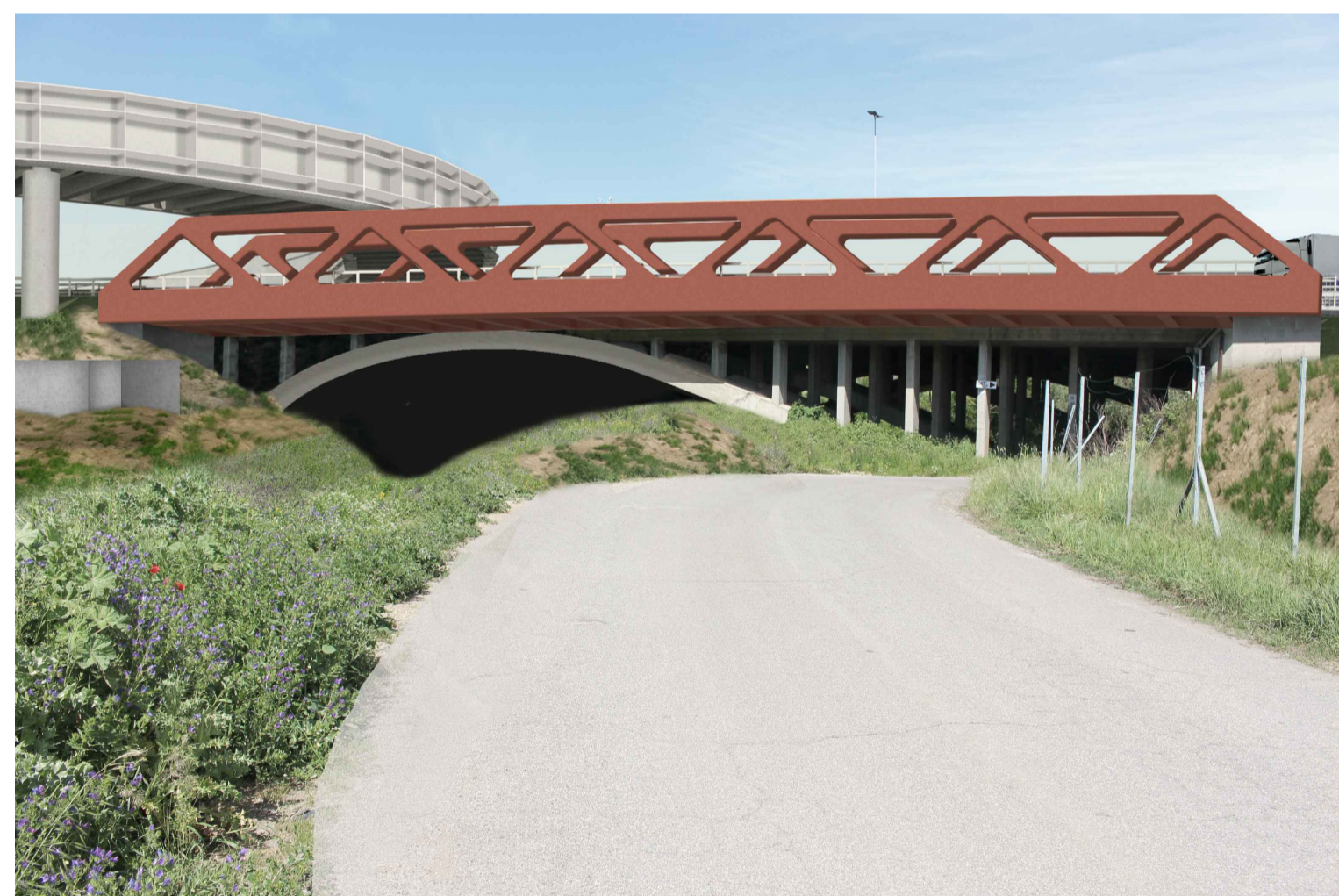
STATO POST OPERAM