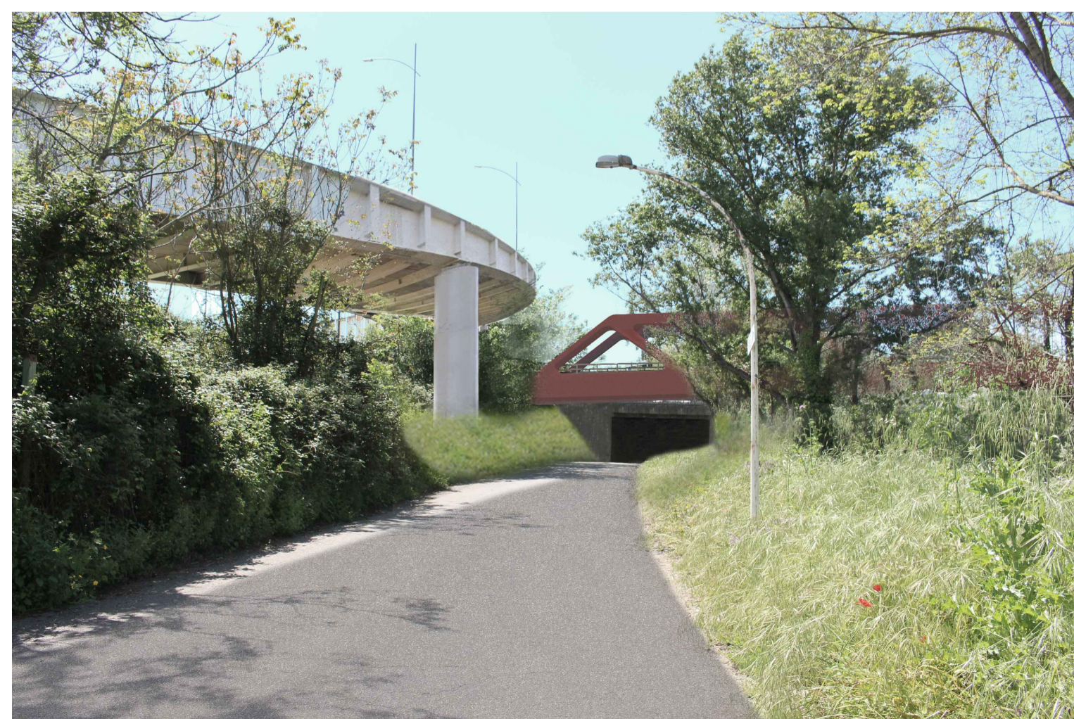
STATO POST OPERAM