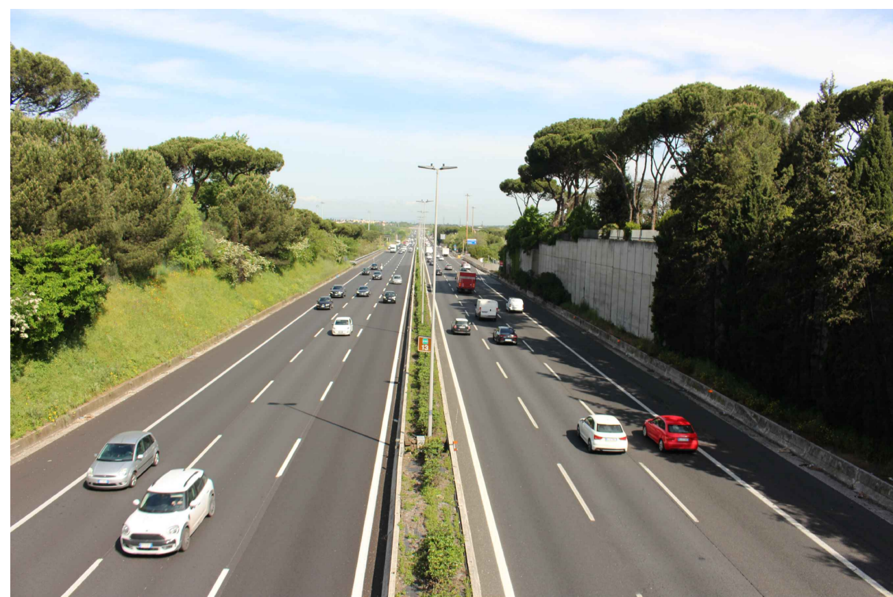
STATO ANTE OPERAM