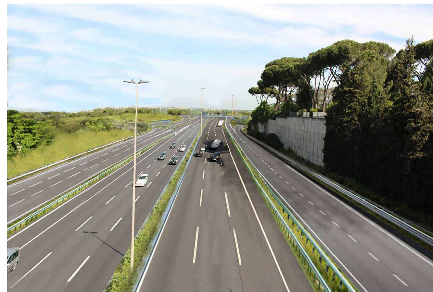
STATO POST OPERAM CON MITIGAZIONE