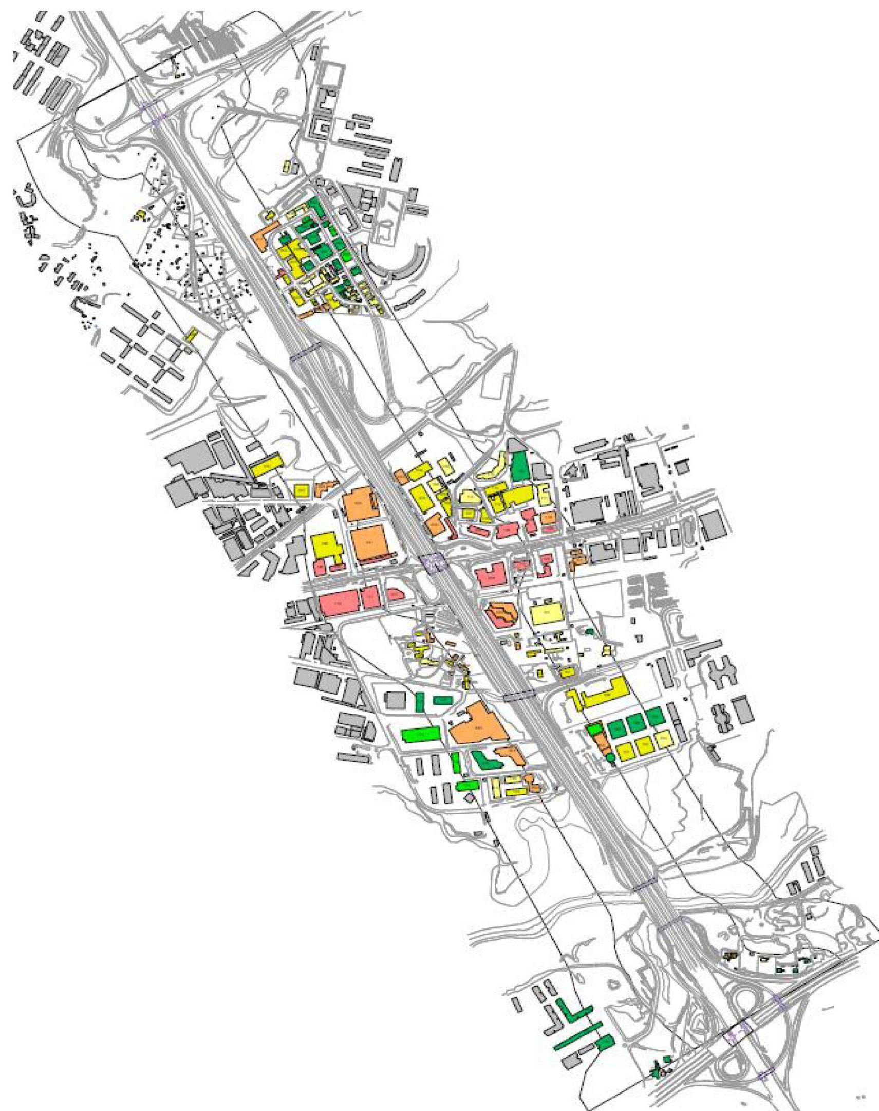
Vista C - AREA SUD