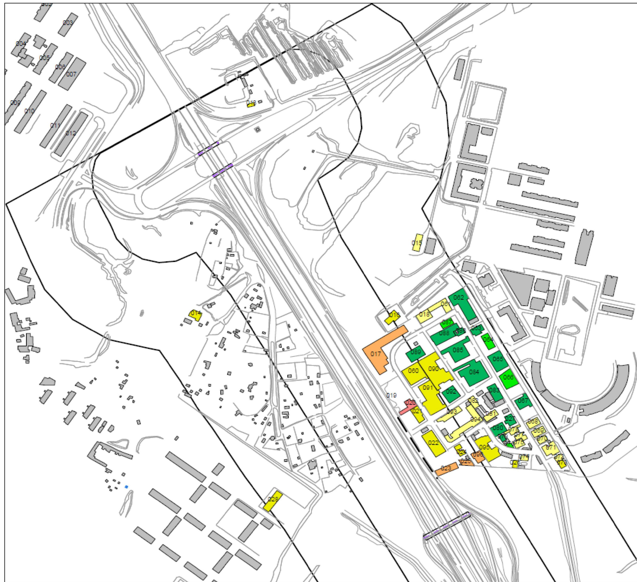
Vista A - AREA NORD