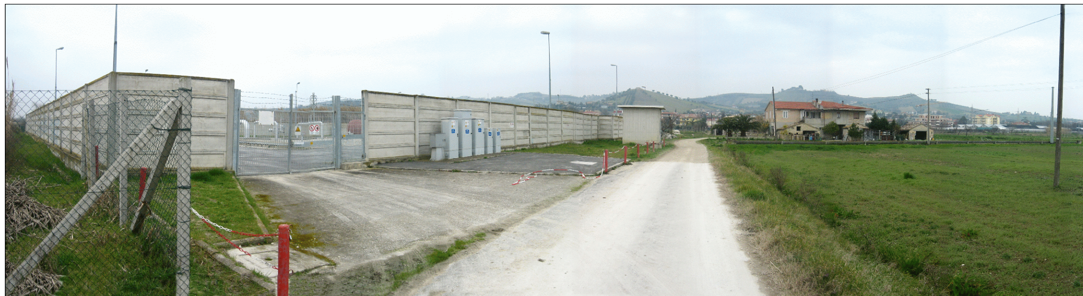
Foto 05 - Cameretta Snam.