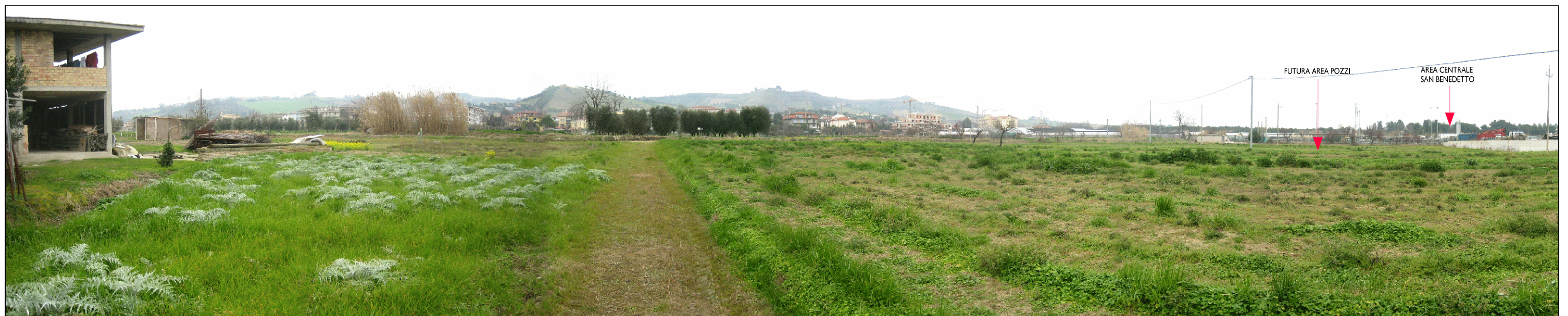
Foto 03- Panoramica area nord-est dell'area della Centrale San Benedetto.