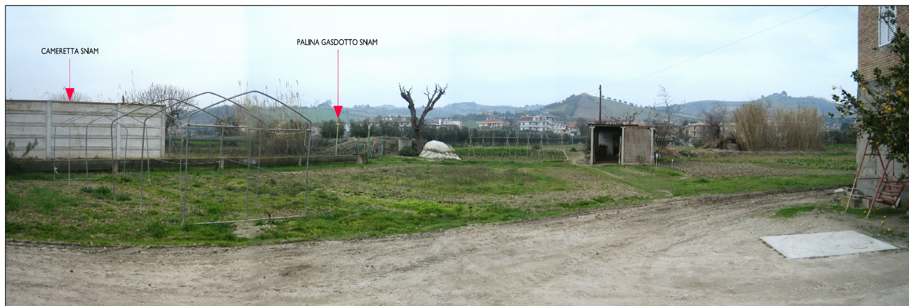
Foto 06 - Uscita gasdotto da cameretta Snam.