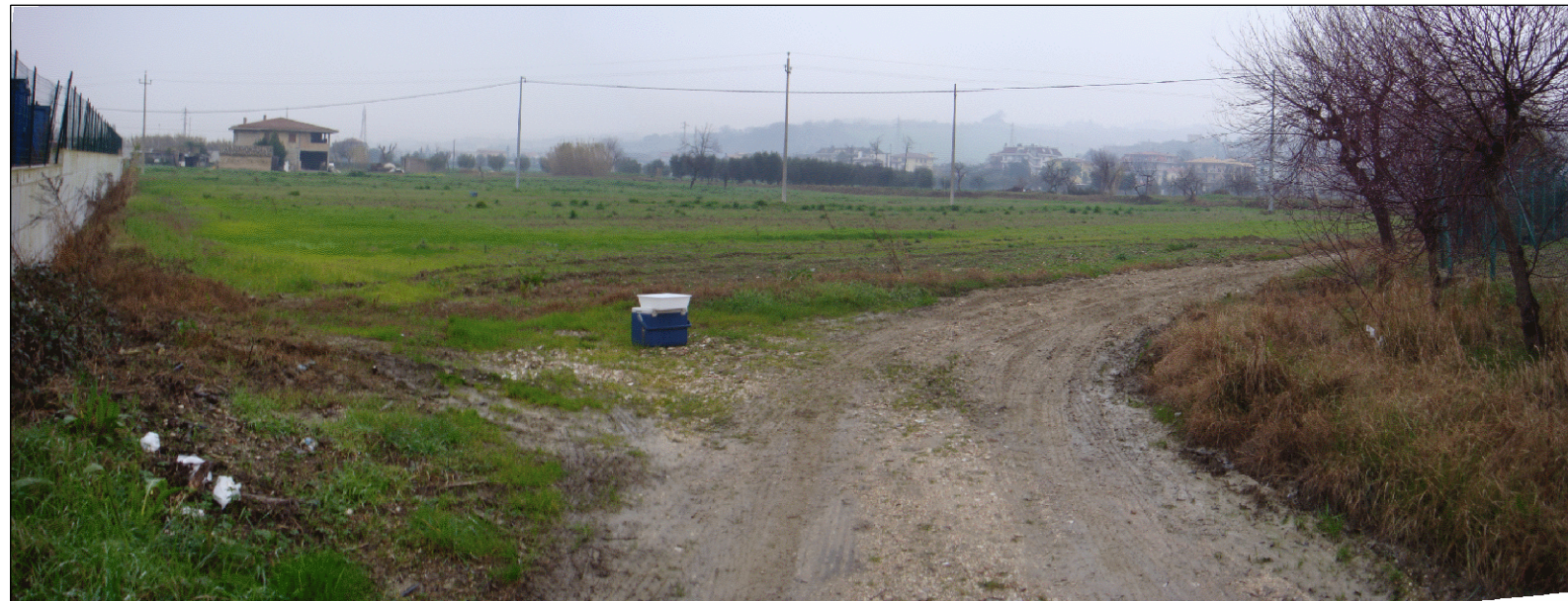
Foto 04 - Futura area pozzi adiacente al lato nord-ovest della Centrale San Benedetto.