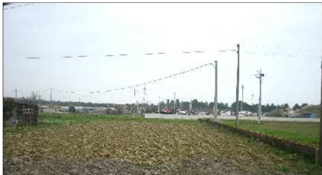
Foto 02 - Vista da ovest dell'area di progetto.