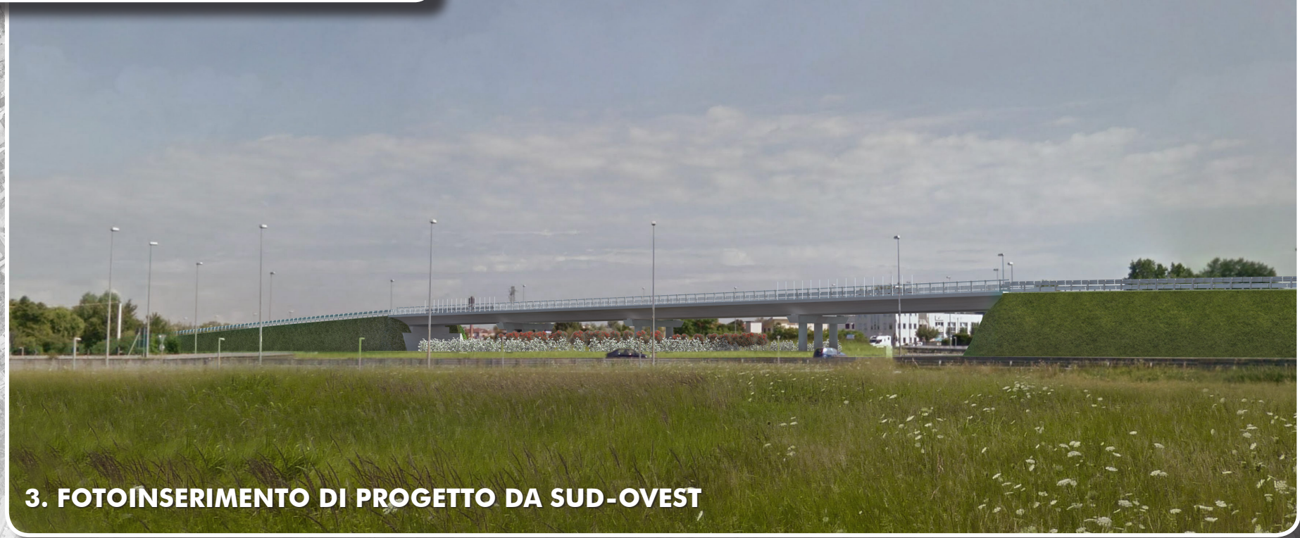
3. FOTOINSERIMENTO DI PROGETTO DA SUD-OVEST