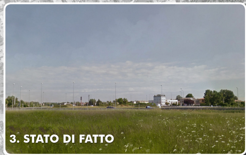
3. STATO DI FATTO