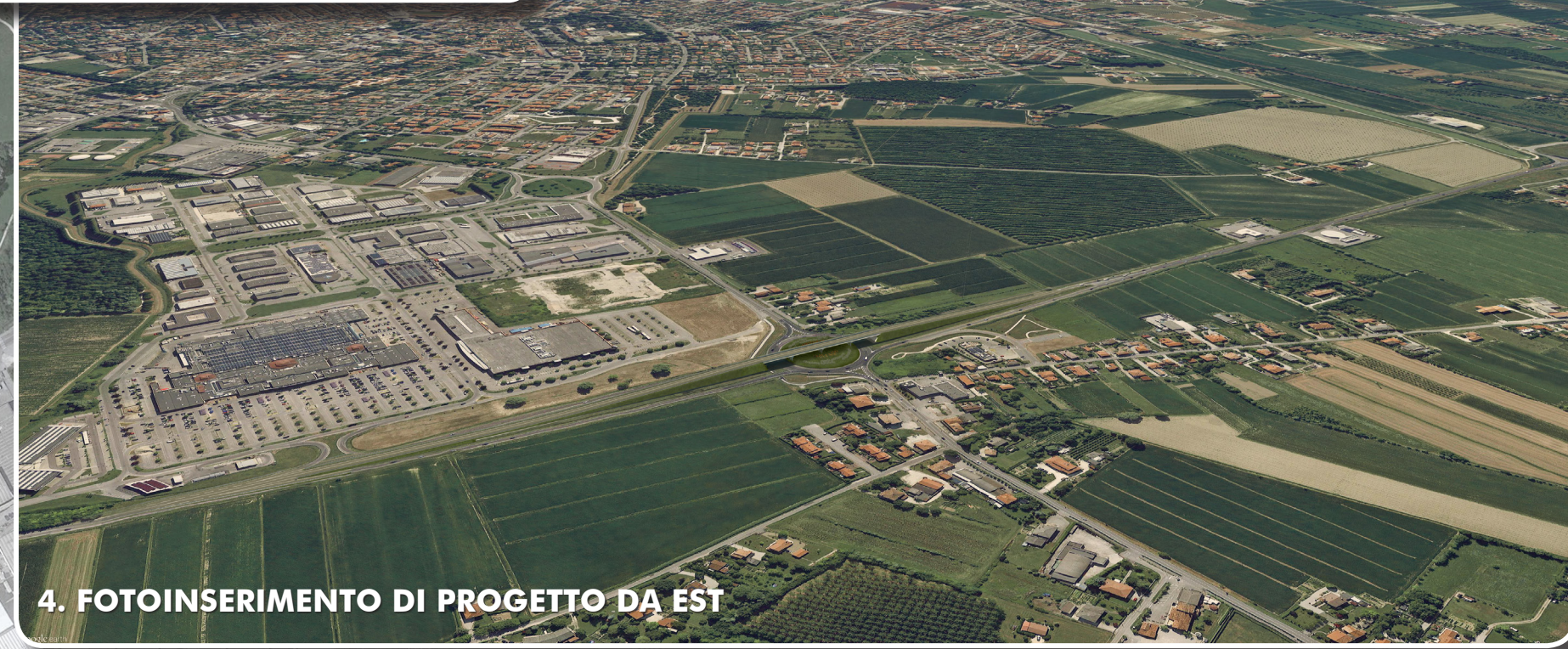
4. FOTOINSERIMENTO DI PROGETTO DA EST