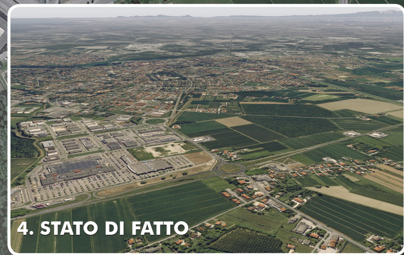
4. STATO DI FATTO