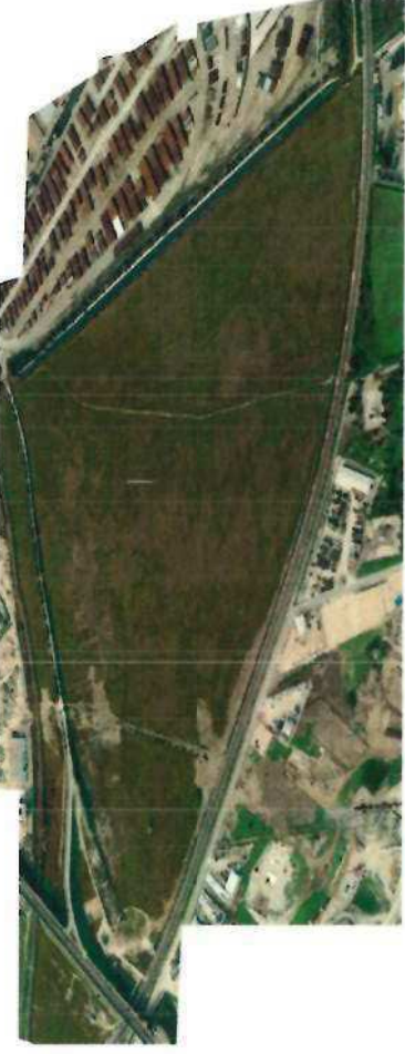
STATO DI FATTO DELL' AREA ESTERNA