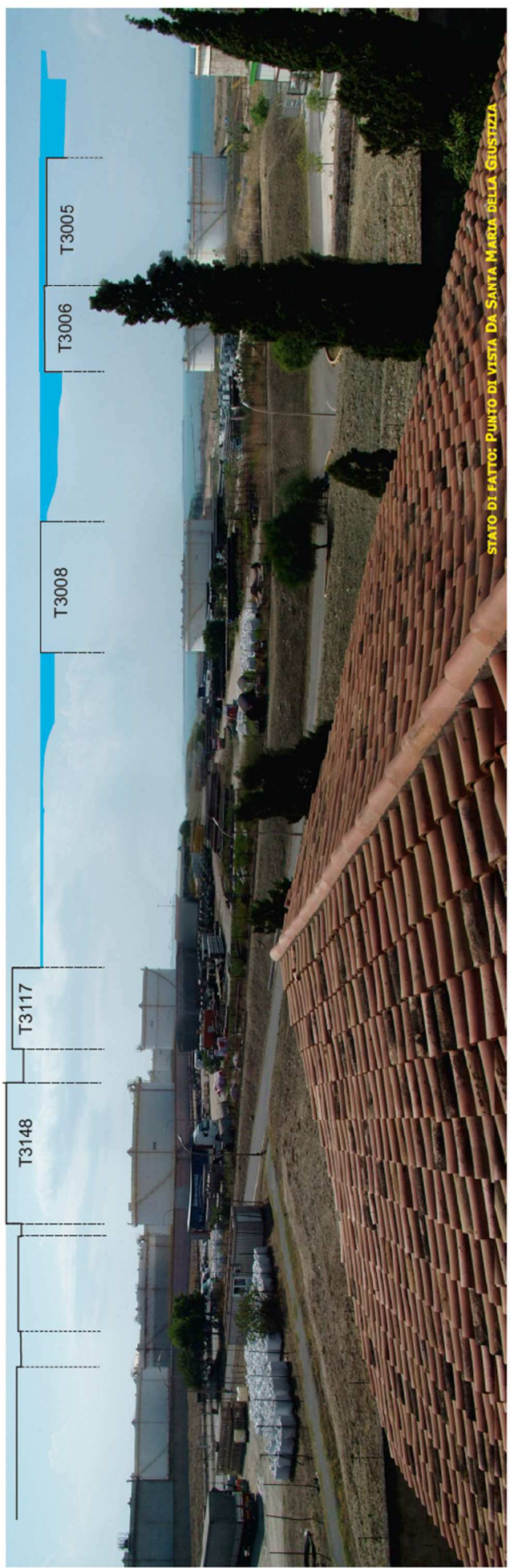
STATO DI FATTO: PUNTO DI VISTA DA SANTA MARIA DELLA GIUSTIZIA