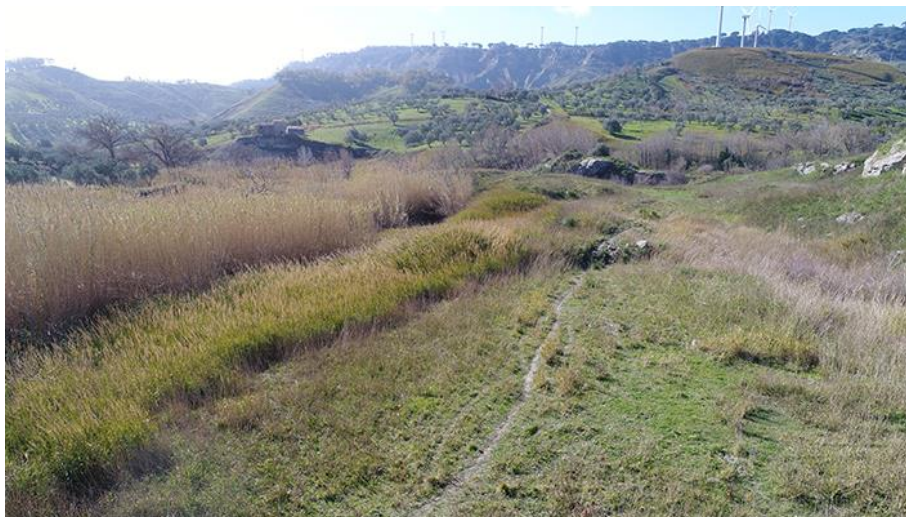
PANORAMICA INTERNA DA SUD-OVEST E CONDIZIONI DI VISIBILITA'