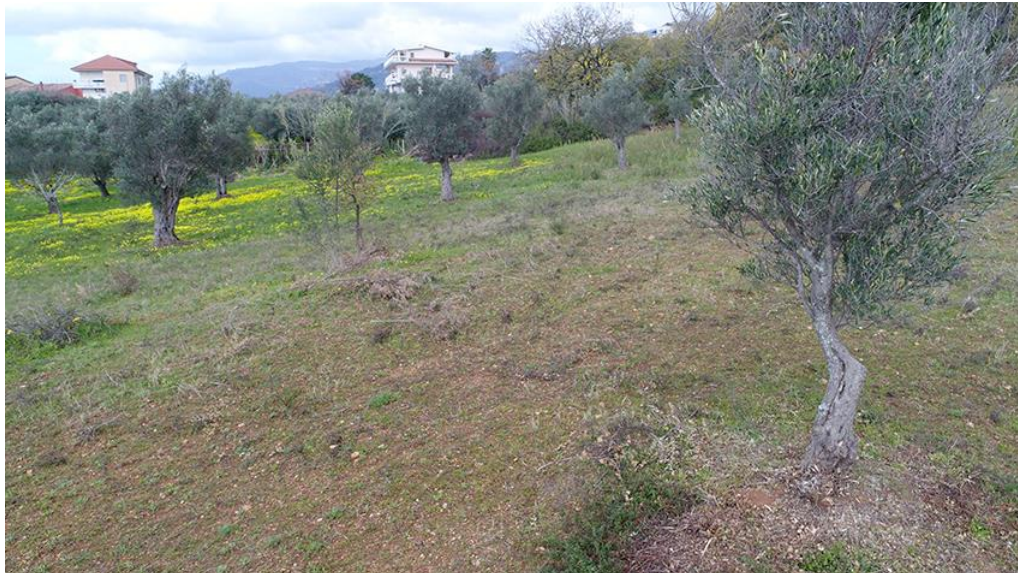
PANORAMICA INTERNA DA NORD-EST

COMMESSA LOTTO CODIFICA DOCUMENTO REV. FOGLIO RC0Y 00 R 22 SH AH 00 01 001 A 31 di 113