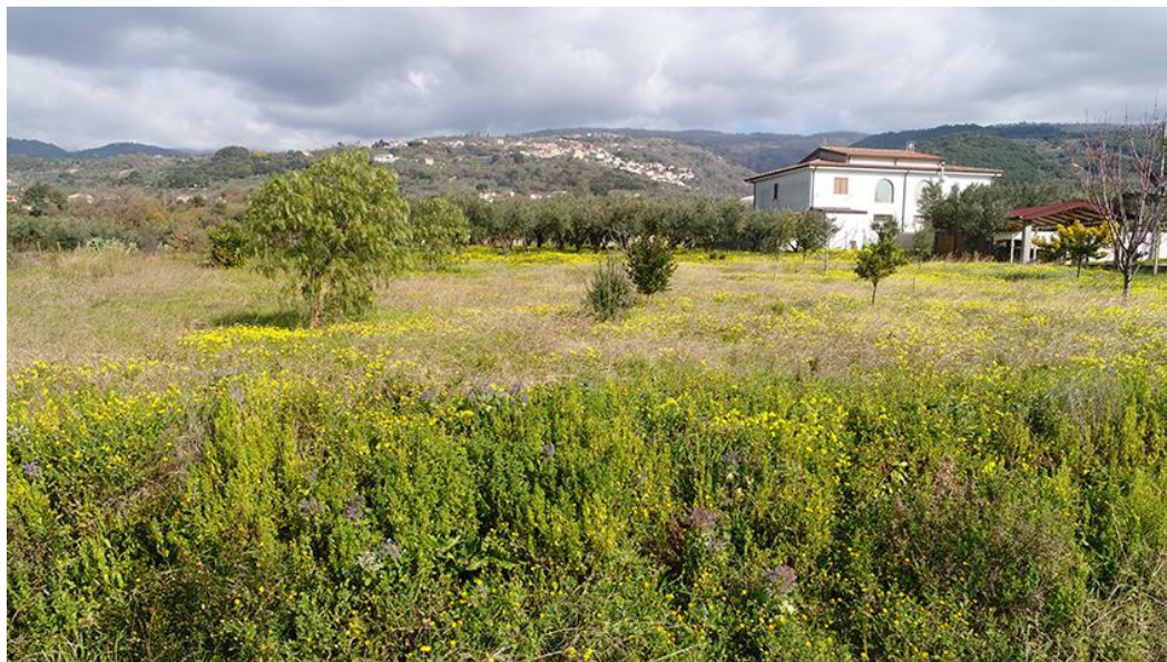
PANORAMICA DA SUD