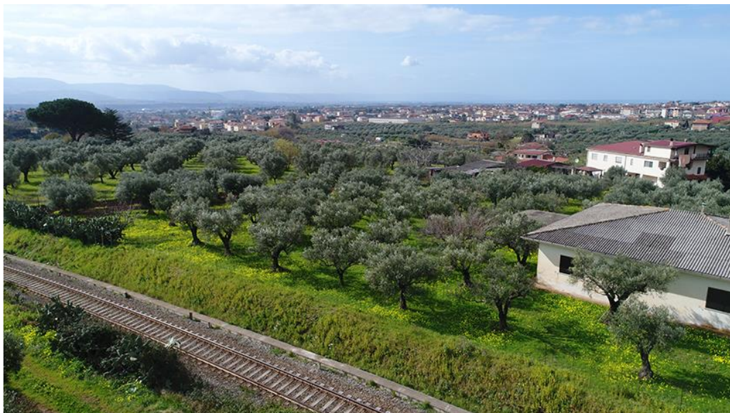
PANORAMICA DA EST

COMMESSA LOTTO CODIFICA DOCUMENTO REV. FOGLIO RC0Y 00 R 22 SH AH 00 01 001 A 45 di 113