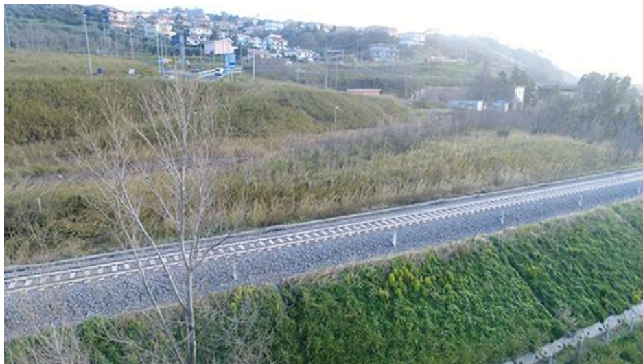
PANORAMICA DA SUD

COMMESSA LOTTO CODIFICA DOCUMENTO REV. FOGLIO RC0Y 00 R 22 SH AH 00 01 001 A 17 di 113