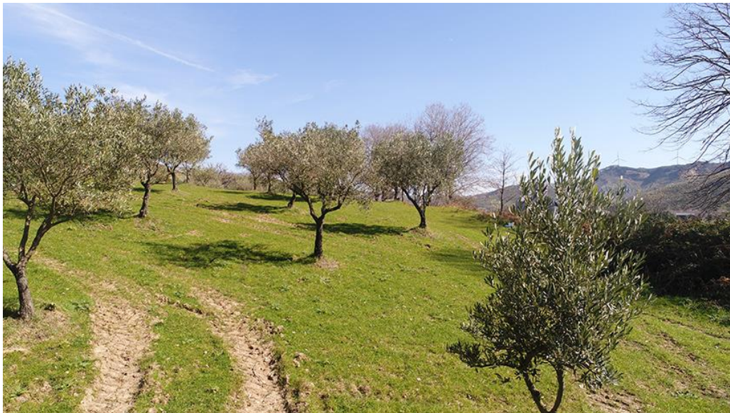
PANORAMICA DA OVEST