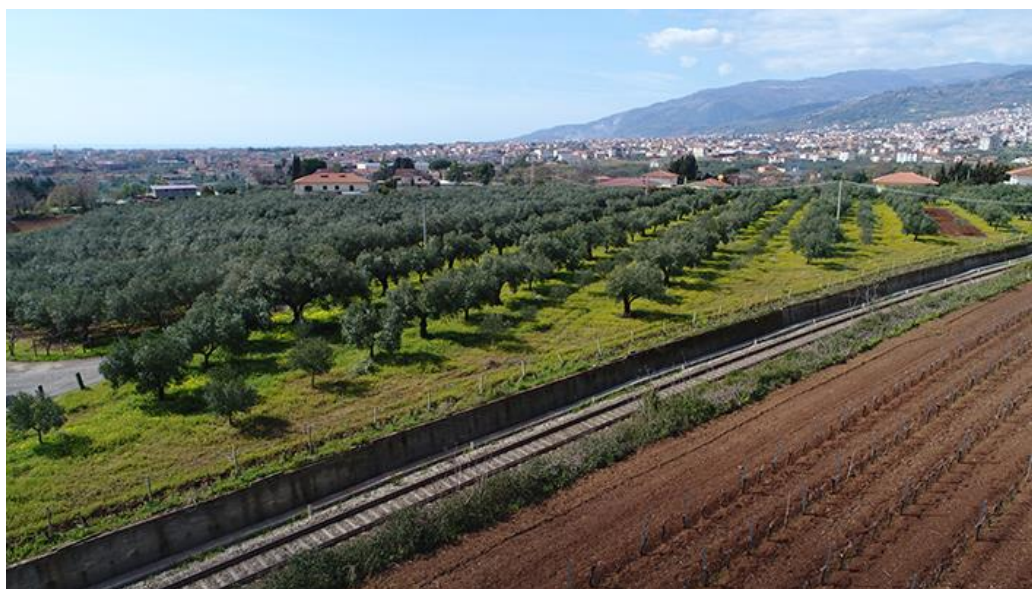
PANORAMICA DA SUD-EST