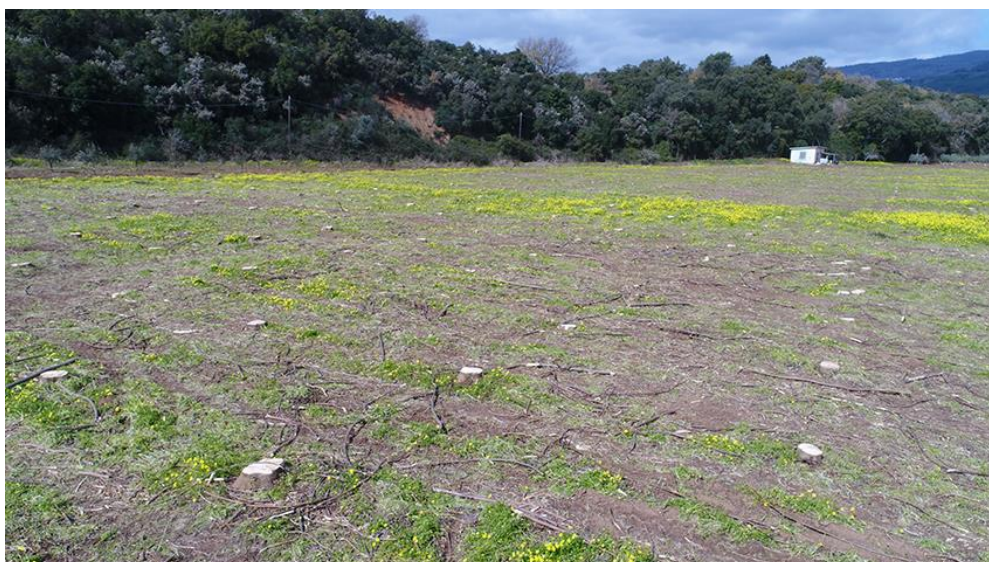
PANORAMICA DA SUD

COMMESSA LOTTO CODIFICA DOCUMENTO REV. FOGLIO RC0Y 00 R 22 SH AH 00 01 001 A 59 di 113