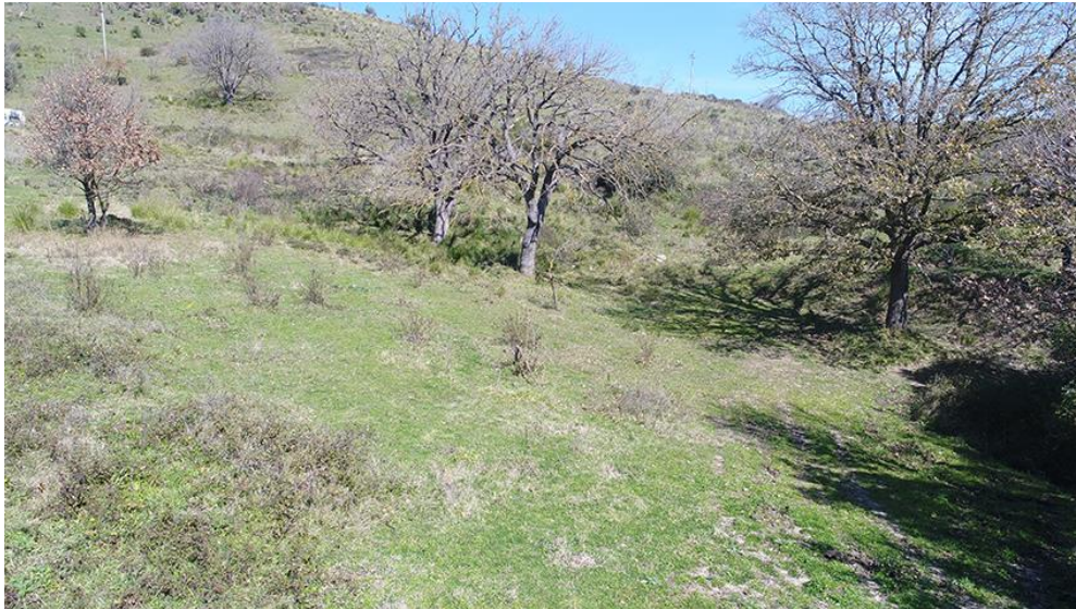
PANORAMICA DA OVEST

COMMESSA LOTTO CODIFICA DOCUMENTO REV. FOGLIO RC0Y 00 R 22 SH AH 00 01 001 A 105 di 113