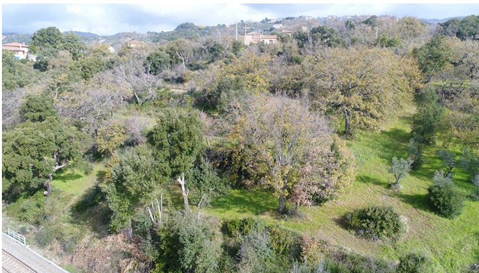
PANORAMICA AEREA D'ASUD