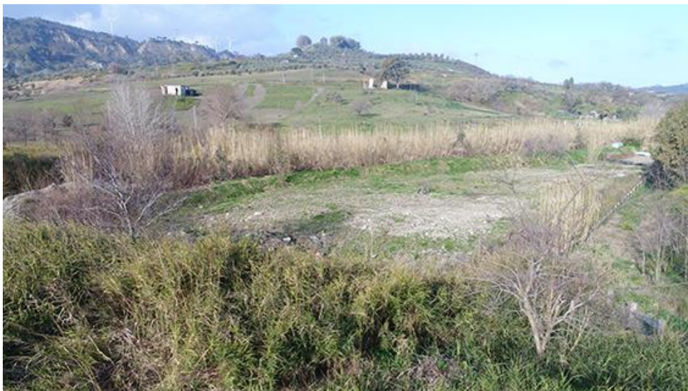
PANORAMICA DA NORD