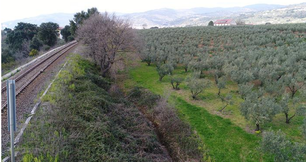
PANORAMICA AEREA DA SUD-EST

COMMESSA LOTTO CODIFICA DOCUMENTO REV. FOGLIO RC0Y 00 R 22 SH AH 00 01 001 A 73 di 113