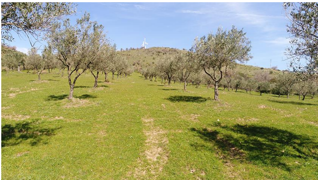
VISTA INTERNA DA SUD