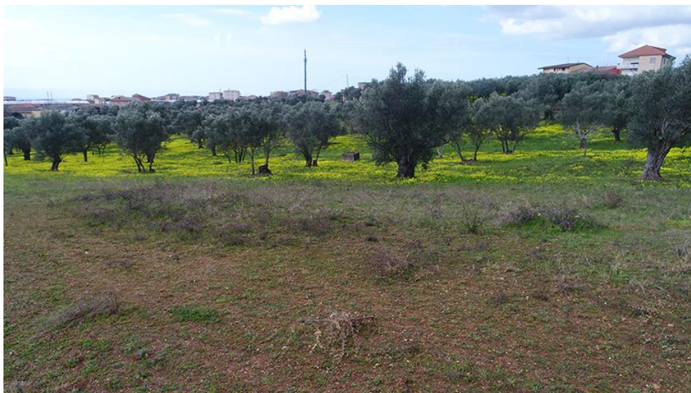
PANORAMICA AEREA DA EST