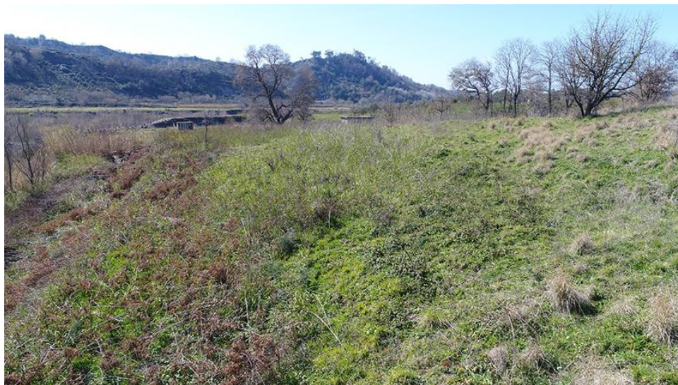
PANORAMICA INTERNA DA EST