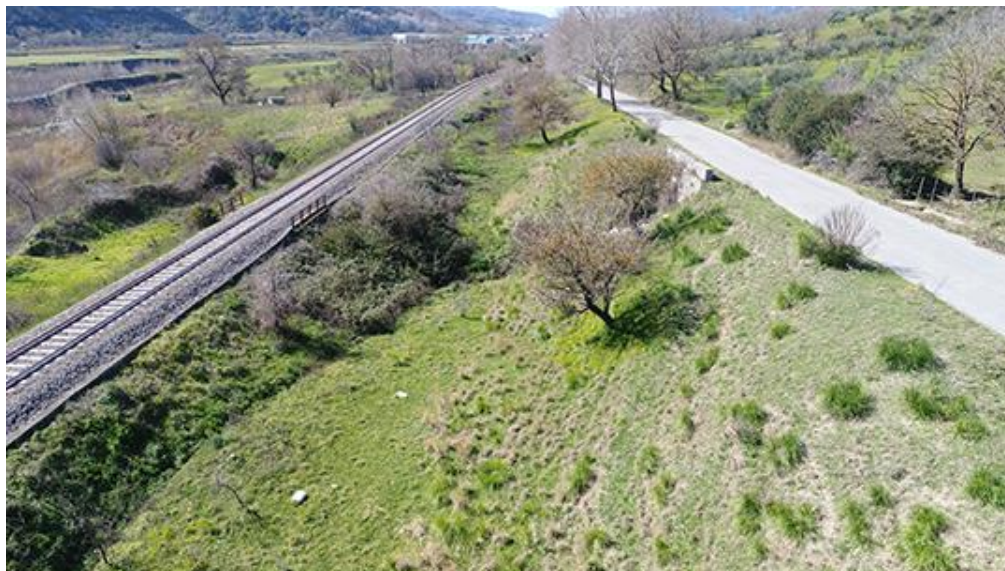
PANORAMICA DA EST

COMMESSA LOTTO CODIFICA DOCUMENTO REV. FOGLIO RC0Y 00 R 22 SH AH 00 01 001 A 99 di 113