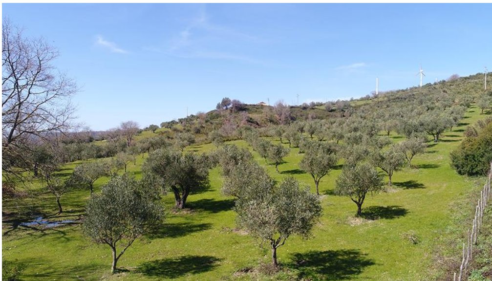
PANORAMICA DA SUD-EST

COMMESSA LOTTO CODIFICA DOCUMENTO REV. FOGLIO RC0Y 00 R 22 SH AH 00 01 001 A 89 di 113