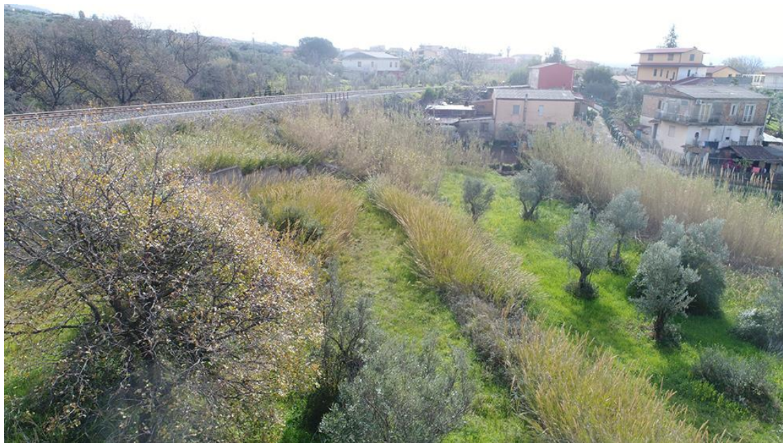
PANORAMICA AEREA DA OVEST