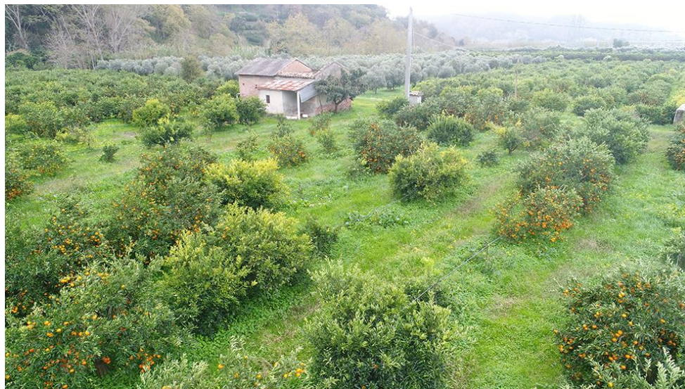
PANORAMICA DA NORD