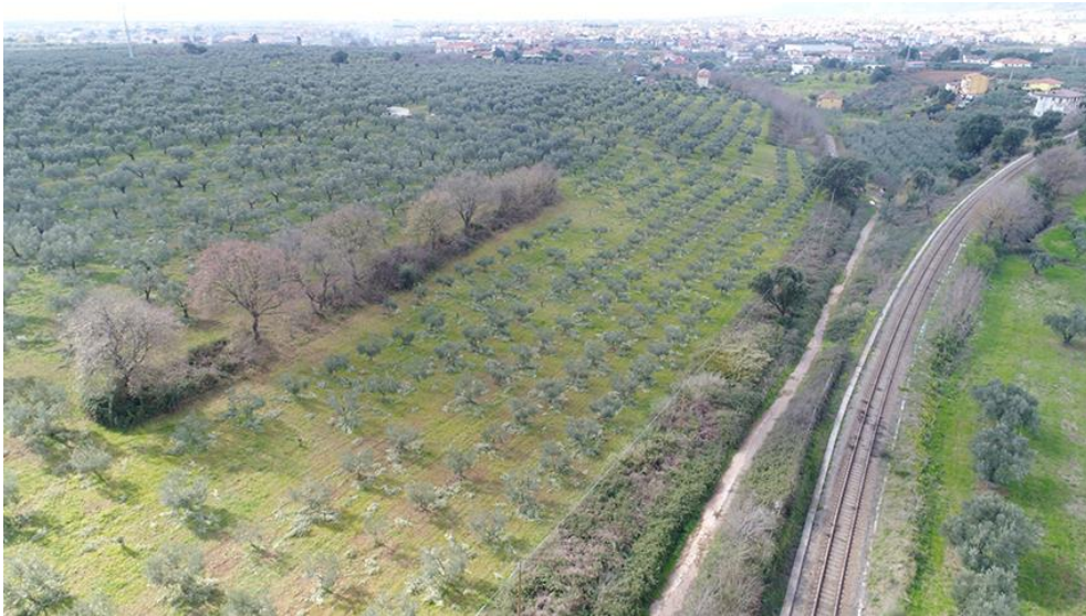
PANORAMICA AEREA DA NORD-EST

COMMESSA LOTTO CODIFICA DOCUMENTO REV. FOGLIO RC0Y 00 R 22 SH AH 00 01 001 A 69 di 113