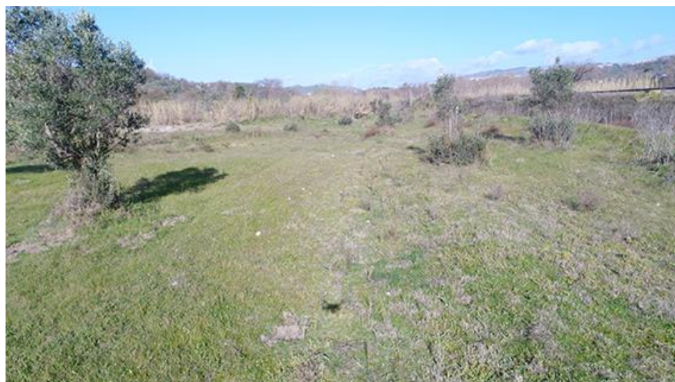
PANORAMICA INTERNA DA SUD-OVEST E CONDIZIONI DI VISIBILITA'