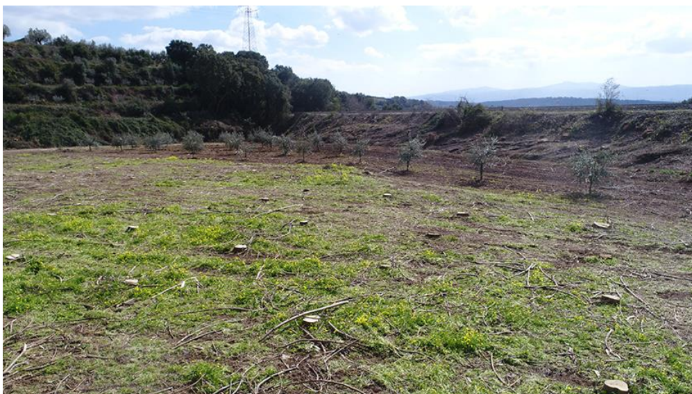
PANORAMICA DA NORD-EST