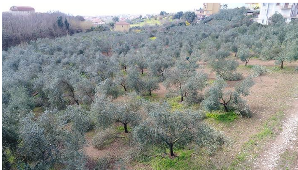
PANORAMICA DA EST

COMMESSA LOTTO CODIFICA DOCUMENTO REV. FOGLIO RC0Y 00 R 22 SH AH 00 01 001 A 81 di 113