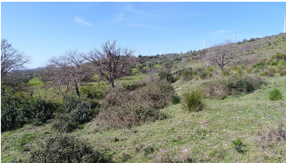
PANORAMICA DA EST'