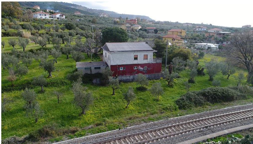
PANORAMICA AEREA DA SUD

COMMESSA LOTTO CODIFICA DOCUMENTO REV. FOGLIO RC0Y 00 R 22 SH AH 00 01 001 A 35 di 113