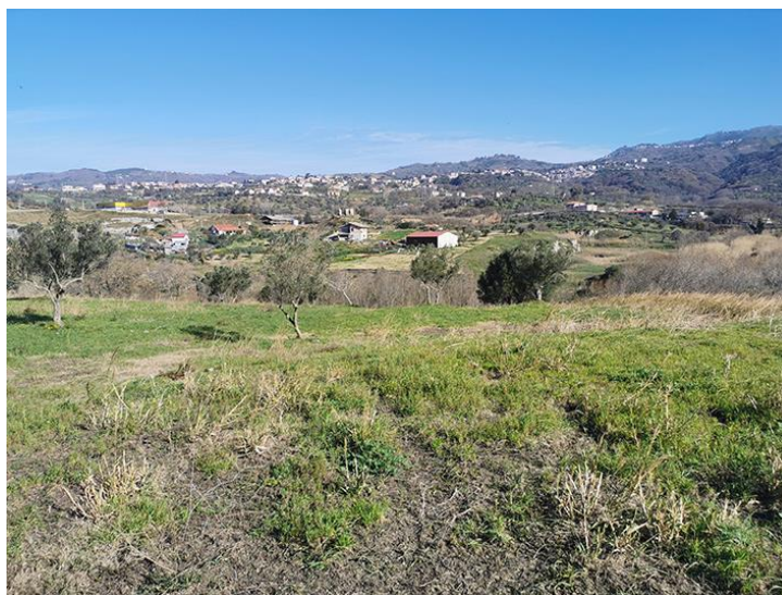
PANORAMICA DA NORD