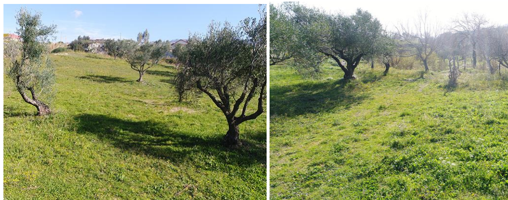
PANORAMICA INTERNA DA SUD-OVEST E CONDIZIONI DI VISIBILITA'