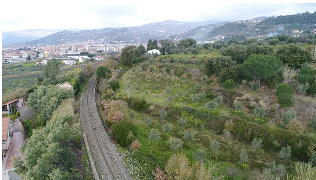
PANORAMICA DA SUD-EST