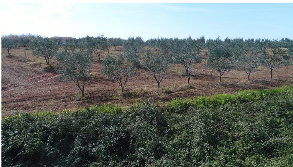
PANORAMICA DA NORD-EST

COMMESSA LOTTO CODIFICA DOCUMENTO REV. FOGLIO RC0Y 00 R 22 SH AH 00 01 001 A 65 di 113