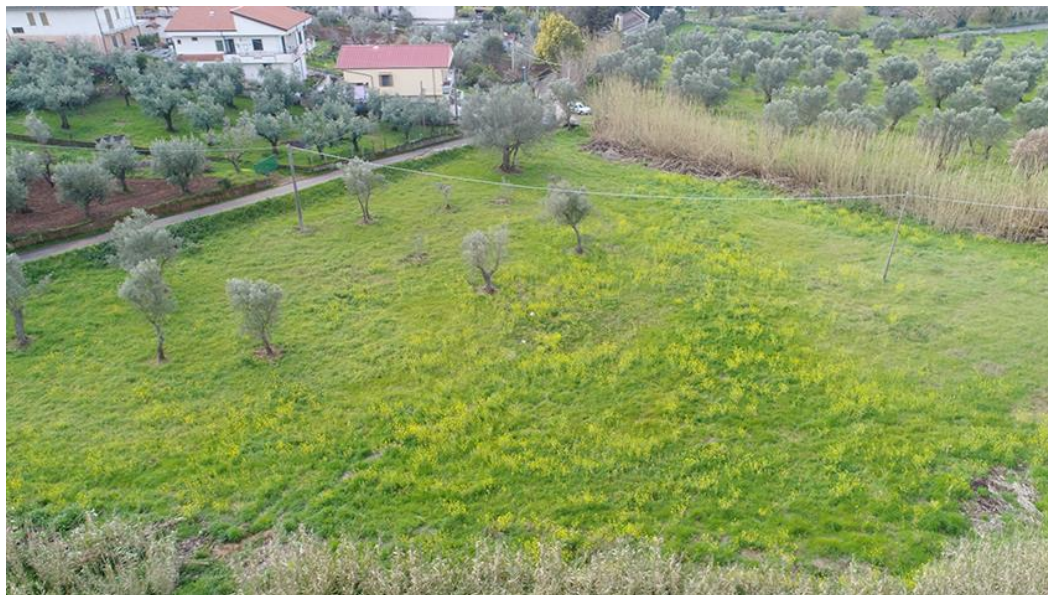
PANORAMICA AEREA DA NORD

COMMESSA LOTTO CODIFICA DOCUMENTO REV. FOGLIO RC0Y 00 R 22 SH AH 00 01 001 A 33 di 113