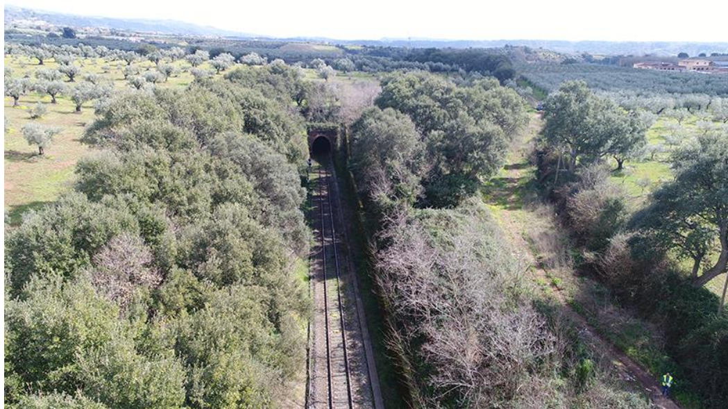
PANORAMICA AEREA DA OVEST

COMMESSA LOTTO CODIFICA DOCUMENTO REV. FOGLIO RC0Y 00 R 22 SH AH 00 01 001 A 71 di 113