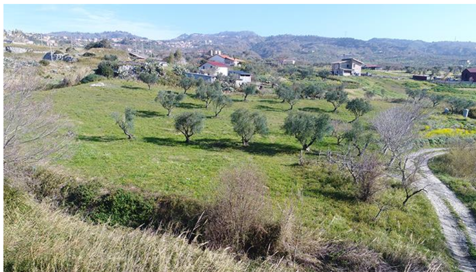
PANORAMICA DA SUD-OVEST