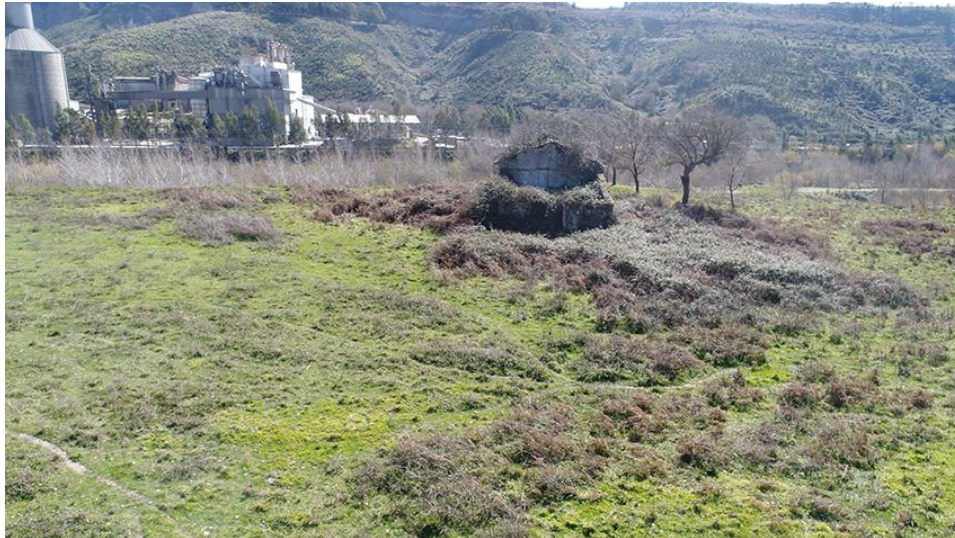
PANORAMICA DA NORD

COMMESSA LOTTO CODIFICA DOCUMENTO REV. FOGLIO RC0Y 00 R 22 SH AH 00 01 001 A 83 di 113