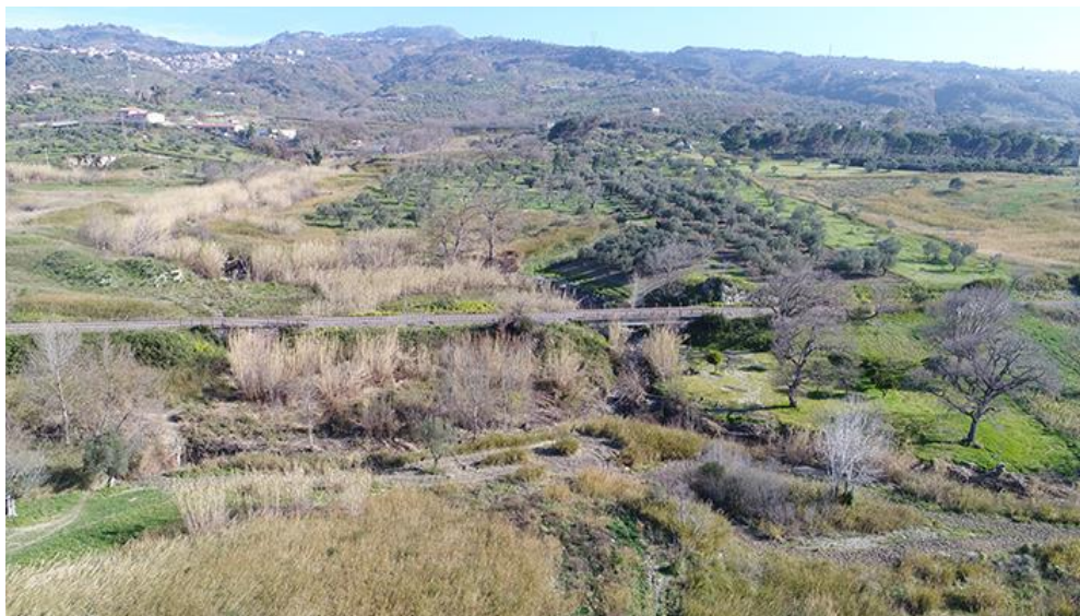
PANORAMICA DA NORD

COMMESSA LOTTO CODIFICA DOCUMENTO REV. FOGLIO RC0Y 00 R 22 SH AH 00 01 001 A 11 di 113