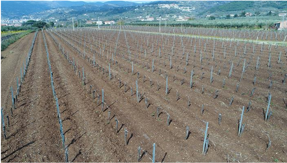
PANORAMICA DA SUD-EST

COMMESSA LOTTO CODIFICA DOCUMENTO REV. FOGLIO RC0Y 00 R 22 SH AH 00 01 001 A 75 di 113