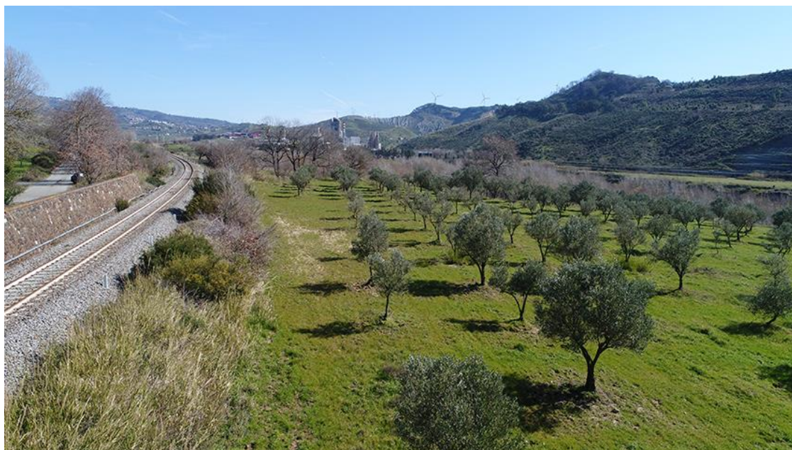
PANORAMICA DA NORD