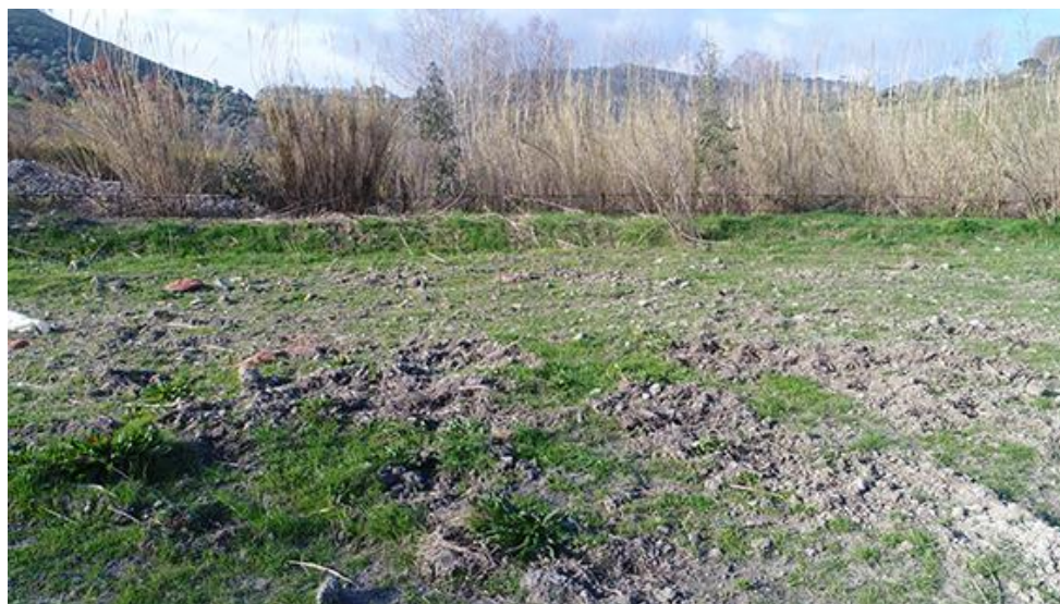
PANORAMICA INTERNA DA SUD-OVEST E CONDIZIONI DI VISIBILITA'