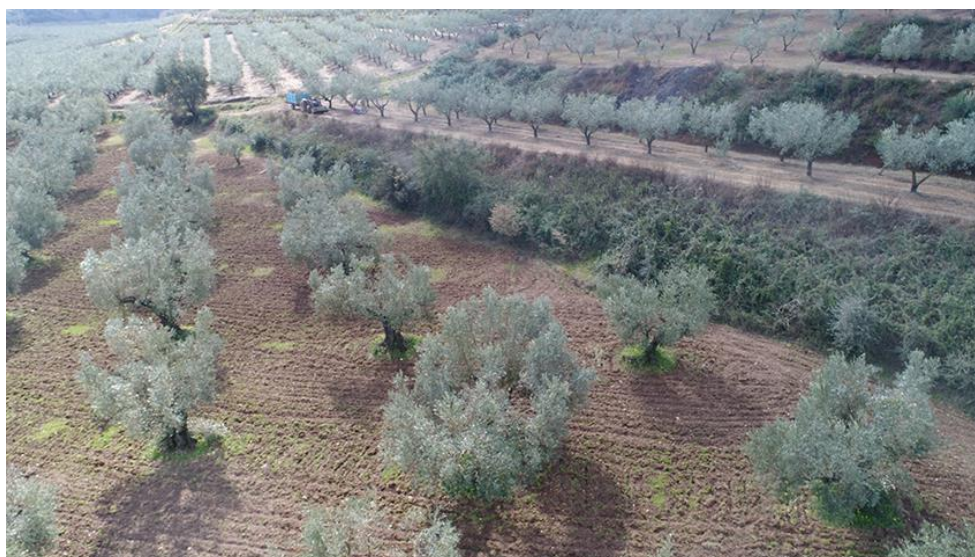
PANORAMICA DA NORD

COMMESSA LOTTO CODIFICA DOCUMENTO REV. FOGLIO RC0Y 00 R 22 SH AH 00 01 001 A 61 di 113