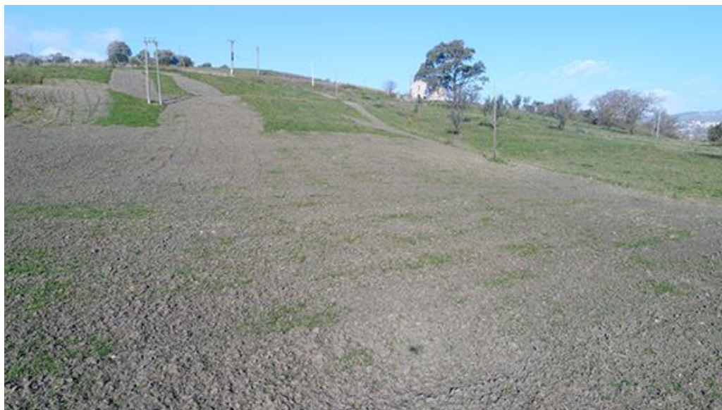
PANORAMICA INTERNA E CONDIZIONI DI VISIBILITA'