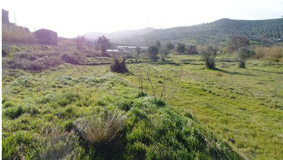
PANORAMICA DA NORD

COMMESSA LOTTO CODIFICA DOCUMENTO REV. FOGLIO RC0Y 00 R 22 SH AH 00 01 001 A 25 di 113