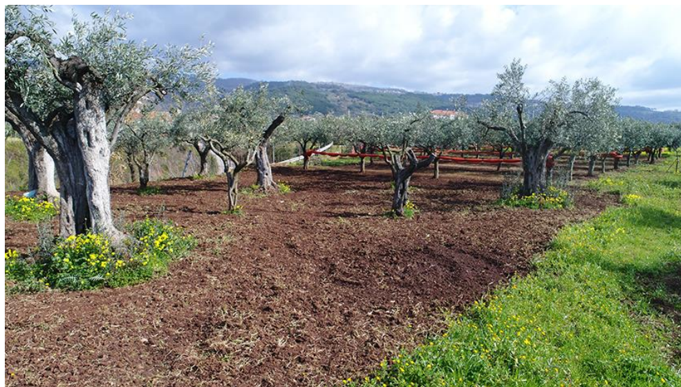
PANORAMICA INTERNA DA OVEST