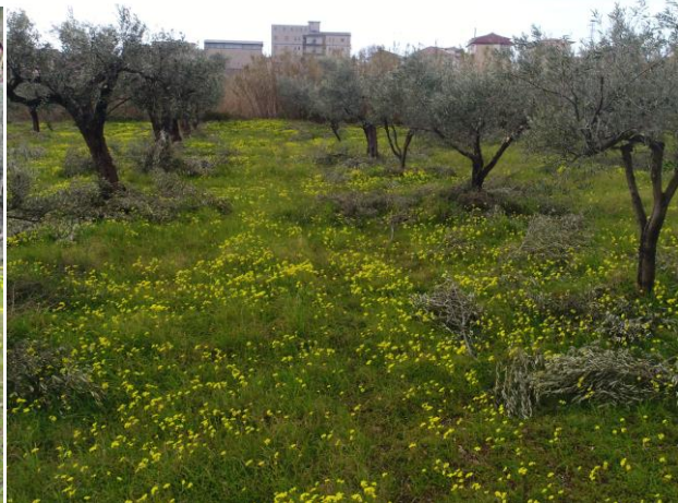
DETTAGL I INTERNI