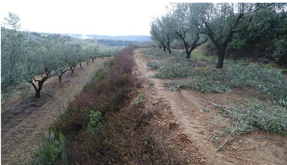
PANORAMICA DA NORD

COMMESSA LOTTO CODIFICA DOCUMENTO REV. FOGLIO RC0Y 00 R 22 SH AH 00 01 001 A 63 di 113