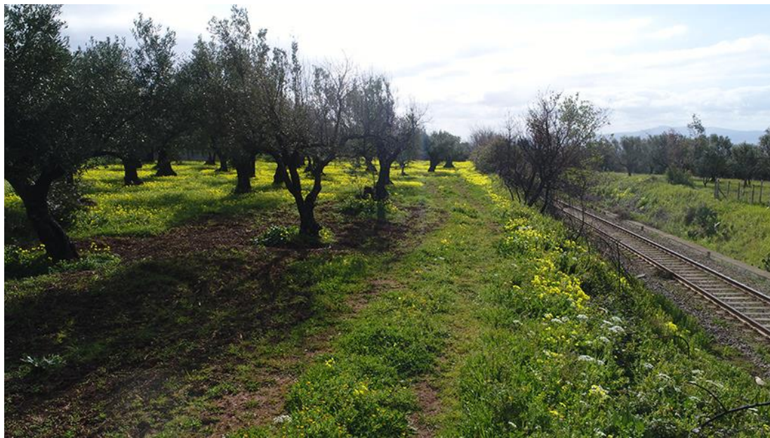
PANORAMICA INTERNA DANORD