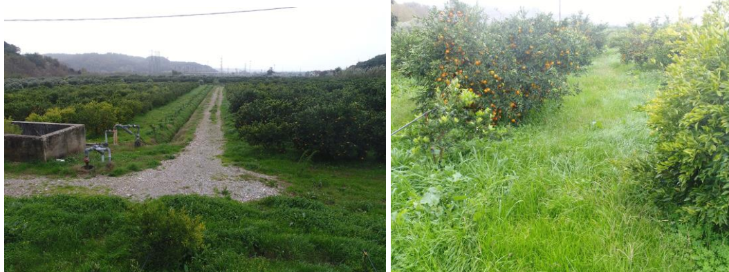
PANORAMICA INTERNA DA SUD-OVEST E CONDIZIONI DI VISIBILITA'