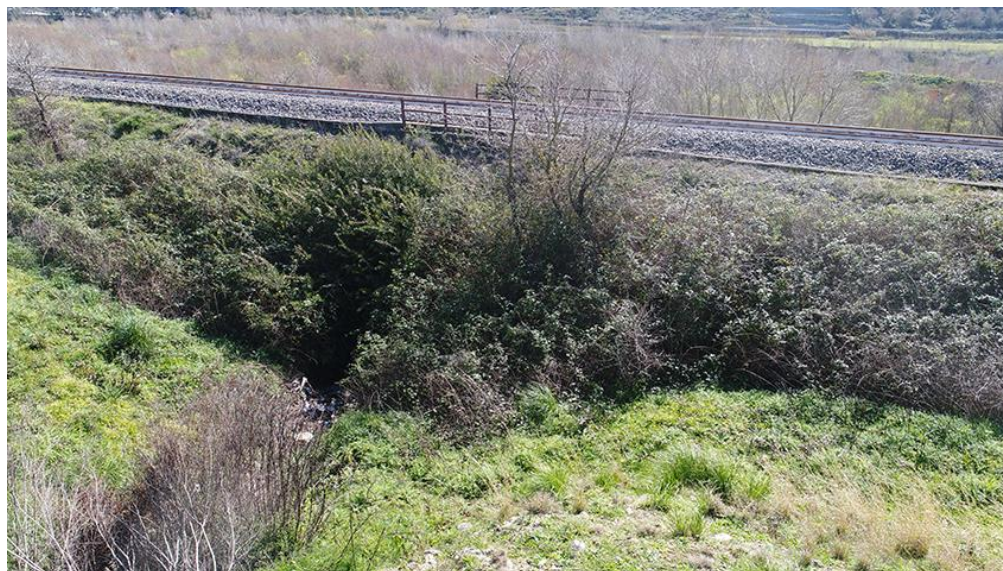
DETTAGLIO CONDIZIONI DI VISIBILITA'