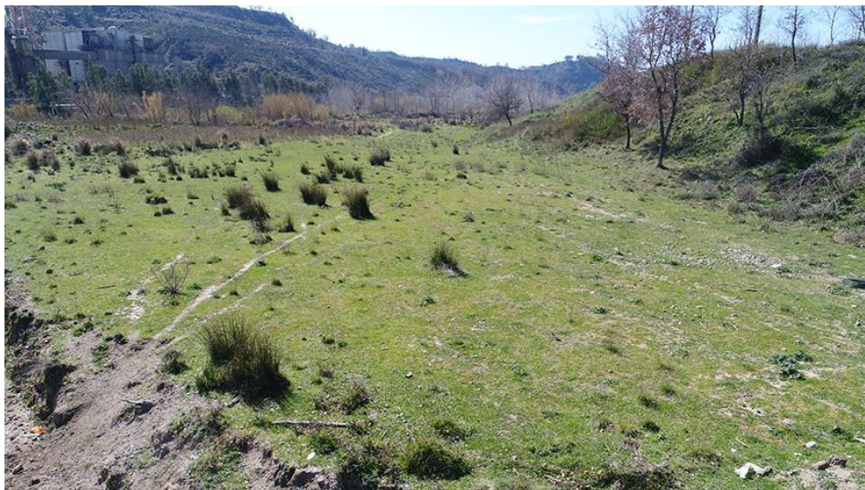
PANORAMICA INTERNA DEL TERRAZZO PIÙ BASSO