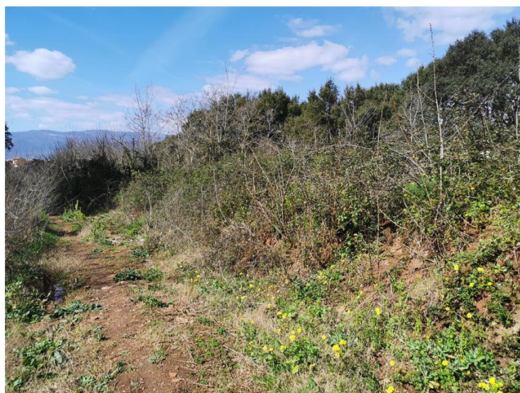
DETTAGLIO DA SUD