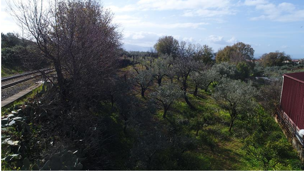
PANORAMICA AEREA DA NORD