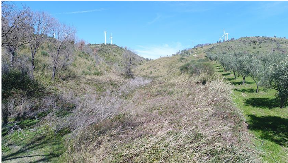
PANORAMICA DA SUD

COMMESSA LOTTO CODIFICA DOCUMENTO REV. FOGLIO RC0Y 00 R 22 SH AH 00 01 001 A 110 di 113