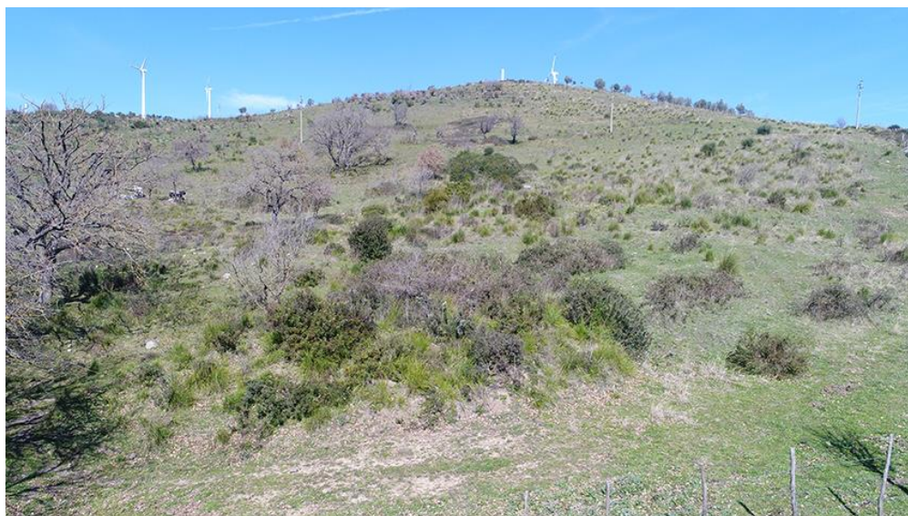
PANORAMICA DA SUD