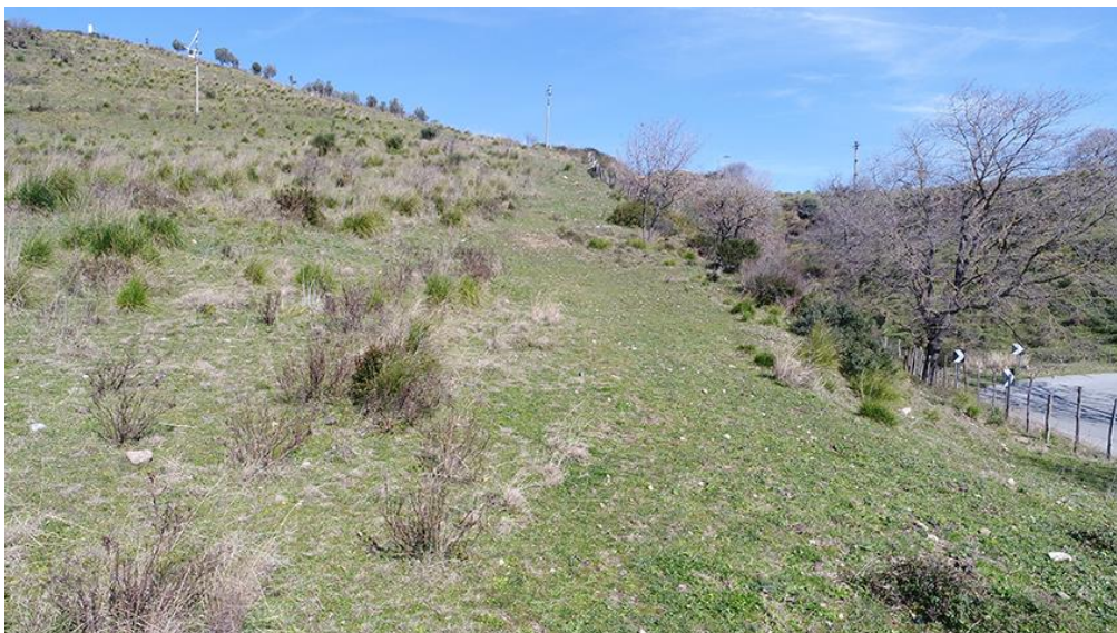
PANORAMICA DA OVEST