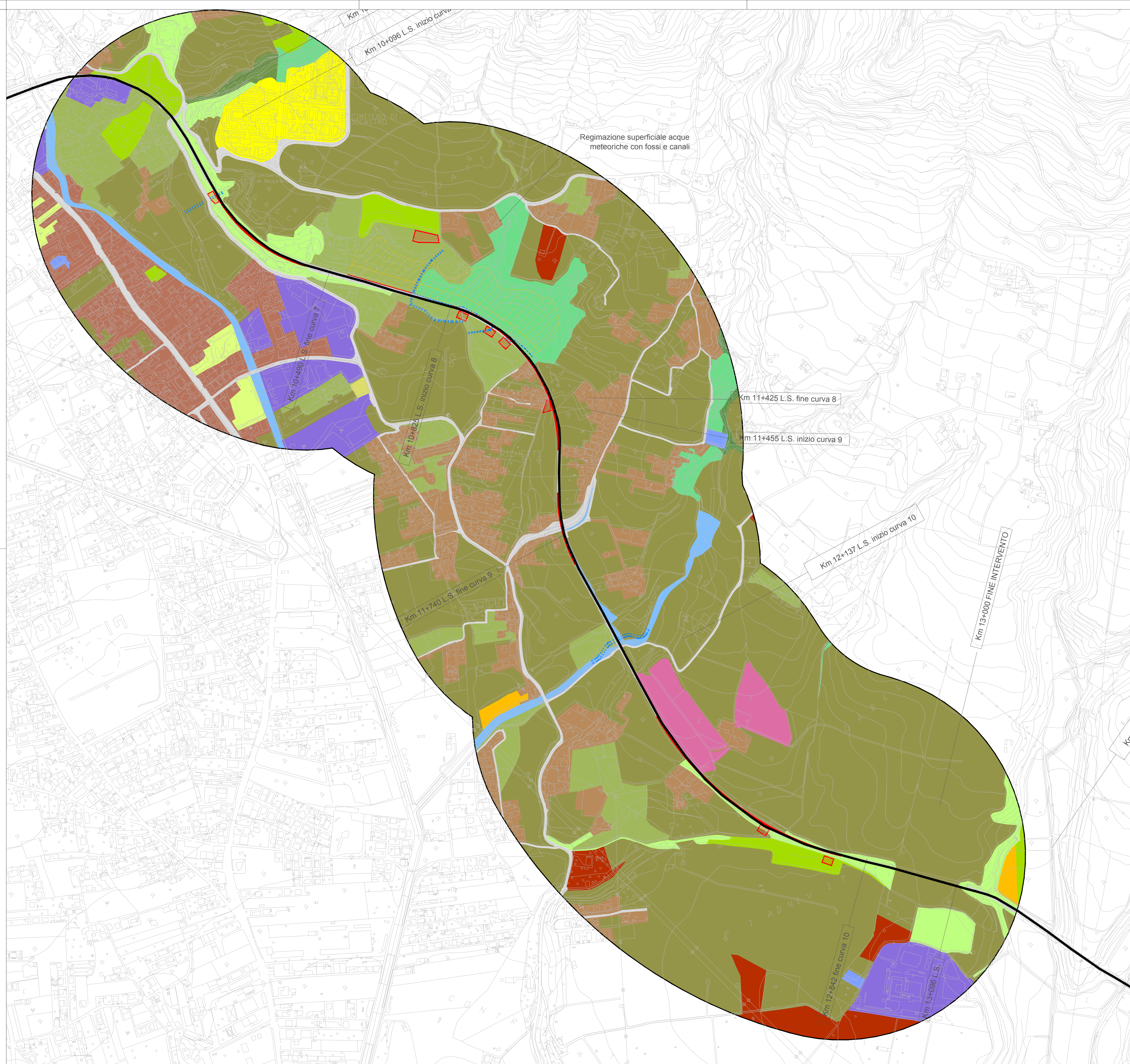
TRATTO C - CARTA DELLA STRUTTURA DEL PAESAGGIO