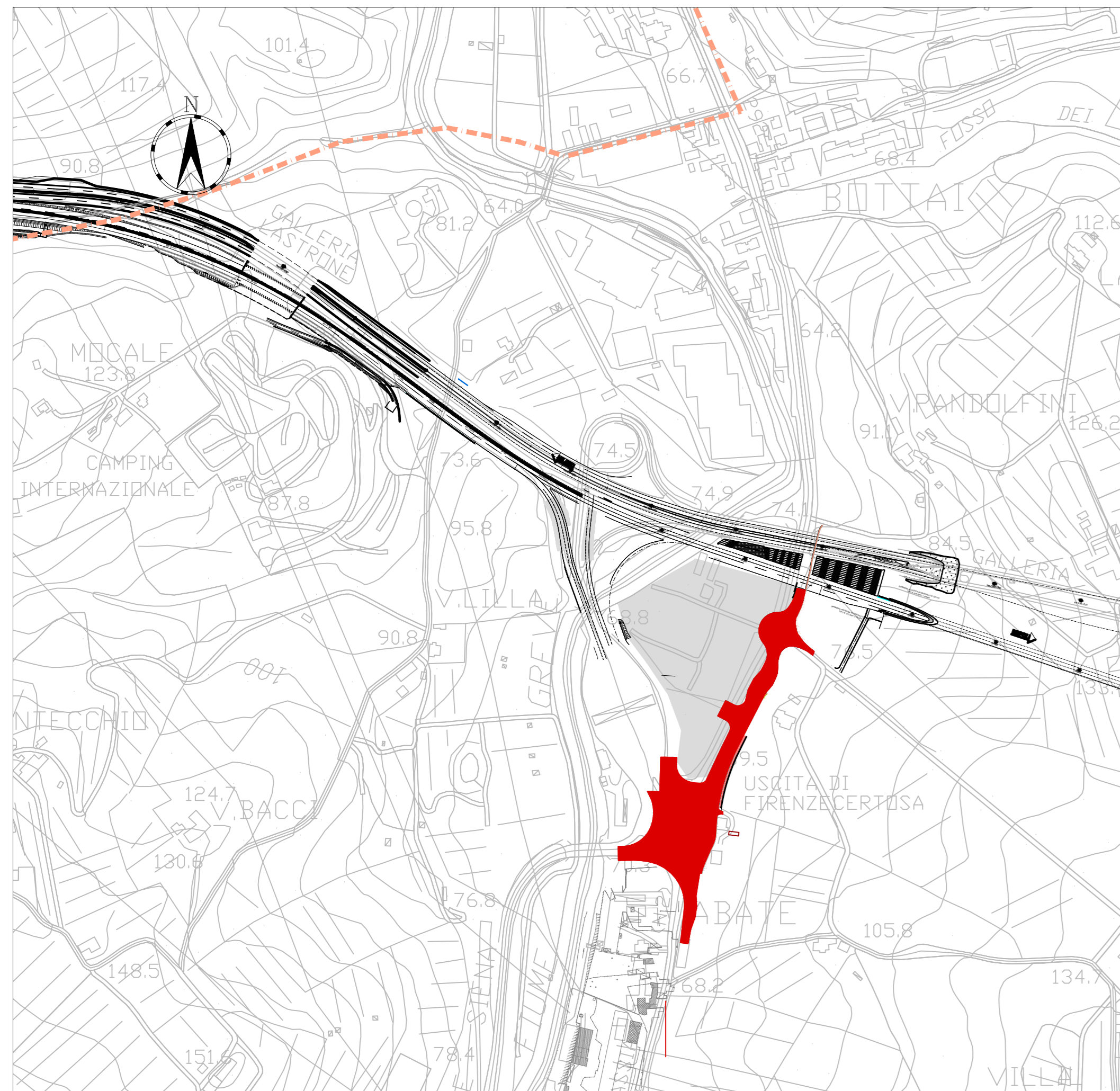
ESTRATTO CTR - AMBITO DI INTERVENTO