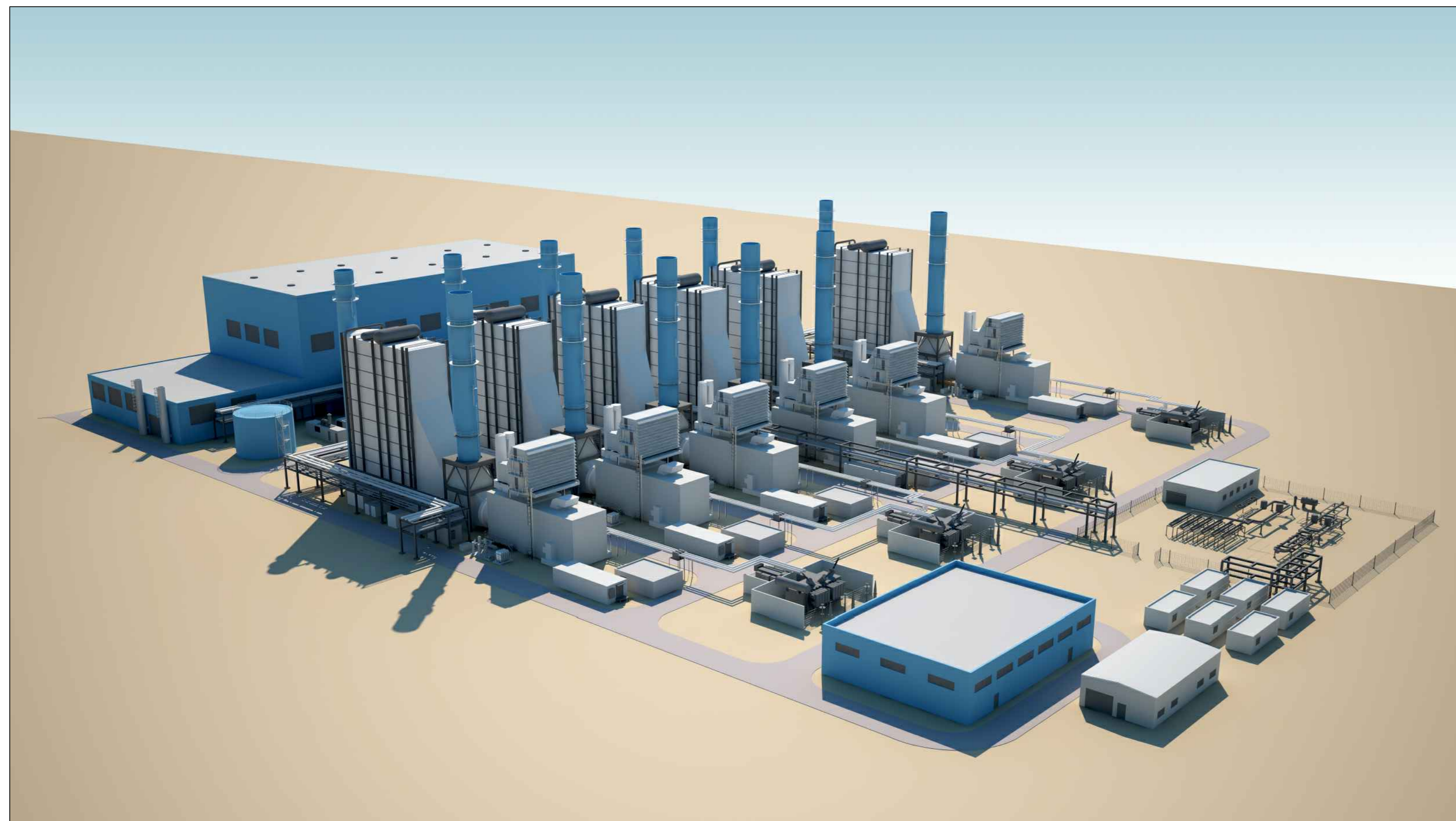
VISTA DA OVEST