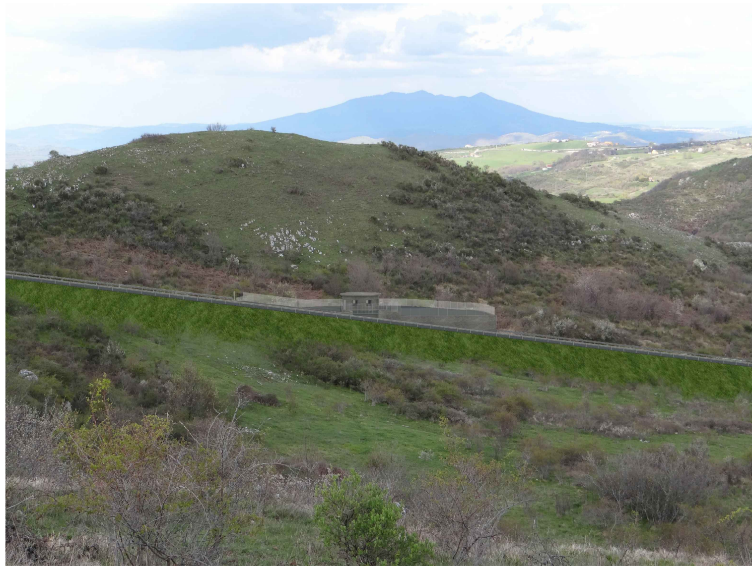
SIMULAZIONE FOTOGRAFICA VISTA DA SUD