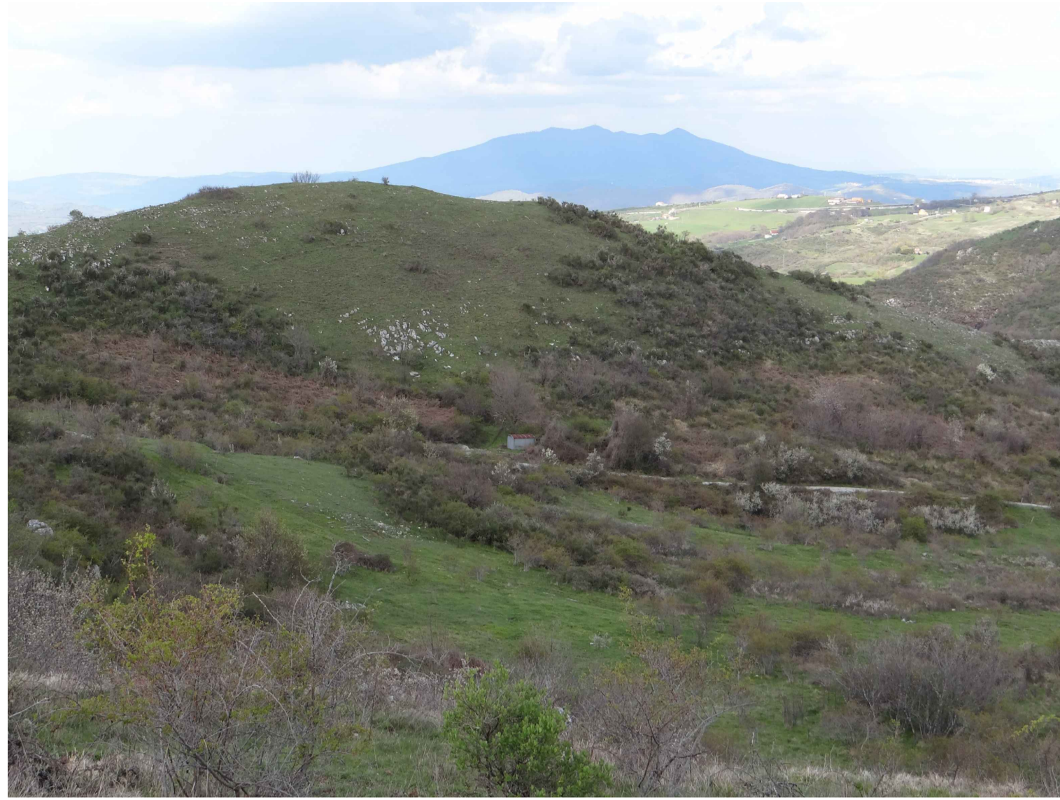
STATO DI FATTO VISTA DA SUD