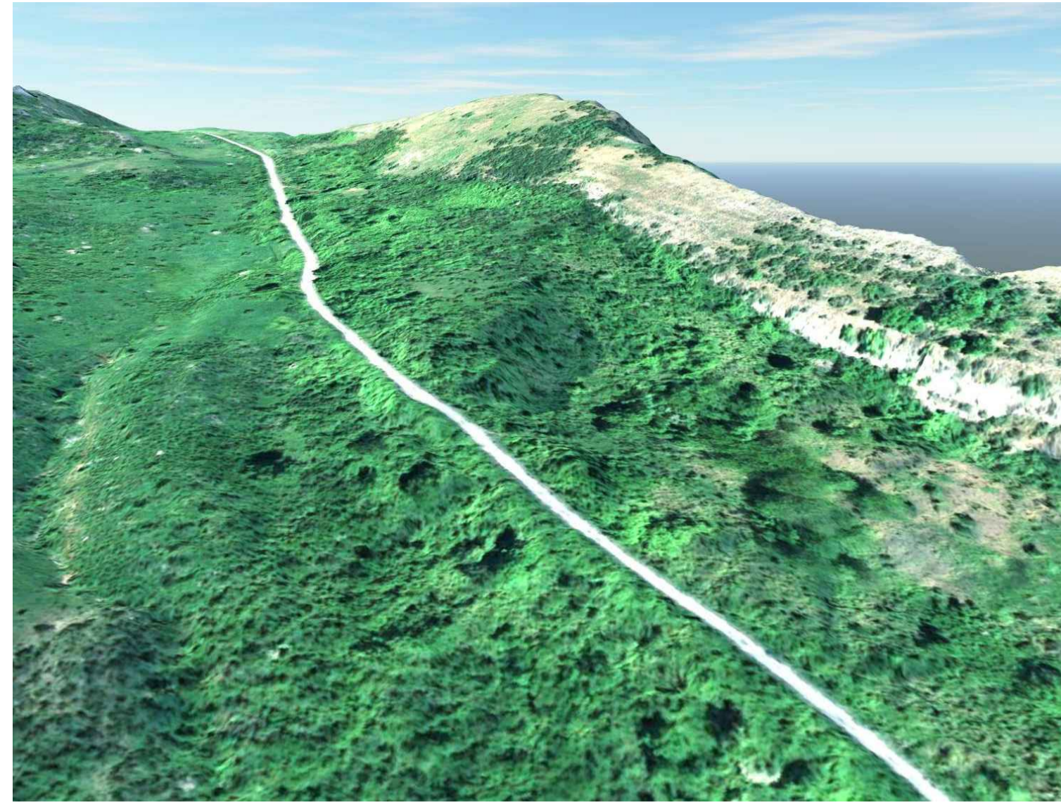
STATO DI FATTO VISTA PANORAMICA