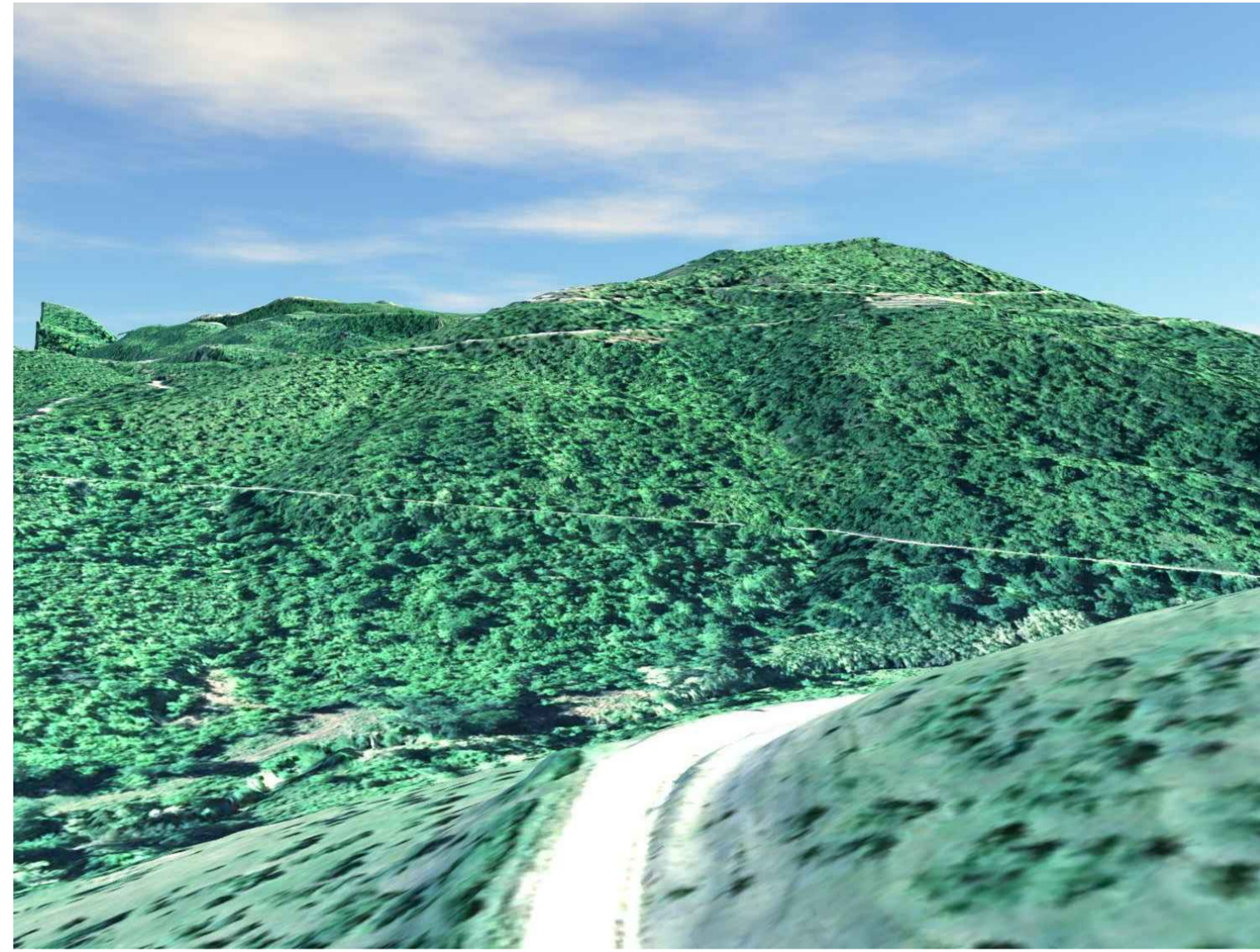
STATO DI FATTO VISTA DA SUD