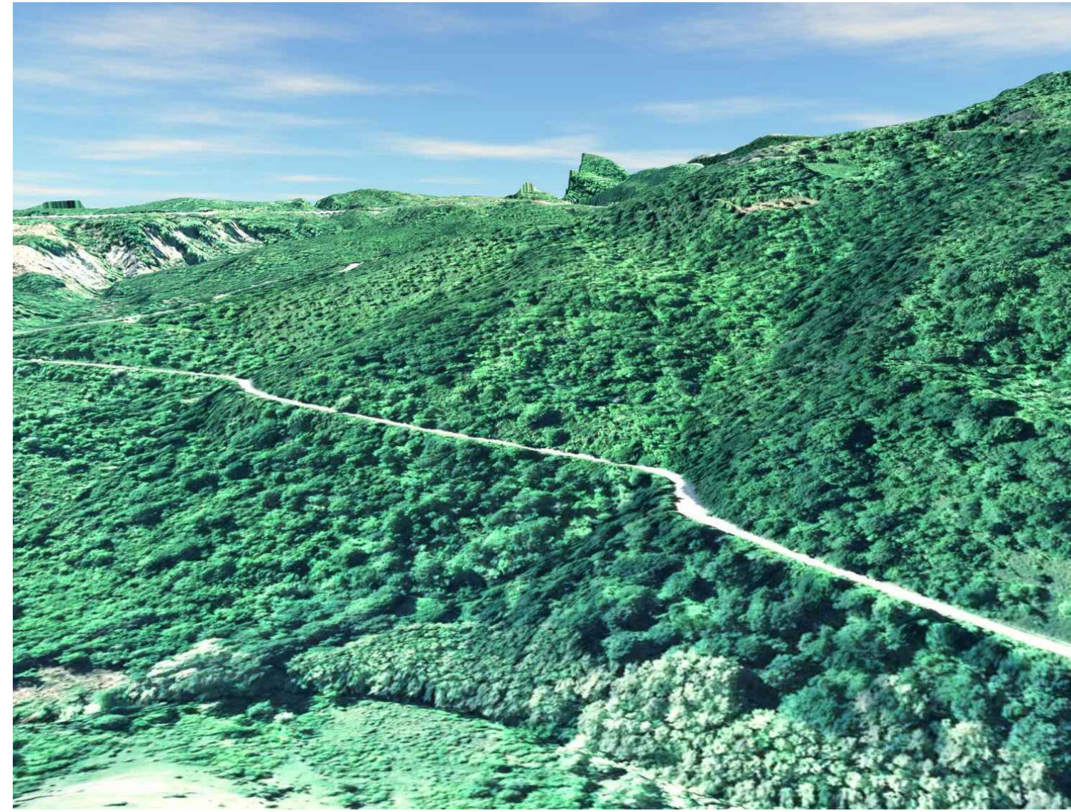
STATO DI FATTO VISTA PANORAMICA