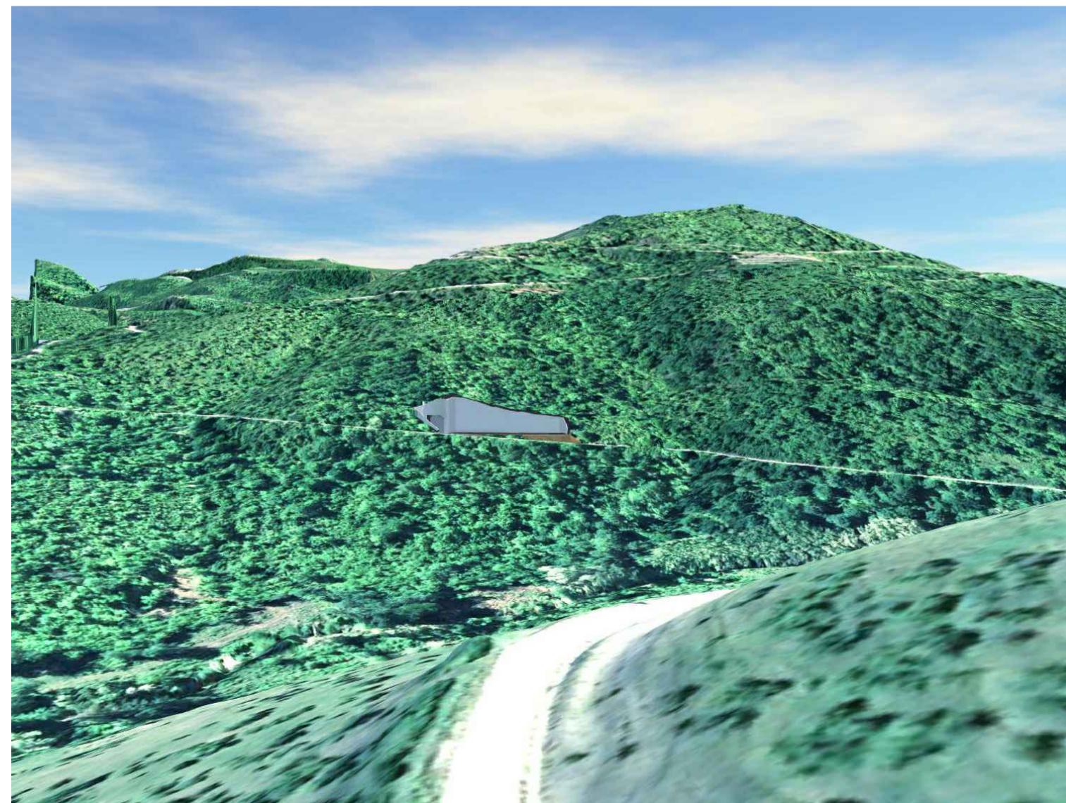
SIMULAZIONE FOTOGRAFICA VISTA DA SUD