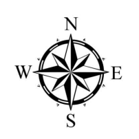
PLANIMETRIA DEL BACINO SCALA 1:500 / 1:1000

SISTEMAZIONE DELL'IMBOCO DELLA DEVIAZIONE DEL TORRENTE FICOCCHIA ED IMMISSIONE DELLA DEVIAZIONE DEL VALLONE DEL PIANO