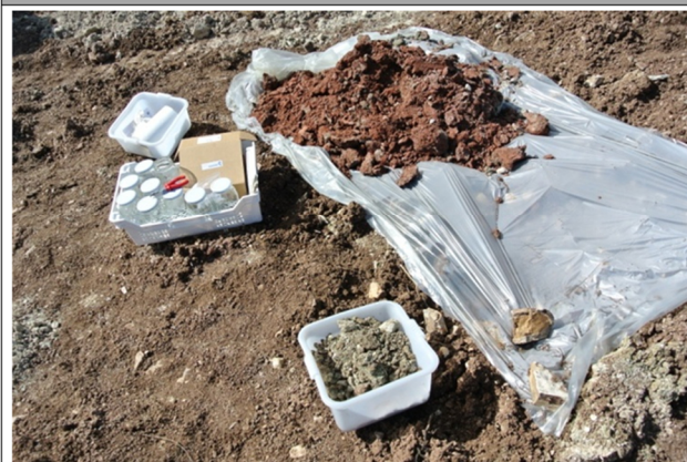
Deposito materiale scavato