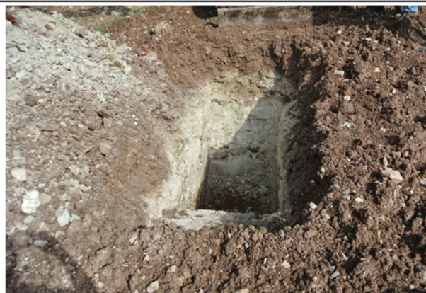
Trincea di campionamento