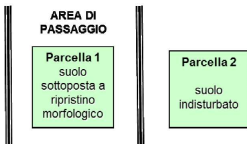
Figura 2. Localizzazione delle particelle che compongono ciascuna area di monitoraggio.

Le aree oggetto di indagine saranno localizzate presso parcelle individuate come nello schema di seguito riportato.