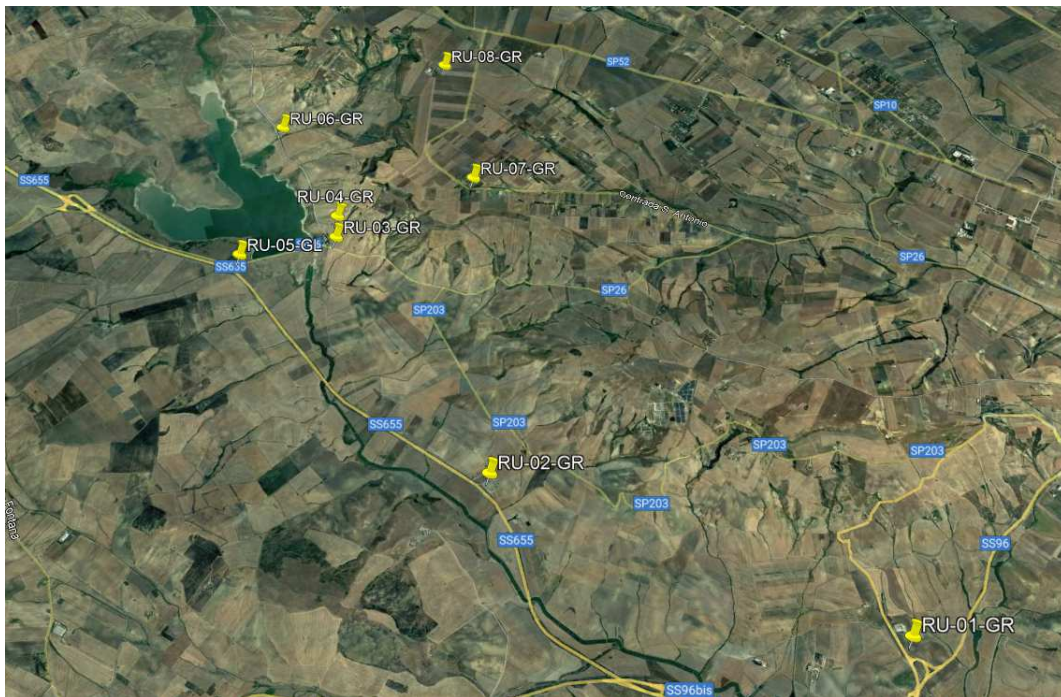
Figura 3. Localizzazione dei previsti punti di monitoraggio del rumore.

sul settore successivo. In fase di esercizio tutte le opere esercitano un impatto nullo sul clima acustico. I punti individuati per il monitoraggio del rumore sono riportati con la sigla RU nella Tav. PD-VI.27 recante "Tavola installazioni e punti di controllo PMA" e sono di seguito elencati e sono illustrati in Figura 3.