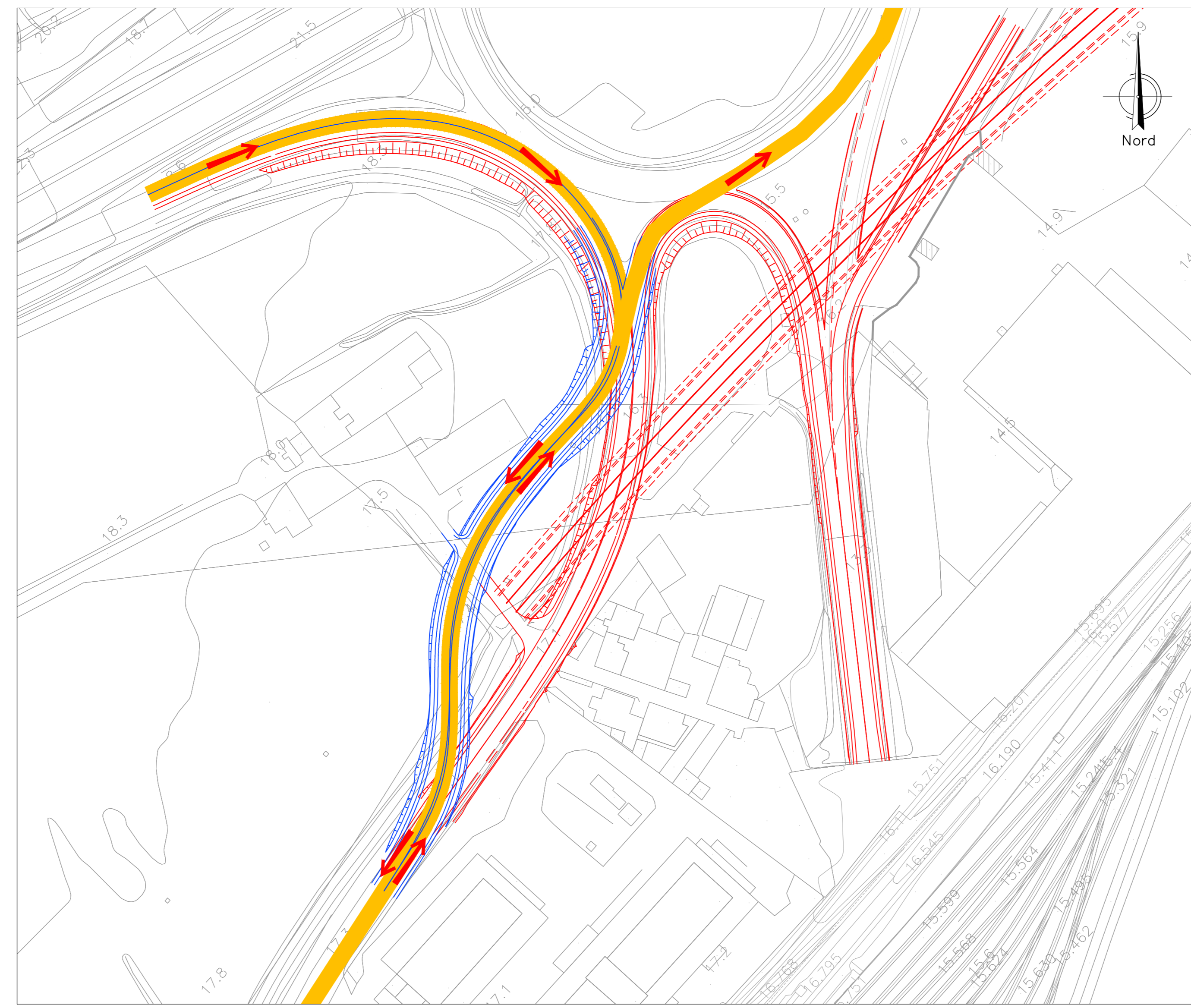
FASE 2 : DEVIAZIONE TRAFFICO SU NV03-E PROVVISORIA E CHIUSURA SVINCOLO

La fase prevede la realizzazione della deviazione NV03-E provvisoria per il traffico in uscita dalla SP701 proveniente da Siracusa verso Strada Comunale Passo Cavaliere. Le rampe esistenti dello svincolo vengono mantenute in esercizio.