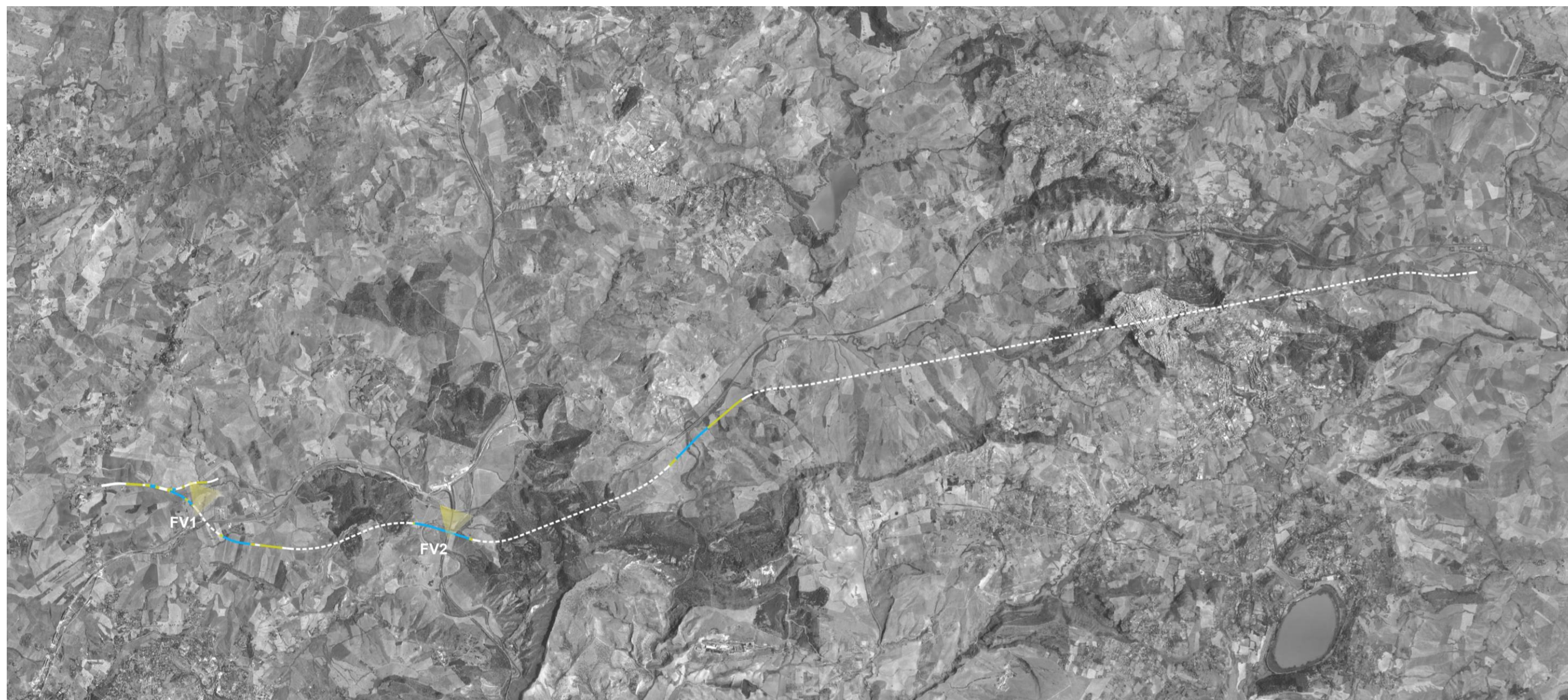
Localizzazione dei punti di vista su foto aerea