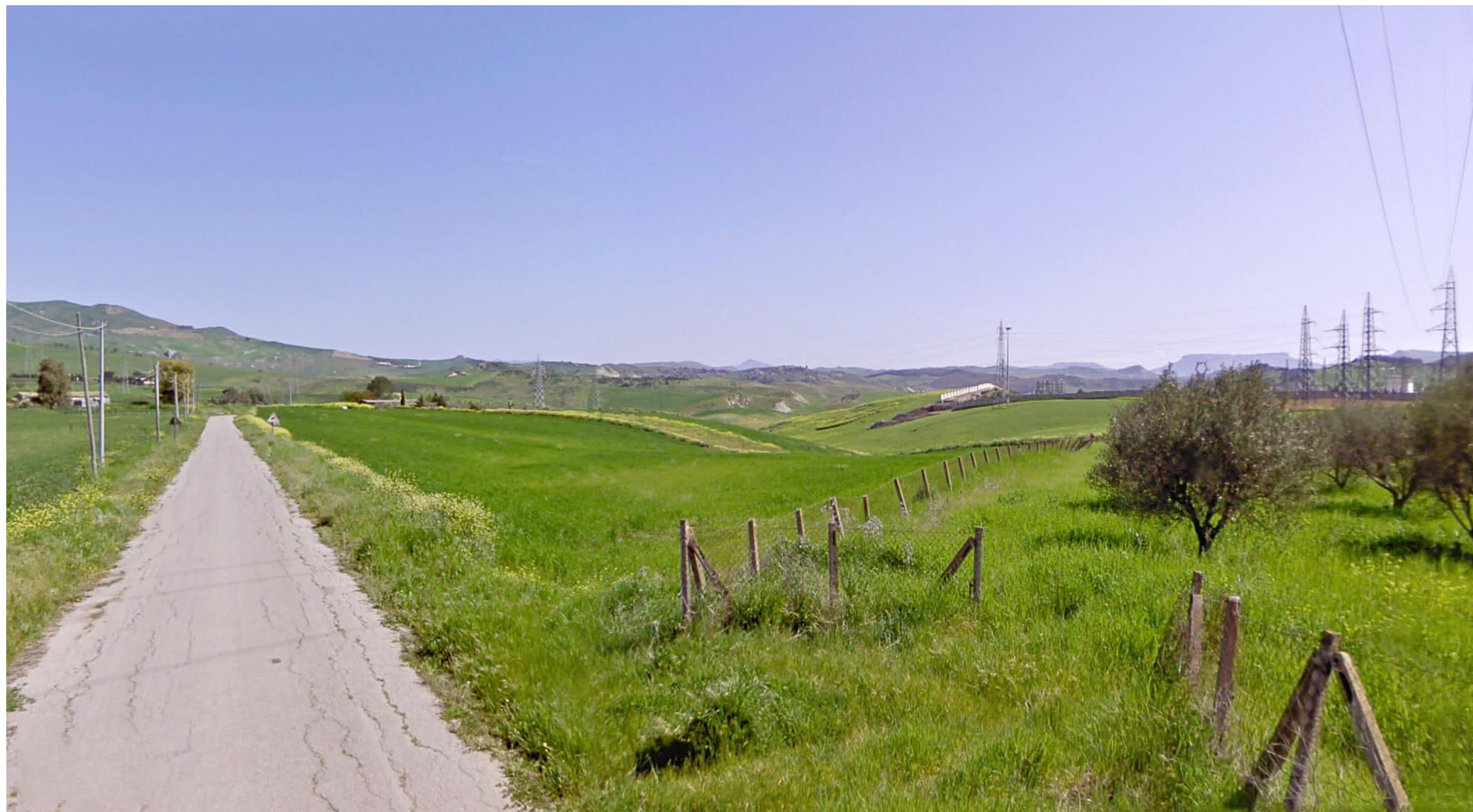
FV1 Ante operam