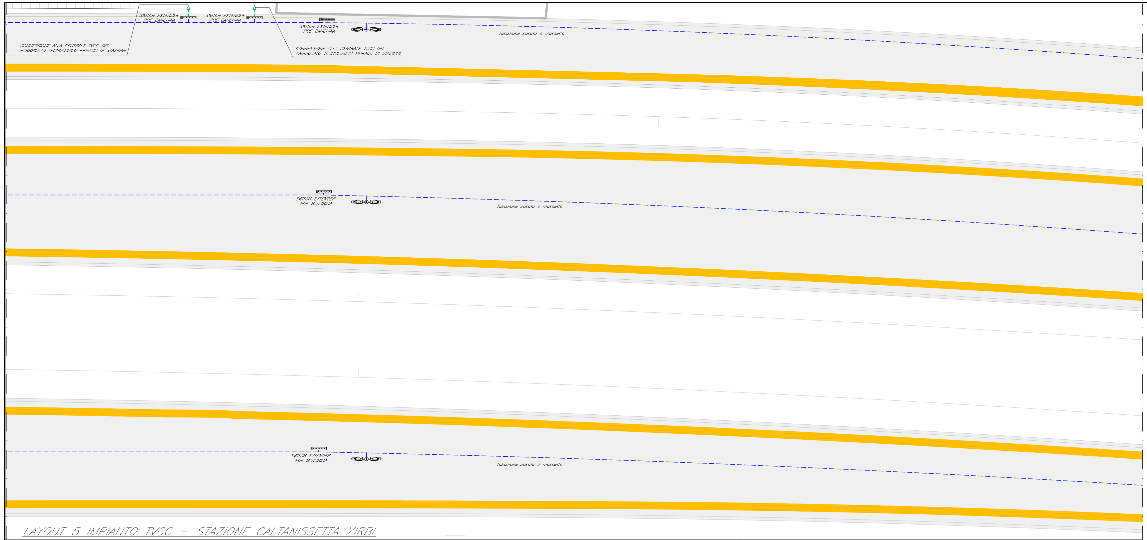
LAYOUT 5 IMPIANTO TVCC - STAZIONE CALTANISSETTA XIRBI