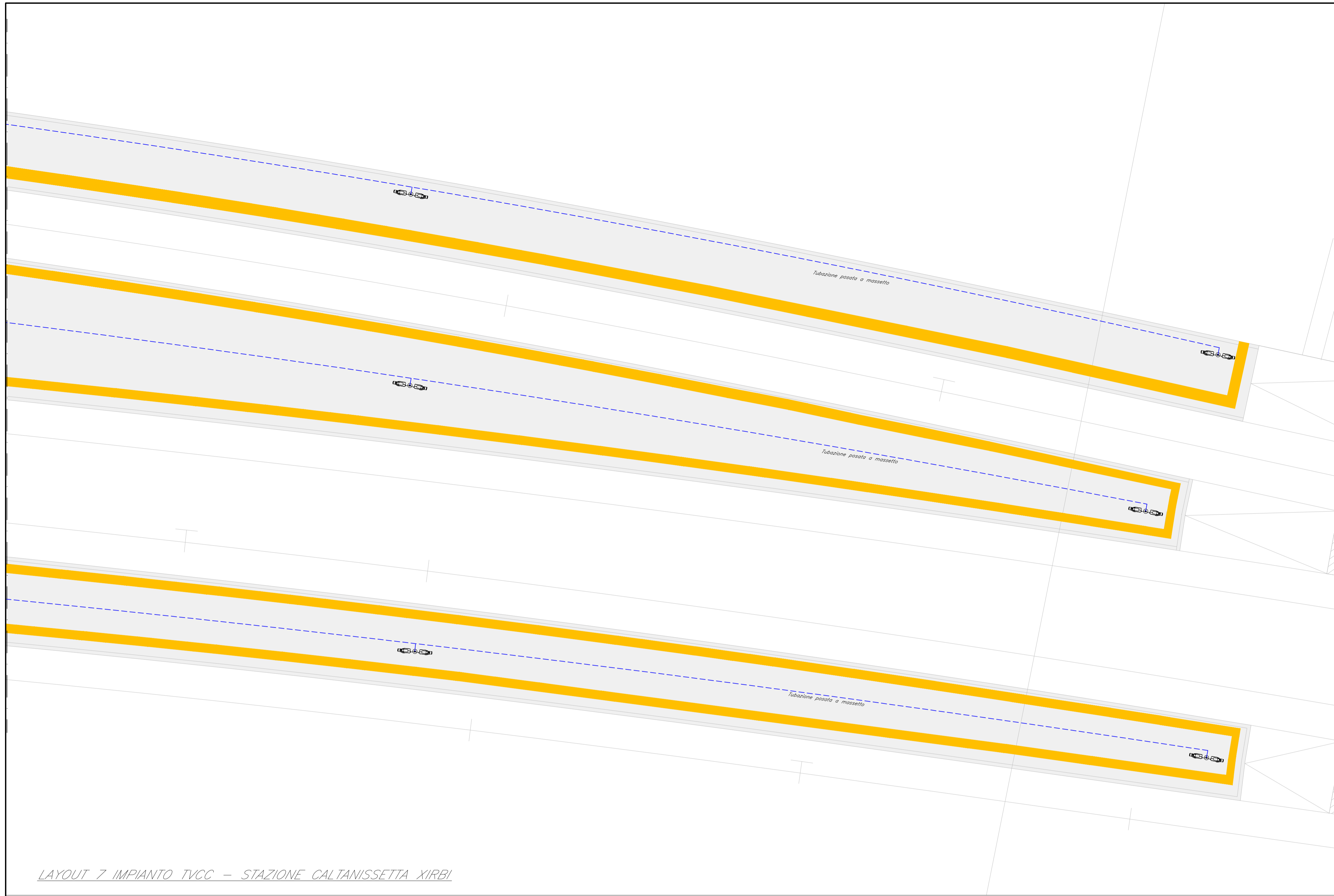
LAYOUT 7 IMPIANTO TVCC - STAZIONE CALTANISSETTA XIRIBI