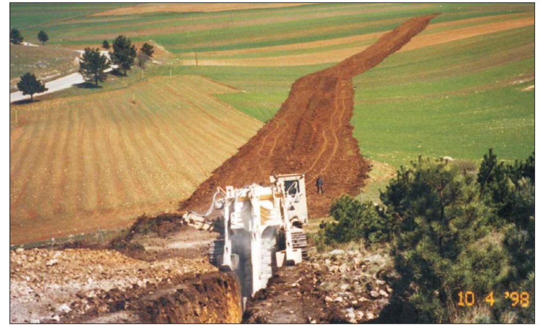
SCAVO DELLA TRINCEA